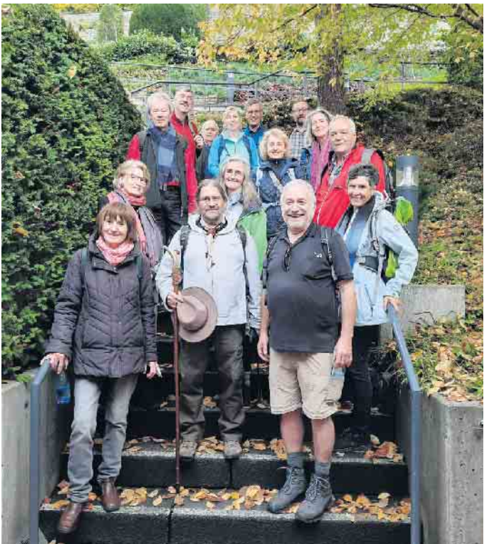
Die Wandergruppe im Garten des Adenauerhauses.