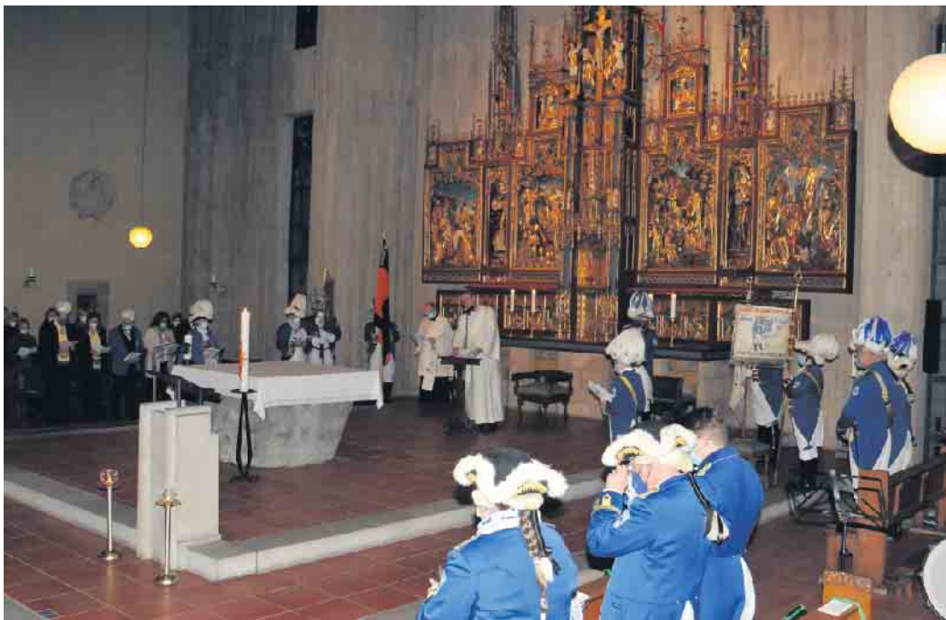
„Fessjoddesdeens op kölsch“ zum Sessionsbeginn: Auch in diesem Jahr starten die Funken Blau-Weiss mit einem Mundartgottesdienst in der Kirche St. Anno in die neue Karnevalssession.

Anschließend marschieren die Funken über die Kaiserstraße zurück zum Rhein Sieg Forum, um dort in stimmungsvoller Atmosphäre ab 19 Uhr auf ihrem „Großen Regimentsap-