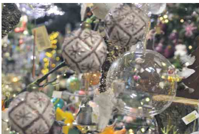
Christbaumkugeln in Hülle und Fülle, für jeden Geschmack ist etwas dabei