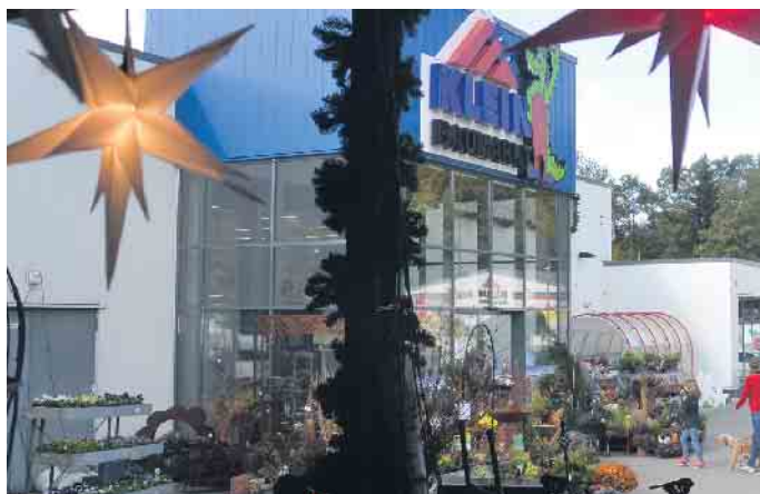
Bereits das Außengelände des Marktes weist auf das kommende Weihnachtsfest hin

(bk) Oberpleis. Im Gewerbegebiet Wahlfelder Mühle findet man einen der schönsten Weihnachtsmärkte des Rhein-Sieg-Kreises. Seit Jahren erwartet die Kundschaft hier in der Vorweihnachtszeit stets etwas ganz Besonderes. In der ersten Etage der Firma „Baustoffe Klein“ befindet sich der wunderschöne „Romantische Weihnachtsmarkt“, ein Geheimtipp für die ganze Familie. Jetzt in der besinnlichen, dunklen Jahreszeit wird es besonders gemütlich im Baumarkt. Neben der liebe- und geschmackvollen Dekoration findet man alle Geschmacksrichtungen. Traditionelles und flippiges, Waldmotive wie Hirsche und Vögel, sowie Pilze, Hagebutten, Eicheln und Tannenzapfen. Weihnachtschmuck in allen Farben, von Kugeln über Sterne bis hin zu Lametta. Das liebevoll zusammengestellte Angebot beinhaltet alles, was das Herz begehrt. Im Detail wurden im Vorfeld all die Weihnachtsartikel durch ein emsiges Team für das Auge so aufbereitet, dass man kaum weiß, wo man beim Betreten des Marktes hinschauen soll. Wenn man die erste Etage des Baumarktes betritt, merkt man, dass man sich nicht mehr in einem normalen Ladenlokal befindet. Damit das Weihnachtsfest auch im richtigen Licht erstrahlen kann, verzaubert ein großes Sortiment, sowohl Innen- wie Außenbeleuchtung, diesen Markt, was die besondere Atmosphäre noch verstärkt. Von LED Beleuchtung bis hin zu traditionellen Wachs-