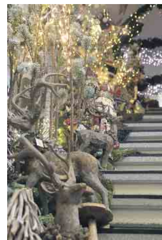
Wenn man die Treppenstufen hinauf in die obere Etage des Baumarktes betritt wartet eine romantische Weihnachtswelt auf die Besucher

Weihnachtsmarkt“ noch nicht kennt, sollte sich die Gelegenheit auf keinen Fall entgehen lassen. Im Baumarkt, In der Brückenwiese 9-13 in Königswinter-Oberpleis findet man neben der Weihnachtsromantik viele außergewöhnliche Accessoires für den Garten. Die Reitsportabteilung lässt das Herz jeder Reiterin oder jedes Reiters höher schlagen. Auch der Angler ist im Baumarkt herzlich willkommen. Auch hier erwartet ihn ein umfassendes Sortiment. Dies noch nicht alles, denn auch das Angebot an Fahrradzubehör lässt jede Reparatur schnell vergessen. Letzten Endes ist es auch noch der Futtermarkt, in dem jegliches Futter für Heim- und Wildtiere angeboten wird.