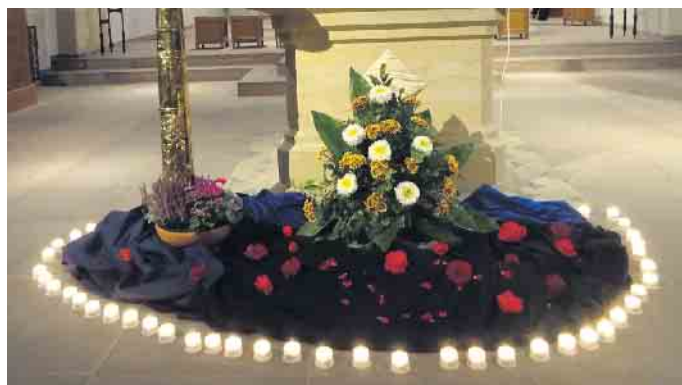
Erinnerungskirchen in der Benediktiner Abteikirche.

Allerheiligen ist das Hochfest im katholischen Kirchenjahr zu Ehren aller Heiligen, sowohl den bekannten und heilig gesprochenen als auch den vielen Frauen und Männern, die tagtäglich aus ihrem Glauben heraus ihren Alltag gemeistert und so Zeugnis der christlichen Botschaft abgegeben haben.