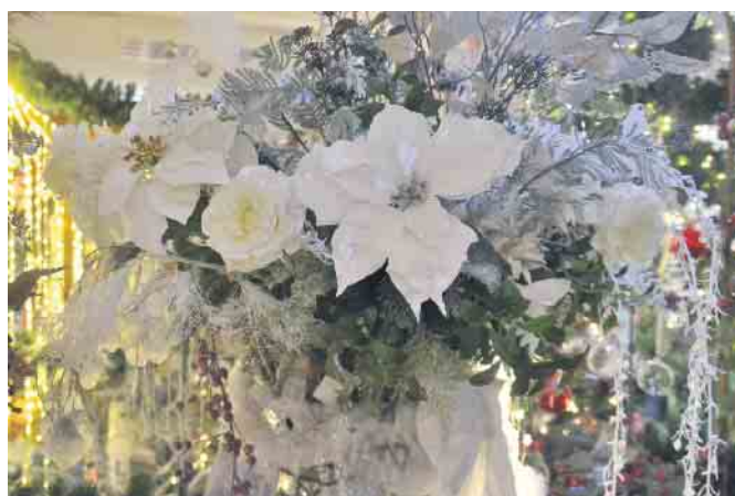
Die Auswahl an Deko-Möglichkeiten zur Weihnachtszeit lässt das Herz höher schlagen