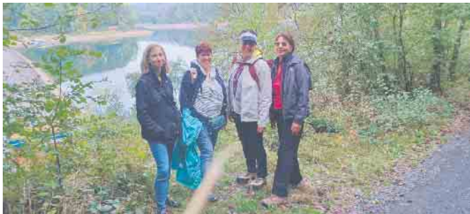
Blick auf die Wahnbachtalsperre