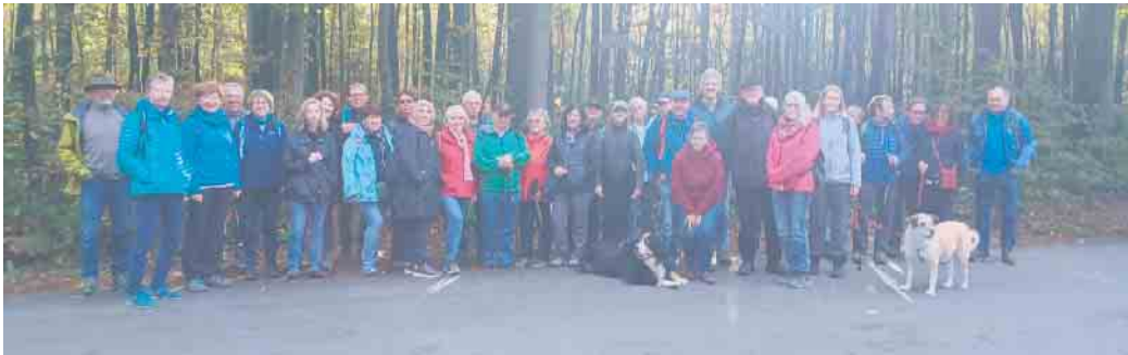
Gruppe mit Hunden

Am 3. Oktober trafen sich circa 35 Mitglieder und Freunde der BG Deichhaus am Siegburger Bahnhof, um mit dem Bus zum Franzhäuschen und von dort zum Startpunkt Siegelsknippen zu gelangen. Bei schönstem Wetter startete von hier aus eine dreieinhalbstündige Wanderung entlang der Wahnbach-talsperre. Am Grillplatz Seligenthal wurde eine Rast eingelegt, bei der man sich aus dem eigenen Rucksack ver-