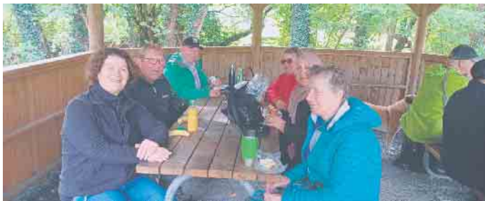
Rast mit Zwischenmahlzeit