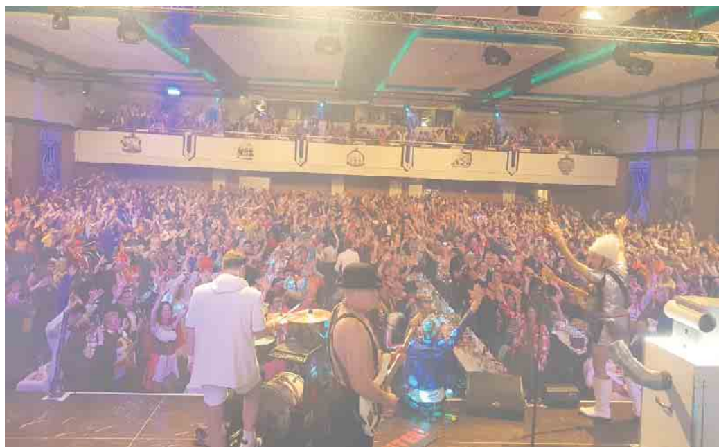
Mega-Stimmung herrscht regelmäßig auch beim „Finale“ der Funken am Karnevalssamstag, hier beim Auftritt der „Big Maggas“ im Jahr 2020.