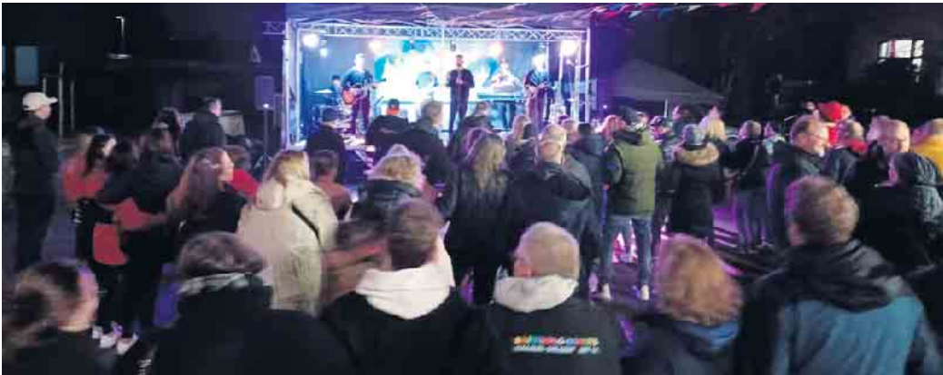
Abschluss mit Cologne Unplugged

einer gelungenen und gut besuchten Jubiläumsfeier trat die Band „Cologne Unplugged“ auf und heizte die Stimmung ordentlich an. Allen Helfern und Sponsoren ein Dankeschön, da ohne sie diese Veranstaltung nicht möglich gewesen wäre.