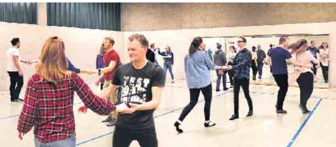
West Coast Swing Tänzer beim Training