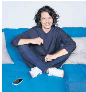
Schauspielerin Ulrike Folkerts leidet nach einem Knalltrauma unter einer Hörminderung.

Das mehrfach ausgezeichnete Hightech-System ermöglicht die komplette Klangvielfalt. Dank einer speziellen Technik erhält das Gehirn alle relevanten Töne - nicht nur Sprache - in optimierter Form. Als Botschafterin möchte Ulrike Folkerts nun auch andere Menschen ermutigen, sich nicht aus falscher Scham mit einem nachlassenden Gehör abzufinden: „Eine Hörminderung oder ein Hörsystem sind kein Makel.“ Sie will zeigen, dass man zu sich und seinem Hörgerät selbstbewusst stehen sollte.