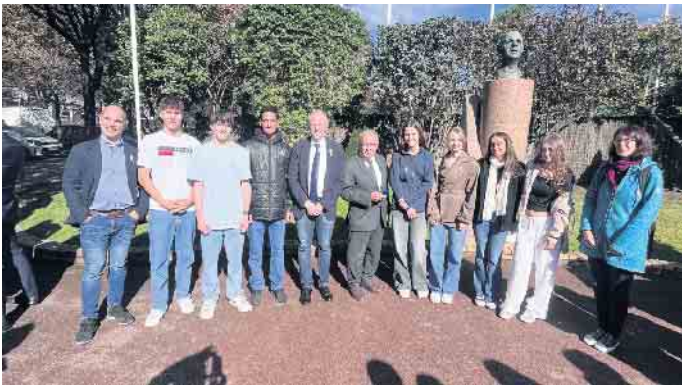
Delegation des Anno beim Empfang.

ten und die gelebte europäische Solidarität. Der Besuch wurde in diesem Sinne vom Deutsch-Französischen Bürgerfonds gefördert.