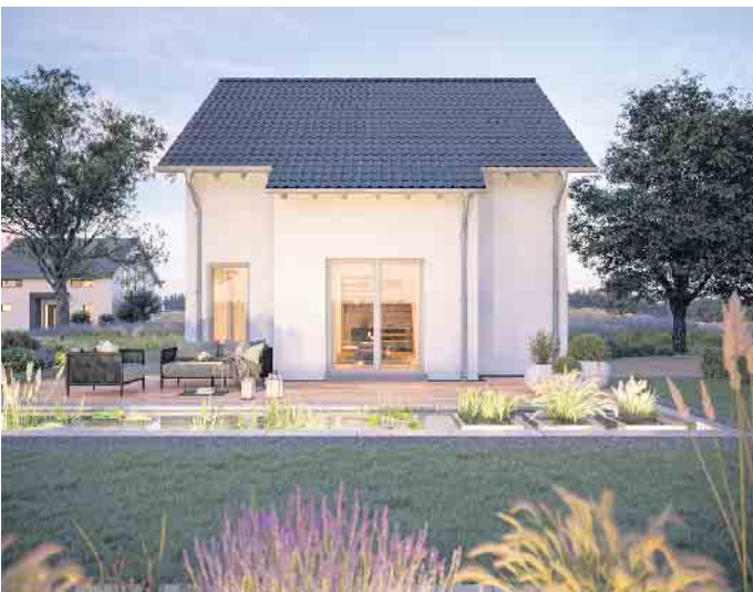
Ein sogenanntes Aktionshaus wird wie abgebildet auf einer Bodenplatte oder einem Keller geliefert. Die grauen Ziegel und folierte Fensterrahmen sind im Lieferumfang enthalten.

Der offene Wohn- und Essbereich im Erdgeschoss mit anschließender Küche wird durch den 8,75 Quadratmeter großen Hauswirtschaftsraum ergänzt. Dieser nimmt die gesamte Haustechnik auf, sodass eine teure Unterkellerung für einen Technikraum nicht notwendig ist, als Fundament genügt deshalb eine Bodenplatte. Im Obergeschoss mit einer Dachneigung von 38 Grad und einer Kniestockhöhe von 1,3 Metern finden zwei große Kinderzimmer, das Elternschlafzimmer und ein helles Familienbad Platz. Das massive Satteldach bietet die Möglichkeit zur Aufrüstung mit einer Photovoltaikanlage. Die Arbeiten bis zum Einzug fallen ausschließlich im Inneren des Hauses an - das macht den Bau wetterunabhängig. Die Eigenleistungen der Baufamilie werden bei der Baufinanzierung als Eigenkapital anerkannt. Viele Familien übernehmen Trockenbau, Fußbodenbeläge sowie Maler- und Tapezierarbeiten selbst. Mit etwas handwerklichem Geschick können auch Heizungs- und Klempnerarbeiten in Eigenregie erfolgen. (DJD)