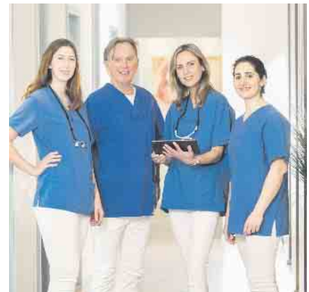
Das Team der dental suite im Kölner Rheinauhafen

Darüber hinaus kommt die Methode auch Angstpatienten sehr entgegen, da der gesamte Behandlungszeitraum (inklusive Vorbereitung und Nachbehandlung) sehr kurz gehalten werden kann.