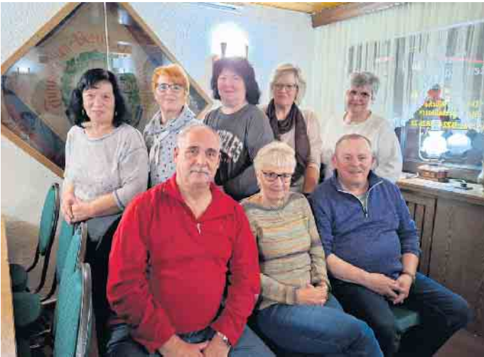
Der alte/neue Vorstand