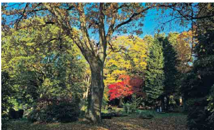
Welche Bestattungsart ist am umweltverträglichsten? Spielen Fragen der Nachhaltigkeit bei Beerdigungen eine Rolle?

Planungen einbeziehen. So entstehen auf Friedhöfen beispielsweise Insektenweiden, Areale mit Bienenstöcken oder naturbelassene Flächen, die den parkähnlichen Charakter mancher Friedhöfe noch stärker betonen. (akz-o)