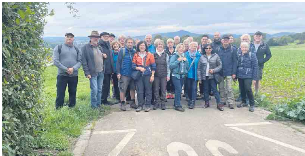
Das Siebengebirge im Rücken

len Beteiligten schon auf das nächste Jahr.