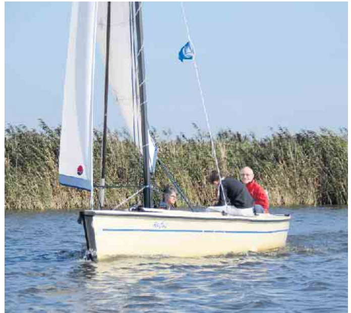
Segeln in den Niederlanden

Weitere Informationen sowie das Anmeldeformular finden Interessierte unter www.segelfreunde-rheinland.de .