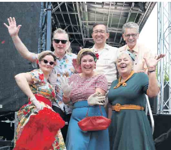
Gut gelaunte Boogies auf dem Weg auf die Bühne