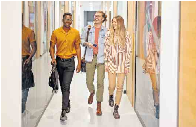
Die Jobs im Bankensektor sind facetten- und abwechslungsreich und für junge Leute attraktiv - oftmals ganz ohne den klassischen Dresscode mit Anzug und Krawatte.

det dort viele Optionen. Das gilt für Fachkräfte aus anderen Branchen, die in ihrer bisherigen Funktion in die Finanzwelt wechseln wollen: „Für frisch ausgebildete oder gestandene IT-Fachkräfte etwa gibt es vielfältige Einsatzmöglichkeiten“, so Weingarz. Aber auch wer sich als Quereinsteiger neu orientieren will, findet bei den Genossenschaftsbanken zahlreiche Chancen. Gefragt sind etwa Berufstätige aus anderen Wirtschaftsbereichen, die über keine Bankausbildung verfügen, aber im Service- und Beratungsbereich der Bank arbeiten möchten. „Durch intensive Trainings werden sie für die neue Tätigkeit fit gemacht und können sich danach durch Fortbildungen in der Bank weiterentwickeln“, betont Weingarz. (DJD)