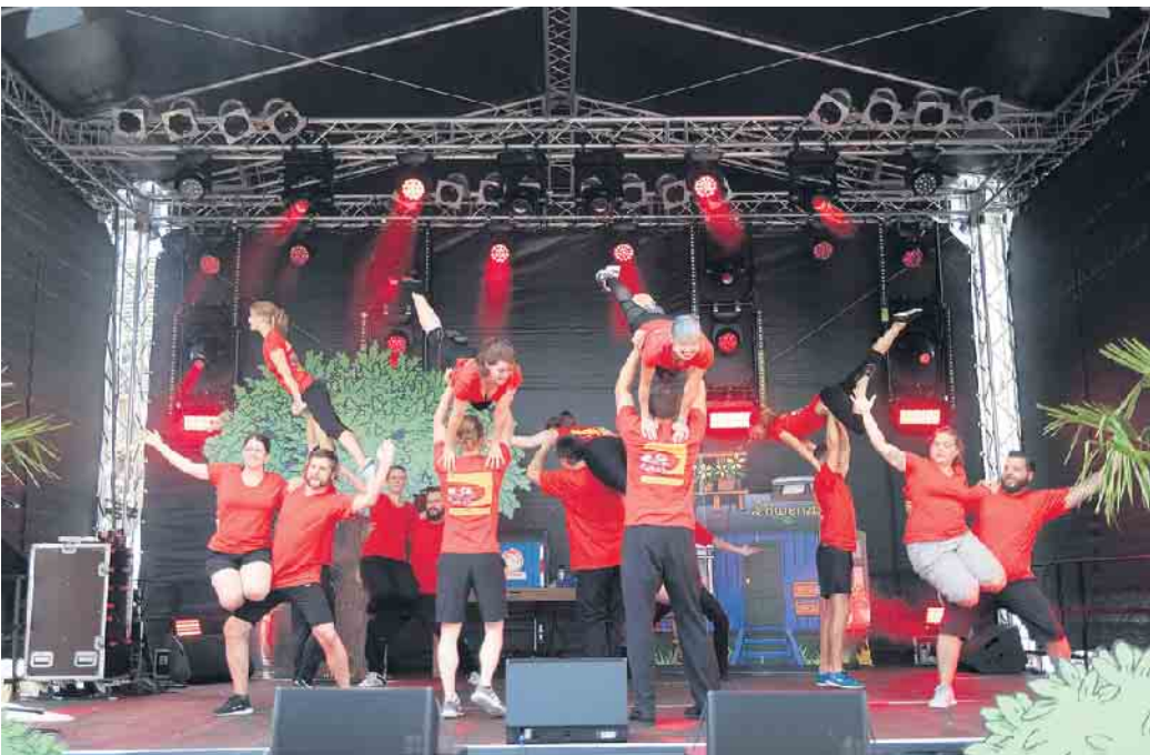
Die Erwachsenengruppe der Rock’n’Roller.