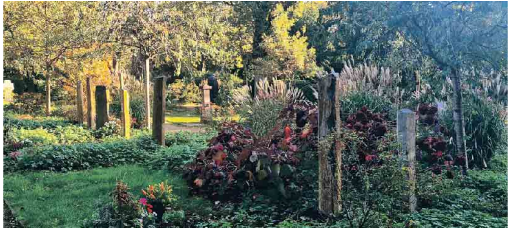
Friedhöfe als grüne Oasen in der Stadt - Gemeinschaftsgrabanlage Nordfriedhof Düsseldorf.

Der Schlüssel liegt im vertrauensvollen Austausch mit einem Bestattungshaus. In einem persönlichen Beratungsgespräch können