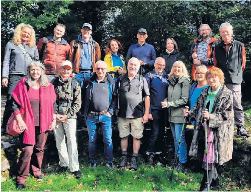
Die Wandergruppe auf dem höchsten Punkt des Petersbergs.