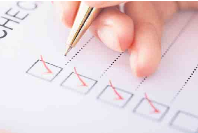
Mit einer Checkliste gewinnt man den systematischen Überblick über alle im Bauprozess entstehenden Kosten.

Die Bauleistungsversicherung etwa umfasst alle Zerstörungen und Beschädigungen an Bauleistungen und -material, die während der Bauzeit auf der Baustelle unvorhergesehen eintreten. (djd)