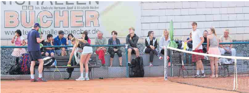
Die Zuschauer sahen schöne Ballwechsel und drückten ihren Favoriten beide Daumen.