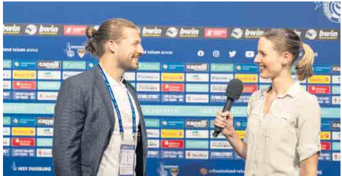
Reporter und Journalisten sind ganz nah dran an den wichtigen Leuten des Sportbusiness. Hier ist die richtige Kommunikation ausschlaggebend.