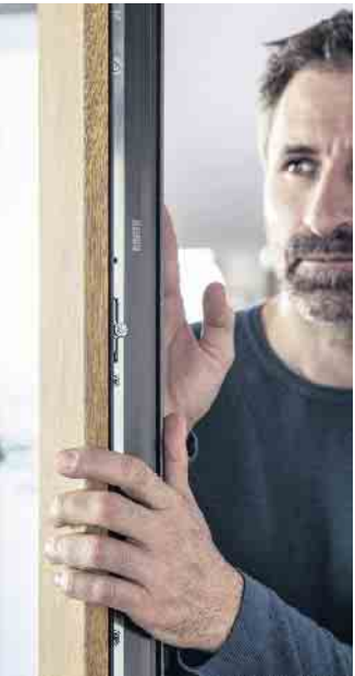
Bei einem Wechsel von alten zu modernen Fenstern verbessern sich die Energieeffizienz, der Schallschutz und die Optik.

Weiß mit einem Außenrahmen, der farblich auf die Hausfassade abgestimmt ist. Dabei können sich die neuen Fenster beinahe jeder Gelegenheit in der Bestandsimmobilie anpassen. (DJD)