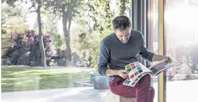
Welche Farbe soll es werden? Fensterrahmen gibt es in verschiedenen Tönen und Optiken.

Neue Fenster sorgen in der Regel auch für einen besseren Lärmschutz und dadurch für eine erhöhte Wohnqualität. Die Nachbarkinder, die laut auf dem Trampolin toben oder der bellende Hund von gegenüber sind nicht mehr so stark zu hören. Zudem hat man mit einer Renovierung auch gleich die Möglichkeit, die Optik des Hauses aufzufrischen. Fensterprofile aus Kunststoff sind beispielsweise in bunten Farben, in täuschend ech-