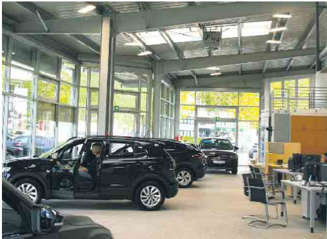
Der moderne Verkaufsraum der neuen Autowelt von Hoff