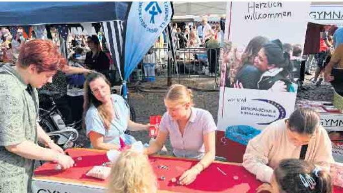
Am Stand des GSA war für jeden etwas dabei.

Das GSA beim 20. Internationalen Kinder-, Jugend- und Sportfest in Siegburg