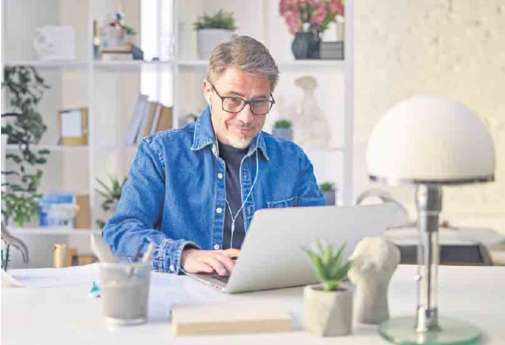
Ob jung oder nicht mehr ganz so jung: Eine Umschulung ist für jeden zu bewältigen und kann zum neuen Traumjob führen.

Es ist empfehlenswert, Beratungsgespräche mit verschiedenen Anbietern zu führen. Dort geht es dann nicht nur um inhaltliche Themen, sondern auch darum, ob man sich beim Bildungsträger wohlfühlt. Diese Beratungen sind unverbindlich und kostenlos. (DJD)