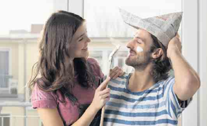
Wer ein altes Haus renoviert, kann ihm neues Leben einhauchen und alles nach den eigenen Wünschen gestalten.

Geld sparen durch gute Dämmung: Moderne Fenster machen Häuser zukunftssicher