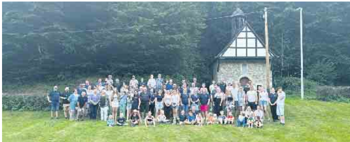
Ausflug der „Funken-Familie“: Ein „Familienfoto“ der fleißigen Wanderer und Radfahrer der Funken Blau-Weiß durfte nach deren „Wiedervereinigung“ in Seligenthal natürlich nicht fehlen.

verbringen. Der Tag begann mit zwei abwechslungsreichen Aktivitäten: Eine Gruppe startete von Stallberg aus zu einer Wanderung, während eine andere Gruppe eine Radtour von der Funkenhalle unternahm. Ziel beider Gruppen war der idyllischen Spielplatz im Siegenthal, wo sie nach ihren jeweiligen Touren eintrafen. Beide Routen boten herrliche Ausblicke und ermöglichten den Teilnehmern, in entspannter Atmosphäre miteinander ins Gespräch zu kommen. Am Ziel angekommen, warteten bereits frisch gegrillte Würstchen und kühle Getränke auf die Blau-Weißen. Der Abend wurde mit einem gemeinsamen Grillen eingeleitet, und schon bald herrschte eine fröhliche und ausgelassene Stimmung. Bei erfrischenden Getränken, leckerem Essen und stimmungsvol-