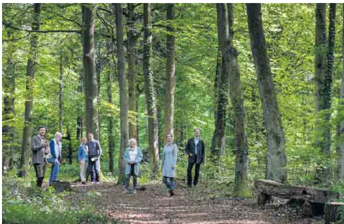
Bei Waldführungen klären Förster transparent über die Kosten einer Beisetzung unter Bäumen auf.

Vorsorgen heißt auch, sich einen Kosten-Überblick zu verschaffen