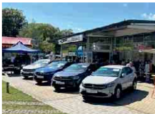
Einweihung Ende August: In der neuen Autowelt von Hoff in Sankt Augustin werden preiswerte Gebrauchte und Jahres- und Werkswagen angeboten.

Was macht man, wenn man wenig Parkplatz um sein Autohaus hat und ein 9000 qm-Grundstück in der Nähe erwerben und für preissensible Kunden in der Nachbarschaft eine neue Verkaufsstätte mit Showroom eröffnen kann? Die Hoff-Gruppe um Gesellschafter Gerhard Hildenbrand, der seit 2008 als Eigentümer den steten Ausbau der Gruppe betreibt, ließ sich diese Angebote nicht entgehen und