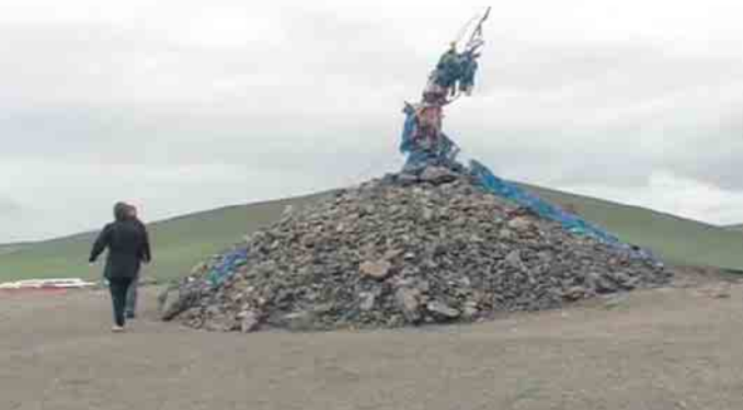
heilige Steininformationen im Nationalpark

Siegburger Filmclub lädt ein: 7. Oktober, Beginn: 19.30 Uhr