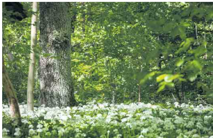
Im Bestattungswald schmückt allein die Natur die Gräber - Kosten für die Grabpflege, Prunk und Protz entfallen.

Die bemerkbaren Preissteigerungen in vielen Bereichen des Lebens machen auch vor der Bestattungsbranche nicht Halt. Über einen Zeitraum von zwei Jahren sind Begräbnisse in Deutschland um fast zehn Prozent teurer geworden. Dies ergab eine Auswertung von Daten des Statistischen Bundesamtes, vorgenommen von Aeternitas e.V., der Verbraucherinitiative Bestattungsvorsorge gehört daher, sich über die Kosten zu informieren, die auf die Angehörigen zukommen werden, und hier auch auf sogenannte versteckte Ausgaben zu achten. Was bezahlt man wofür?