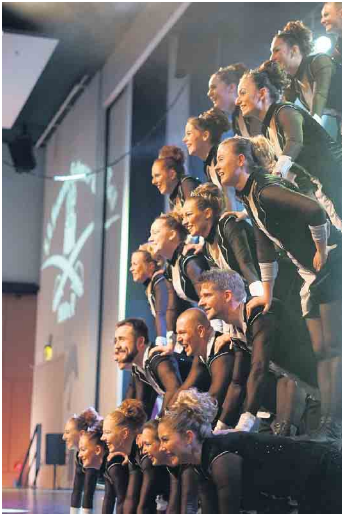
Seniorentanzcorps Husaren Schwarz-Weiß beim Auftritt