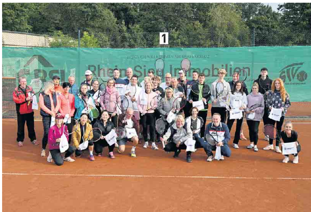
Viele Teilnehmer beim Goldstein-Röseler-Cup 2022, insgesamt starteten 19 Paare

Tennisabteilung „Am Grafenkreuz“ des Siegburger Turnvereins (STV) schloss mit Goldstein-Röseler-Cup 2022 Sommer-Saison ab