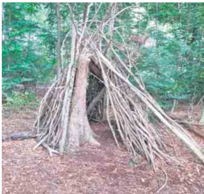
Kinder haben in unmittelbarer Nähe der künftigen Schonung bereits einen Treffpunkt eingerichtet.

Gut angelaufen ist übrigens die am ersten Sonntag im Oktober vom Kaldauer Ortsausschuss gestartete Aktion zur Bepflanzung einer vom Borkenkäfer befallenen und deshalb gerodeten ehemaligen Fichtenschonung mit Laubbäumen. Ziel ist die Anpflanzung von 200 Setzlingen, vorwiegend Rotbuchen. Gerne können sich weitere Spender zur Finanzierung der Setzlinge beim Ortsausschuss (KA-ULTONDAR@outlook.de) oder bei der Veranstaltung am 16. Oktober melden.