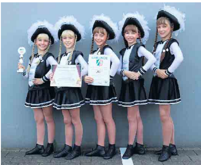
Junioren der KH Husaren schwarz/weiss 1950 e.V.

Die 34. Nordrhein-Westfalen-Meisterschaften der RKK waren ein Fest der Gemeinschaft, ein Treffpunkt für Vereine, Tänzerinnen, Tänzer, Familien und Freunde. Mit großem sportlichen Ehrgeiz, aber auch mit viel Freude und gegenseitigem Respekt trugen die Teilnehmenden dazu bei, dass diese Meisterschaft ein unvergessliches Erlebnis wurde. Die Ausrichter und Organisatoren zeigten sich nach Abschluss der Veranstaltung zufrieden über den reibungslosen Ablauf und den großen Zuspruch, und alle sind sich einig: Schon jetzt steigt die Vorfreude auf die nächste Meisterschaft.