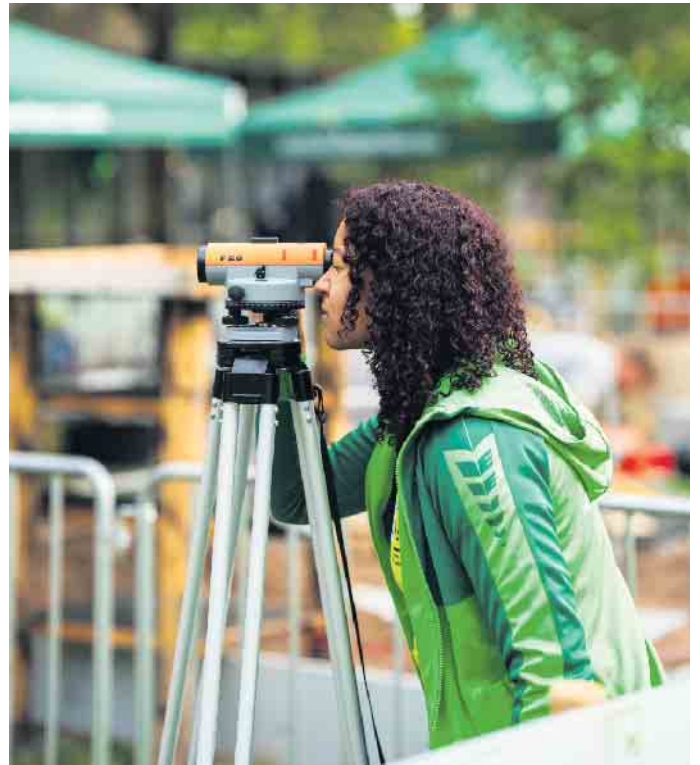
Für die exakte Vermessung werden hochmoderne Laser eingesetzt.