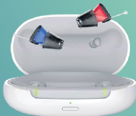
Silk Charge&Go IX

Das beliebteste Im-Ohr-Hörgerät von Signia