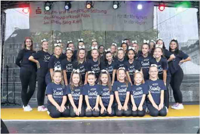
Die Saints Cheerleader auf der Bühne

Internationale Erfolge: Auf dem Weg zu den Summits Besonders hervorzuheben ist die sportliche Qualifikation der Saison 2024/2025: Die Petite Saints (7 bis 12 Jahre) haben sich für die „Youth Summits“ in den USA qualifiziert und die Spirit Saints (ab 15 Jahren) treten bei den „Summits“ an. Beide Wettbewerbe gelten als