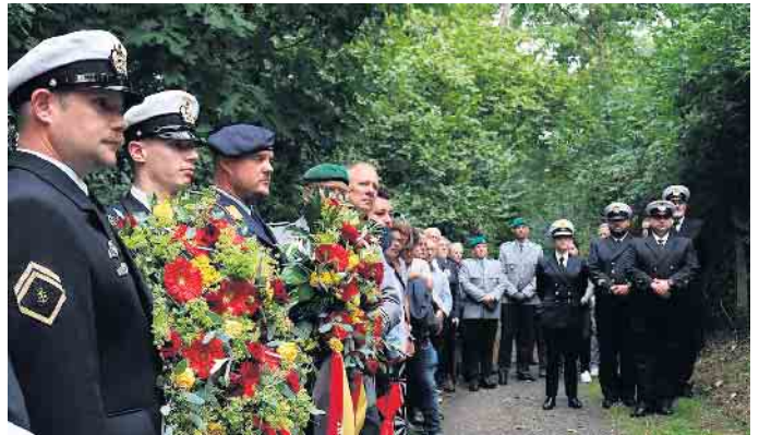
Anteilnahme der Gäste