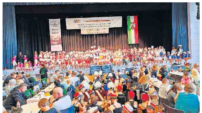
Gruppenbild der Gewinner/Gewinnerinnen auf der Bühne

begeistern ließen. Gardetanzsport ist weit mehr als ein Hobby. Er gilt als echter Extremsport, der von den Aktiven Höchstleistungen verlangt. Beweglichkeit, Kondition, Körperbeherrschung und Teamgeist müssen perfekt zusammenspielen, damit die anspruchsvollen Choreografien gelingen. „Wer hier mithalten will, braucht nicht nur jahrelanges Training, sondern auch Herzblut und Leidenschaft“. Genau diese Begeisterung war in Hennef in jedem Tanz, in jeder Bewegung und jedem Lächeln der Aktiven spürbar. Die Meisterschaften zeigten, welche Bedeutung der Gardetanzsport in Nordrhein-Westfalen hat: