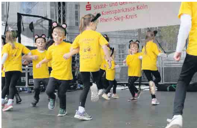
Tanzmäuse beim Auftritt auf der Bühne

Jugend-, Kultur- und Sportfest der Stadt Siegburg haben die fleißigen Mäuse gleich zwei Tänze einstudiert. Mit Mausschminke im Gesicht und Plüschohren auf dem Kopf verzaubern sie das Publikum auf dem Siegburger Marktplatz. Am Informationsstand des Tanzvereins haben auch viele neu