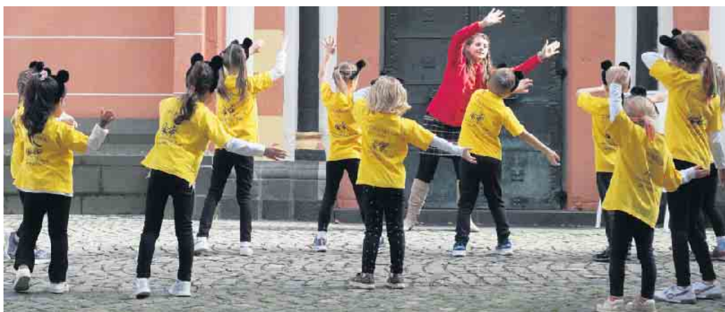
Letzte Probe vor dem Auftritt mit der Trainerin

alter (3 bis 6 Jahre) per Mail für kostenlose und unverbindliche Schnuppertrainingstage anmelden. Die Tanzmäuse des RRC Siegburg werden kindgerecht an die Grundlagen des Tanzens herangeführt und genauso in ihren motorischen Fähigkeiten gefördert. Die begrenzten Plätze für die Gruppen am Montag (17 bis 18 Uhr) und am Freitag (16.30 bis 17.30 Uhr) werden nach Eingang der E-Mails vergeben. Eine Anmeldung vorab ist unbedingt erforderlich, bitte per E-Mail unter jugendwart@rrc-siegburg.de an die Jugendwartin Jana Jones. Geben Sie bei der Anmeldung Namen & Geburtsdatum des Kindes sowie den Wunschtrainingstag an. Sie erhalten dann eine Bestätigung mit den genauen Terminen. Bei Rückfragen ebenfalls per Mail melden. Auch für ältere Kinder / Jugendliche und Erwachsene bietet der Rock’n’Roll Club attraktive Einstiegsangebote im Oktober an. Nehmen Sie gerne Kontakt mit uns auf.