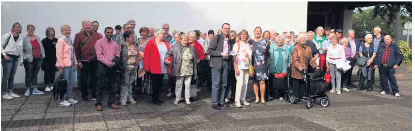
Teilnehmer mit Frau Bühl von der KSK Köln

Dienstag, 13. September, war es wieder soweit! Die Interessengemeinschaft der Wolsdorfer Vereine 1966 e. V. hatte zur 52. Seniorenfahrt eingeladen. Pünktlich fuhr eine Busse mit 75 Senioren von der Ortskirche St. Dreifaltigkeit in Siegburg-Wolsdorf zum Wasserbahnhof in Mülheim an der Ruhr. Nach einer staufreien Fahrt kamen die Busse zur vorgeplanten Zeit am Wasserbahnhof, der auf der Schleuseninsel der Ruhrschleuse Mülheim steht, an. Nachdem die Senioren das Schiff der „Weißen Flotte“ geentert hatten,