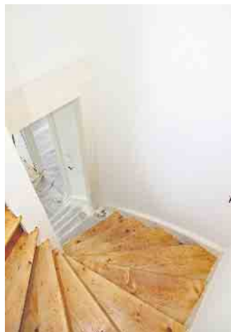
Experten und deren Gutachten helfen dabei, den Zustand einer älteren Immobilie und den Aufwand für ihre Sanierung zu planen.

die Einschätzung der zu erwartenden Sanierungs- und Modernisierungskosten. Seriöse Verkäufer oder Makler werden einer solchen Begehung zustimmen. Wenn nicht, rät BSB-Sprecher Stange zu Vorsicht, da der Anbieter möglicherweise bewusst Schwächen des Gebäudes verbergen möchte. (djd)