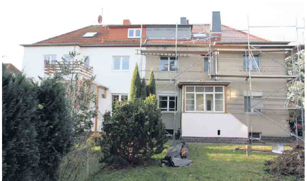
Wer den Kauf eines Altbaus plant, sollte die zu erwartenden Modernisierungskosten realistisch einschätzen.

Mit der professionellen Untersuchung des Hauses vor der Unterschrift unter einen Kaufvertrag verschaffen sich Kaufinteressenten mehr Sicherheit. Dazu bekommen sie eine solide Grundlage für