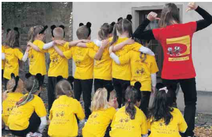
Tanzmäuse des RRC Siegburg e.V.

Großer Auftritt der Tanzmäuse auf dem Kinder-, Jugend-, Kultur- und Sportfest in Siegburg