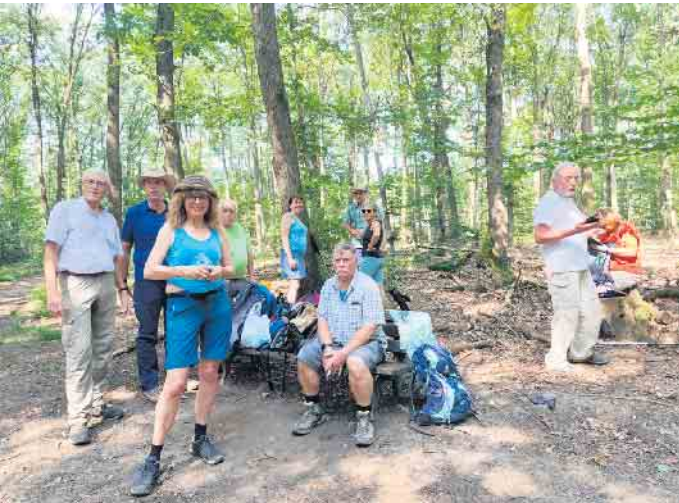
Die Wandergruppe 1 des PSV bei der ersten Rast, es wurde warm.