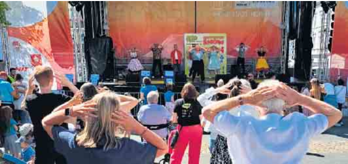
Unsere Boogies auf der Bühne

Der Rock'n'Roll-Club Siegburg ist wieder auf dem Kinder-, Jugend-, Sport- und Kulturfest Siegburg