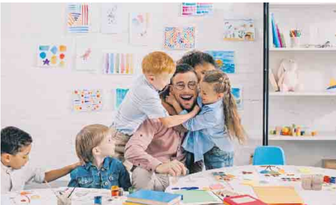
Ein Kita-Assistent kümmert sich um alle nicht-pädagogischen Belange in der Kita, hilft unter anderem bei Mahlzeiten, Körperhygiene und organisatorischen Dingen.

Weiterbildung als Schlüssel zu persönlicher Erfüllung und beruflicher Sicherheit