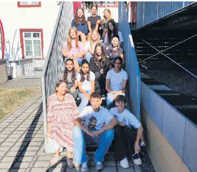
Die neuen Streitschlichterinnen und Streitschlichter des GSA

Ausbildung neuer Streitschlichterinnen und Streitschlichter bei bestem Sommerwetter an romantischem Ort