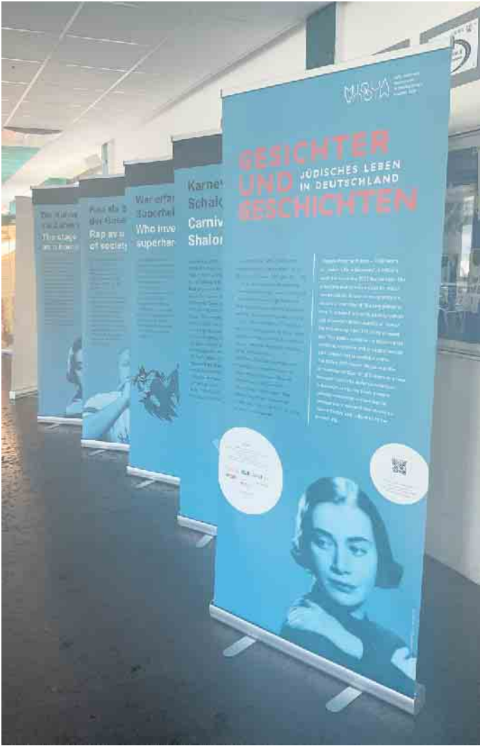
Posterausstellung am Anno.