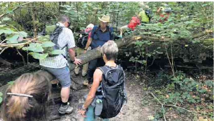
Im Tal des Katzenlochbachs wurde es naturbelassen und unwegsamer. Aber mit ein wenig Mühe war auch dies zu bewältigen.

Wandertourenbericht des Polizeisportvereins Siegburg e. V.