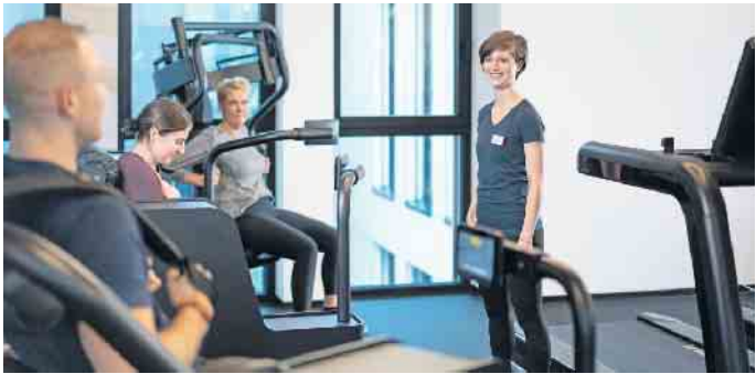
Fitness- und Gesundheitsanlagen etablieren sich zunehmend als elementare Bestandteile der Gesundheitsversorgung. Entsprechend gut muss die Ausbildung der Fachkräfte sein.

Ausbildung und Karriere in der stark wachsenden Fitness- und Gesundheitsbranche