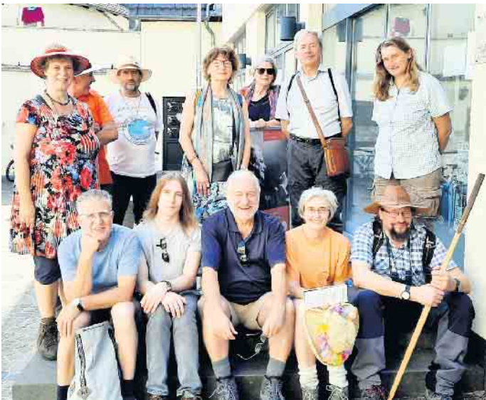
Die Wandergruppe vor dem Willy-Brandt-Forum in Unkel.