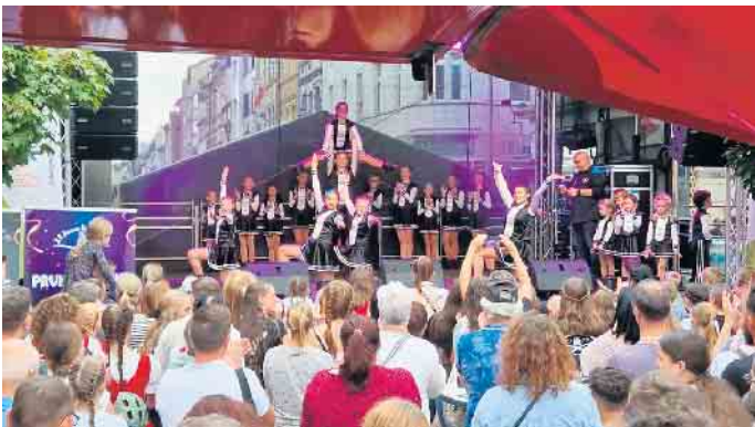
Jugend- u. Juniorengarde auf dem Siegburger Stadtfest 2023

Ausgelassene Stimmung bei den Husaren Schwarz-Weiß