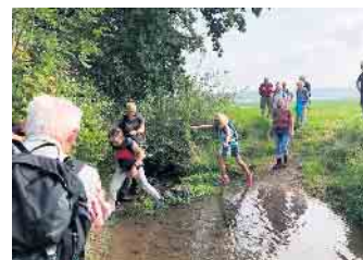
Die Überwindung des Steinbach bei Schweinheim erforderte ein wenig Geschick und Balancegefühl.

Das Wanderpensum betrug 15 km und sollte an fünf Burgen und einem Kloster vorbeiführen. Entlang des Orbachs wurde nach bereits einer halben Stunde die Burg Ringsheim, die immer noch bewohnt wird, erreicht. Weiter ging es zur einen Kilometer entfernten Burg Schweinheim, welche heute ein Gestüt beherbergt. Im Ort Schweinheim waren noch Zerstörungen des Hochwassers 2021, als hier Steinbach und Sürstbach über die Ufer getreten sind, deutlich sichtbar. Der Steinbach konn-