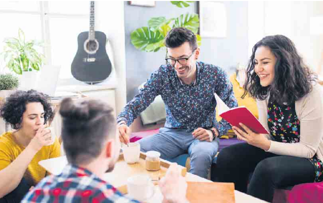
So geht's: Wohneigentum mit netten Leuten vorausschauend planen und kreativ gestalten

„Wenn die Käufer ihren Antrag auf eine Baufinanzierung stellen, legen sie eine notarielle Beurkundung der Teilung in Eigentumswohnungen vor“, erklärt Jörg Fidorra von der BHW Bausparkasse. „Zumindest einen Entwurf des Notars sollten sie einreichen können.