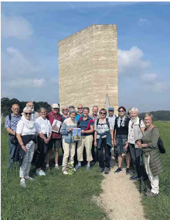
Pilger der Katholischen Landvolkbewegung

Menschen aus aller Welt kommen zur Bruder-Klaus-Kapelle