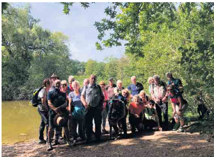
Die Wandergruppe des PSV am Burggraben der Hardtburg.

Ein Tourenbericht des Polizei-Sport-Vereins Siegburg