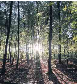
Sonnenuntergang im Wald.