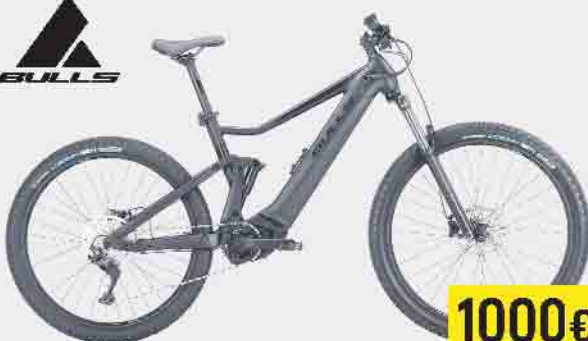
E-FULLY 29/27,5" COPPERHEAD EVO AM 1

Bosch Performance Line CX Antrieb, 625 Wh Akku, Shimano Deore 10-Gang Kettenschaltung, Shimano hydraulische Scheibenbremsen, vollgefedertes Fahrwerk mit 140 mm Federweg vorne und 150 mm hinten, Vee-Tire Crown Gem Bereifung