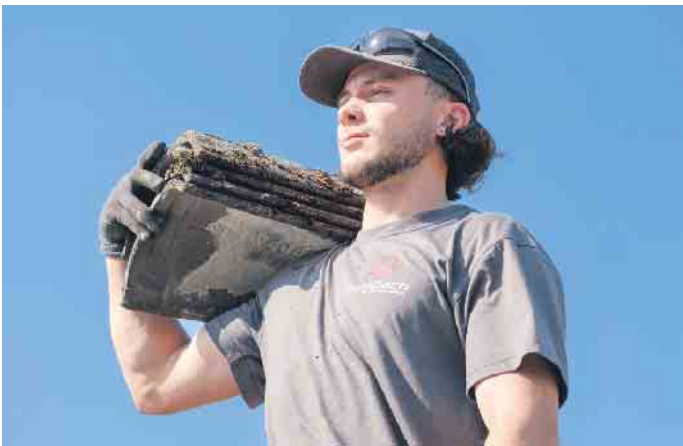
Dachdecker können anpacken, sind viel draußen, am Boden, in luftiger Höhe und abends sieht man, was man tagsüber geschafft hat.

oft hoch oben. Dafür gibt es tolle Aussichten, vielfältige Aufgaben und am Ende des Tages sehen Dachdecker und Dachdeckerinnen, was sie geschafft haben. Das macht stolz. Und wer heute eine Ausbildung im Handwerk startet, hat viele Möglichkeiten, morgen Karriere zu machen. Nach einer dreijährigen Ausbildung - die auch verkürzt werden kann - gibt es Weiterbildungen zum Vorarbeiter, Baustellenleiter, Energieberater bis hin zum Dachdeckermeister, um beispielsweise einen eigenen Betrieb zu führen. Aktuell sind besonders die Fortbildungen zum PV- oder Gründach-Manager im