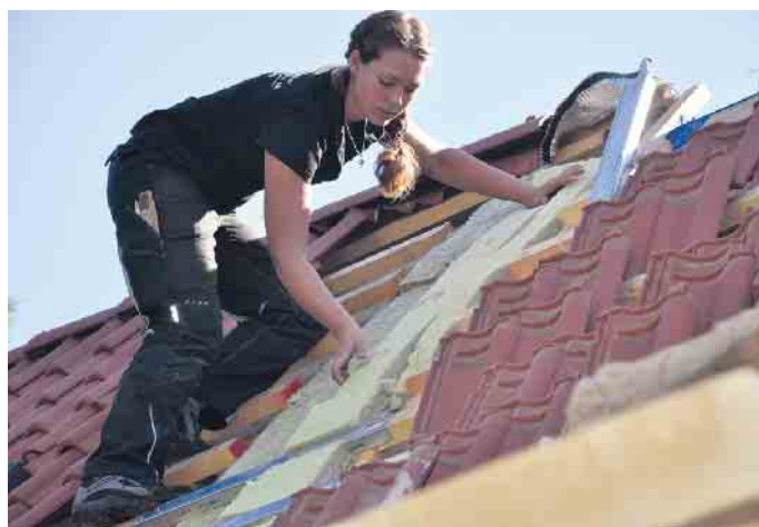
Dachdeckerinnen sind auf dem Vormarsch: schweres Tragen ist out, das übernehmen Lastenaufzüge.

Das Dachdeckerhandwerk ist modern und innovativ. Mit Drohnen werden Dächer inspiziert, Lastenaufzüge lassen schweres Tragen der Vergangenheit angehören und Apps speziell fürs Handwerk erleichtern die Büroarbeit. So verbindet das Dachdeckerhandwerk handwerkliches und gestalterisches Geschick mit aktivem Umweltschutz und neuen Technologien: Schieferhammer >>