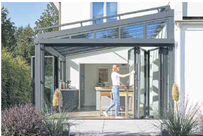
Bewegliche Verglasungen holen die Natur ins Haus.