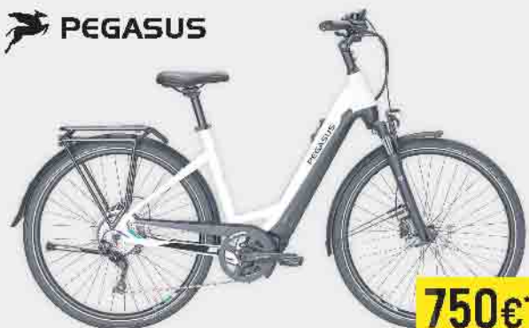
E-TREKKING-BIKE 28" PREMIO EVO 10 LITE

Bosch Performance Line CX Antrieb, 625 Wh Akku, Bosch Intuvia 100 Display, Shimano Deore 10-Gang Kettenschaltung, Shimano hydraulische Scheiben- bremsen, Schwalbe Marathon E-Plus Bereifung, Tuxo Front- und Rückleuchte