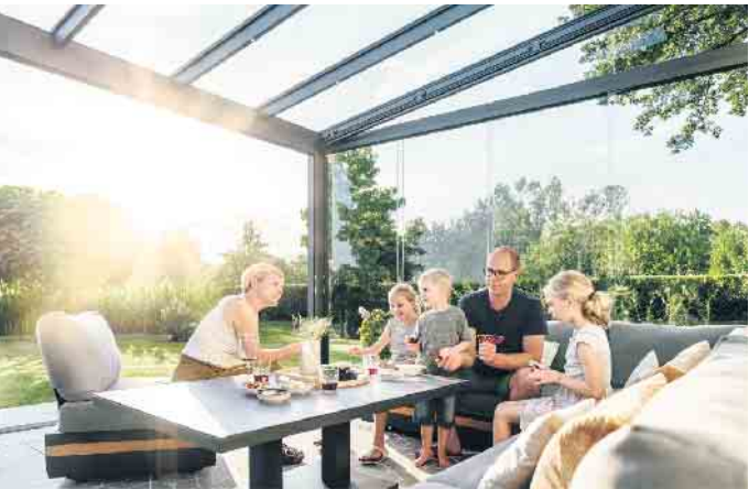
Gläserne Anbauten verbessern den Wohnkomfort und können langfristig den Wert der eigenen Immobilie steigern.

Energieeffizienz verbessern und Zuschüsse nutzen Als energieeffiziente Modernisierungsmaßnahme sind insbesondere auch wärmegedämmte Lösungen wie Wintergärten, Glasfaltwände und das Maximal-Schiebefenster cero von Solarlux geeignet. Weiterer Vorteil: Sie