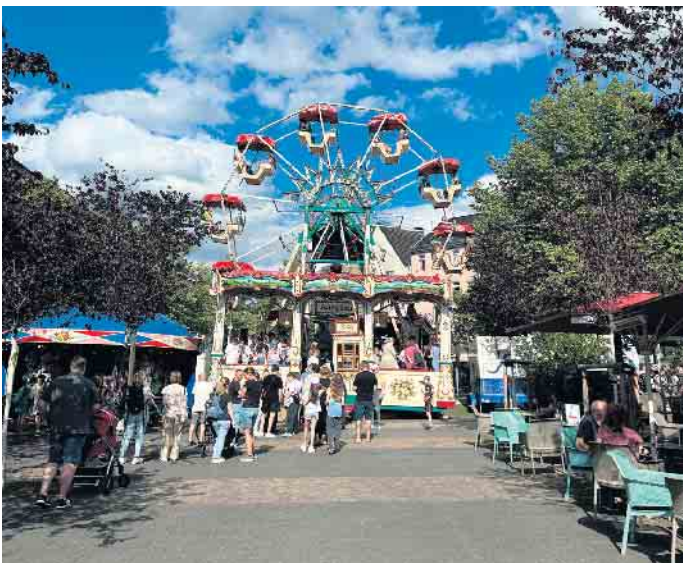
Blick von oben: Am Markt sorgte das Riesenrad für Spaß bei den Besucherinnen und Besuchern

Flammkuchen bis hin zu süßen Köstlichkeiten wie Waffeln und Eis - hier fand jeder etwas nach seinem Geschmack. Ein weiteres Highlight war die Weinmeile an der Kaiserstraße, die zahlreiche Genießer anlockte. Der obere Markt wurde durch ein imposantes Riesenrad dominiert, das bei Tag und Nacht einen tollen Blick über das Festgelände bot. Doch nicht nur Musik und Essen standen im Fokus. Hinter dem Bahnhof startete das Festgelände mit einer Zone speziell für Kinder. Kettenkarussell, Hüpfburg, Eisenbahn, Karussell, Dosenwerfen, Entenangeln und Bungeespringen boten den kleinen Gästen viel Spaß und Abwechslung. In der Holzgasse hingegen ging es etwas ruhiger zu. Hier präsentierten Kunsthandwerker ihre Werke, darunter Schmiede, Seifenmacher, Holzarbeiter und Steinmetze. Die Vielfalt an handgemachten Produkten faszinierte viele Besucher. Trotz der fröhlichen Stimmung wurde das Fest durch die tragischen Ereignisse vom Freitagabend überschattet, als in Solingen eine Messerattacke mehrere Menschenleben forderte. Diese schockierende Tat führte auch in Siegburg zu erhöhter