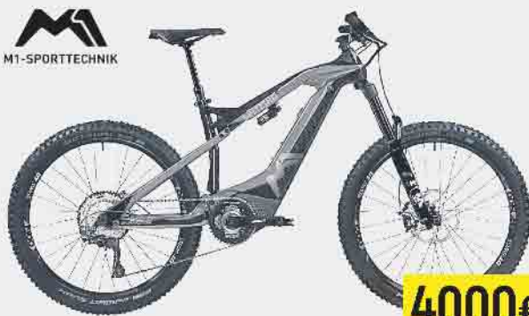
E-FULLY 29/27,5" M1 AM 1050 TQ.P

C-HPR 120S Antrieb mit 120 Nm, 1050 Wh Akku, Shimano XT ShadowPlus 11-Gang Kettenschaltung, vollgefedertes Fahrwerk mit 160 mm Federweg, Magura MT5 Scheibenbremsen, Schwalbe Hans Dampf Bereifung