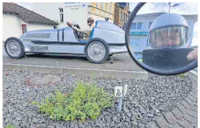
Erinnerungsfoto am Adenauer Kreisel mit dem Silberpfeil. Selfie im Spiegel.