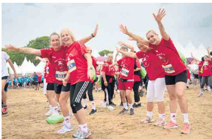
Voller Motivation beim Warm-Up

Beim Start um 18 Uhr regnete es. Doch das tat der guten Stimmung