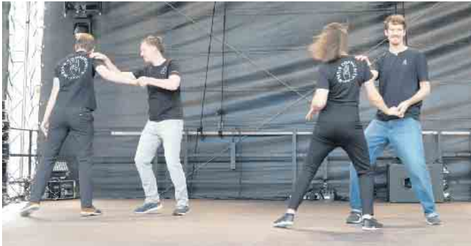
West Coast Swing Paare interpretieren zu moderner Musik

Egal ob man den klassischen Swing (Boogie Woogie) oder die moderne Variante (West Coast Swing) bevorzugt, hier findet jeder seinen Rhythmus. Und wer es lieber sportlich mag, ist beim akrobatischen Rock'n'Roll bestens aufgehoben. Weitere Informationen zu den Tanzangeboten, sind auf der Homepage des Vereins unter www.tanzen-siegburg.de zu finde. Also schnappt euch eure Tanzschuhe und lasst uns gemeinsam das Tanzbein schwingen!