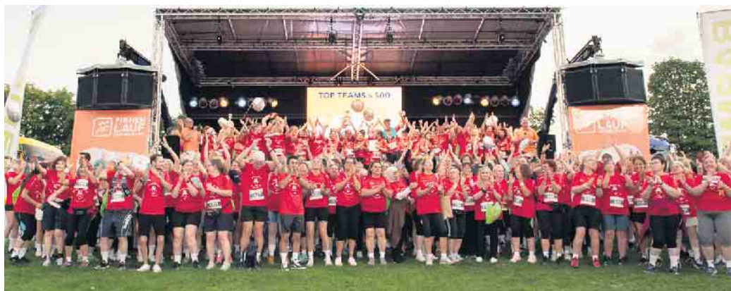
Bei der Siegerehrung passte nicht die ganze Gruppe von Betreute Schulen e. V. auf die Bühne. Auf den roten Trikots ist der „Struwwel“ zu sehen, das Maskottchen des Vereins.