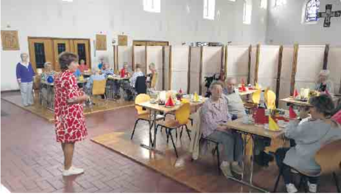
Begrüßung der ersten Gäste