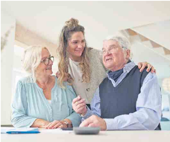
Eine Eigentumswohnung für die Kinder kaufen: Dieses Finanzierungsmodell ist bei Immobilienbesitzern und Banken gleichermaßen beliebt.