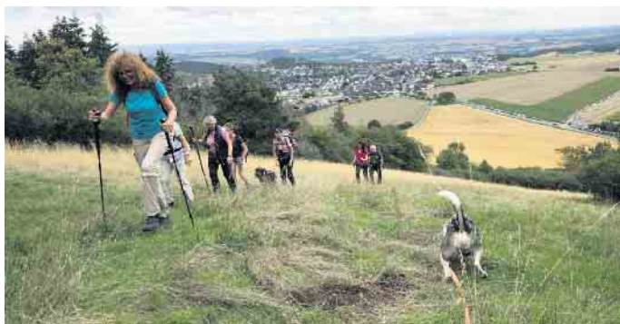
Aufstieg auf den Vulkankegel Hochstein mit seinen 563 m über Normalnull.