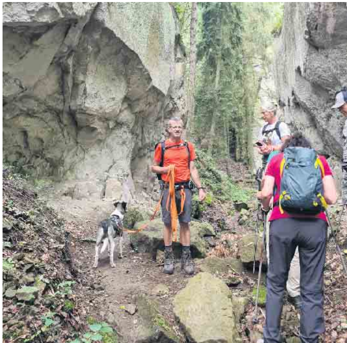
Kurzer Halt im Steinbruch Marxe-Lay.