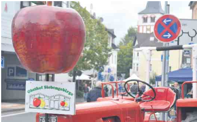
Der Obstanbau in der Region hat dem Apfelsonntag einen Namen gegeben, Obst wird auch in dieses Jahr wieder angeboten