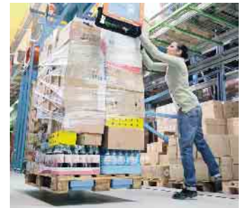
Erkrankungen des Muskel-Skelett-Systems machen den größten Anteil an den Arbeitsunfähigkeits-Tagen aus.

„von oben“ bestimmt werden. Eine Maßnahme wird in aller Regel von den Beschäftigten besser akzeptiert, wenn diese an der Verbesserung beteiligt werden und mitgestalten können. In vielen Fällen liegt eine Problemlösung auch bereits als Idee in den Köpfen der Beschäftigten vor. (akz-o)