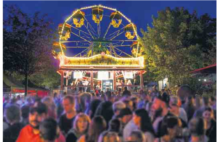
Nostalgisches Riesenrad auf dem Marktplatz

„Ich freue mich riesig, dass das Stadtfest endlich wieder stattfindet. Ich habe es schmerzlich vermisst, weil ich es sehr liebe“, so eine Siegburgerin. „Ich finde es gut, dass man trotz Corona diesen Schritt gewagt hat, denn ein erneuter Verzicht wäre nur schwer zu vermitteln gewesen“,