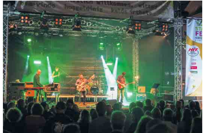
BAROQUE IN BLUE spielten Hits aus der legendären Deep Purple Ära

Siegburg war am Wochenende in Feierlaune. Vom 26. bis 28. August stieg das 40. Sieburger Stadtfest. Ein abwechslungsreiches Programm aus Rock, Jazz, rheinischer Mundart und Tanz garantierte Spaß und Unterhaltung für alle Altersgruppen. Siegburg war auch in diesem Jahr ein Publikumsmagnet für die Menschen aus Nah und Fern.