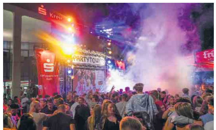
Open-Air-Disco lud zum Tanz und Feiern ein

Es bleibt zu hoffen, dass alle ihre „sozialen Akkus“ aufladen konnten, um sich so gestärkt auf den Weg in die etwas schwierigeren Monate machen, die wahrscheinlich vor uns liegen. hje