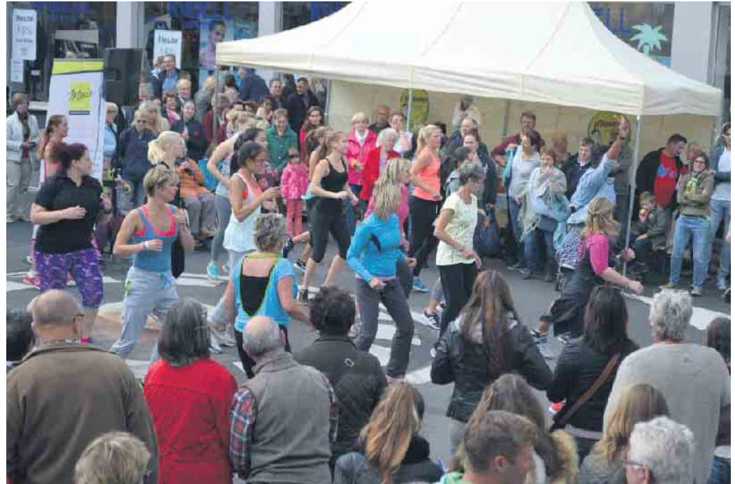
Der Apfelsonntag - eine Traditionsveranstaltung und stets ein kunterbuntes Spektakel - wie hier im Jahr 2015

zum Bummeln, Schlemmen und Schoppen und dies mit der gesamten Familie.“ Neben vielen Ausstellern steht auch ein Angebot aus der Apfelwoche des vergangenen Jahres auf dem Programm. So wird die Arche Lütz an der Siegburger Straße wieder eine Führung anbieten. Die Führung startet um 16 Uhr und max. 25 Teilnehmer*innen können daran teilnehmen. Eine Anmeldung ist über info@bergregion-koenigswinter.de möglich. Zwei neue Mitglieder des Werbekreises präsentieren sich an der Siegburger Straße. Das Sanitätshaus Rahm und Binten&Buiten haben ihre Pforten geöffnet. Ein Apfellehrpfad, der am „Alten Zoll“ beginnt und auf Höhe Möbel Thomas endet, informiert an unterschiedlichen Apfelsorten deren Anbaubedingungen. An zahlreichen Plätzen findet sich zudem ein reichhaltiges Angebot an Speisen und Getränken. Die Pfadfinder haben wieder ein Programm für die Kids zusammengestellt. Auf die jungen Besucher warten darüber hinaus ein Kinderkarusell sowie zwei Hüpfburgen. Zum Bullenreiten besteht die Möglichkeit am Kreisel. Auch die Traktorfreunde sind stets Stammgast auf den Veranstaltungen des Werbekreises und werden die Kids auf die ein oder Fahrt durch den Ortskern mitnehmen. Die Liste der Angebote auch an diesem 23. Apfelsonntag ist lang, ein Besuch wird sich auf jeden Fall lohnen und dies gilt für Jung und Alt.