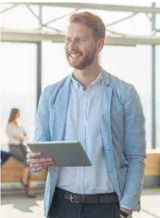
Die fortschreitende Digitalisierung verändert die Anforderungen an die Beschäftigten im Bankwesen rasant.