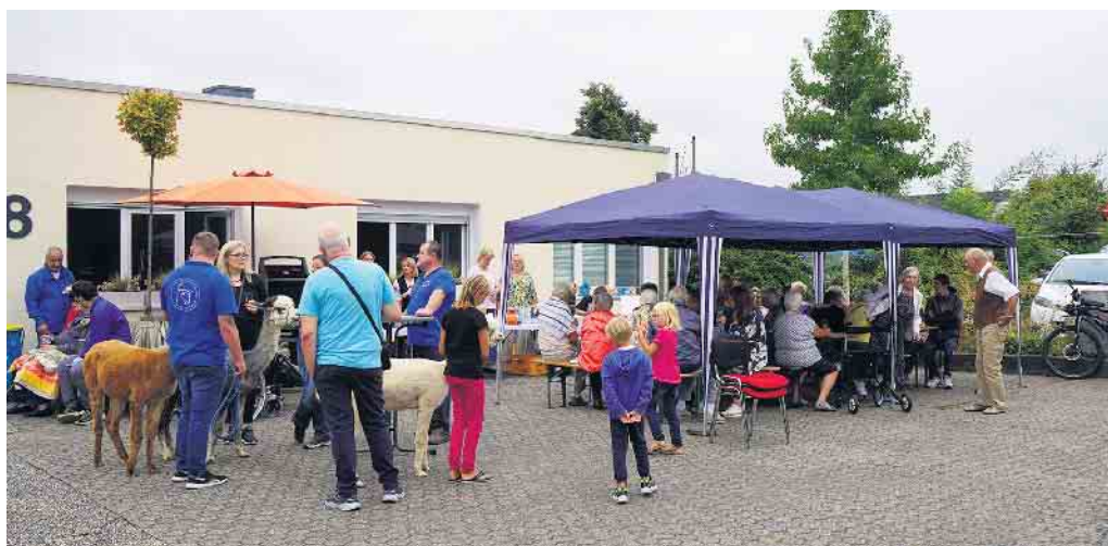
Sommerfest bei der Tagespflegestätte „rheinperle“