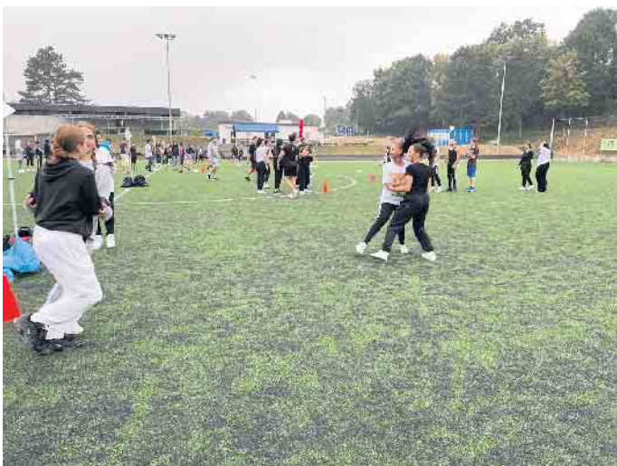
Schülerinnen und Schüler in Aktion beim Sportfest

Stellberg gekrönt wurde. Ausgezeichnet wurden die erfolgreichsten Klassen, die durch ihre Teamleistung überzeugen konnten, mit einer süßen Überraschung. Fortsetzung folgt im nächsten Jahr. Weitere Informationen zum Berufskolleg finden Sie unter www.berufskolleg-siegburg.de oder auf unserem Instagram Account @berufskollegsiegburg.