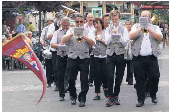
Einmarsch der Siegburger Musikanten

ergänzte ihr Begleiter. Fünf farblich gekennzeichnete Meilen boten Musik und Unterhaltung aus jedem Genre. Auf der Goldenen Meile am Marktplatz sorgten Rock- und Popband für Stimmung. Daran angegliedert war die die Blaue Meile. Hier präsentierten sich circa 50 Vereine aus der Region. Etwas ruhiger ging es in der Pinken Meile in