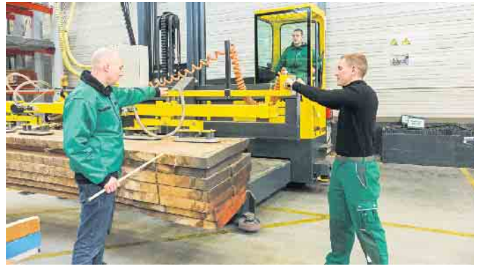
Ob im kaufmännischen Bereich, in der Verarbeitung oder der Logistik: Der Holzfachhandel bietet attraktive Ausbildungs- und Berufsperspektiven.

Wer gerne selbst den Werkstoff in die Hand nimmt, findet etwa mit einer Ausbildung als Holzbearbeitungsmechaniker oder -mechanikerin das passende Angebot. Doch nicht nur kaufmännische und technische Berufe bildet der Holzfachhandel vor Ort aus. Für effiziente Prozesse und eine zuverlässige, termingerechte Lieferung der Produkte an die Kunden sind Fachkräfte für Lagerlogistik verantwortlich. Sie begleiten das Holz quasi über den gesamten Weg von der Eingangskontrolle über die Einlagerung bis zur Bereitstellung. Berufskraftfahrer sind dann für den Transport direkt auf die Baustelle verantwortlich. Auch diesen Ausbildungsberuf bieten zahlreiche örtliche Fachhandelsunternehmen an. Unter www.holzvomfach.de/ausbildung etwa gibt es weitere Informationen, Einblicke in die Erfahrungen anderer Auszubildender und Ansprechpartner in den Unternehmen. Mit einer PLZ-Suche können Schulabgänger offene Stellen in der eigenen Region finden. (djd)