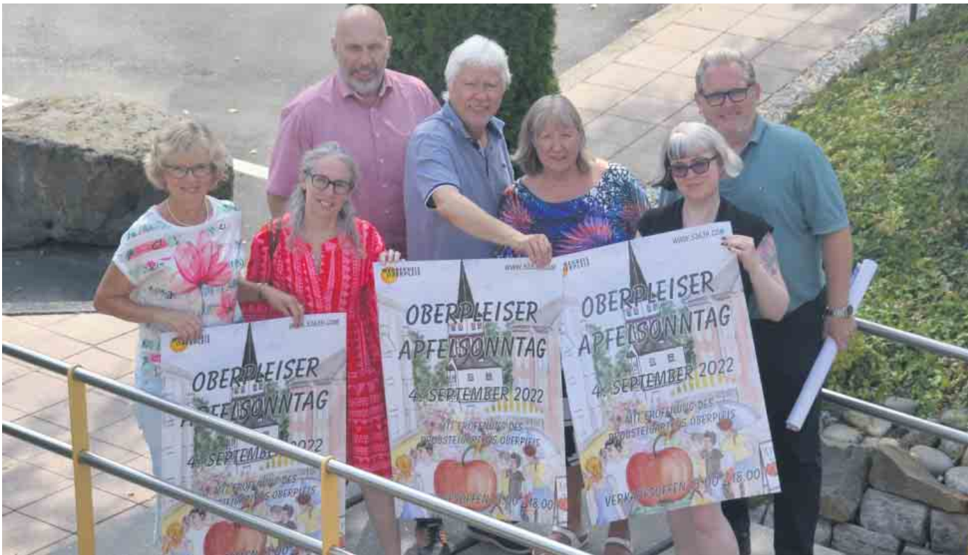
Der Vorstand des Werbekreises lädt herzlich zum 23. Apfelsonntag in den Ortskern von Oberpleis ein

Der Werbekreis Oberpleis freut sich, auch am 23. Apfelsonntag wieder zahlreiche Besucher, begrüßen zu können