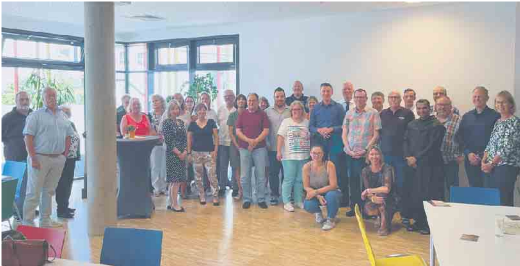
Teilnehmer der Wolsdorfer Runde