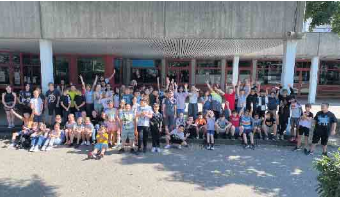
Freudestrahlende Fünftklässler*innen an der GE Am Michaelsberg

dass sie gut angekommen sind. In den kommenden Wochen werden sie neben dem Unterricht auch in Workshops den sicheren Umgang mit den iPads erlernen und auf Klassenfahrt gehen, um die Klassen- und Jahrgangszusammengehörigkeit noch mehr zu stärken. Wir wünschen unseren Schüler*innen viel Erfolg für ihre Schullaufbahn und weiterhin ganz viel Freude am Schulbesuch.