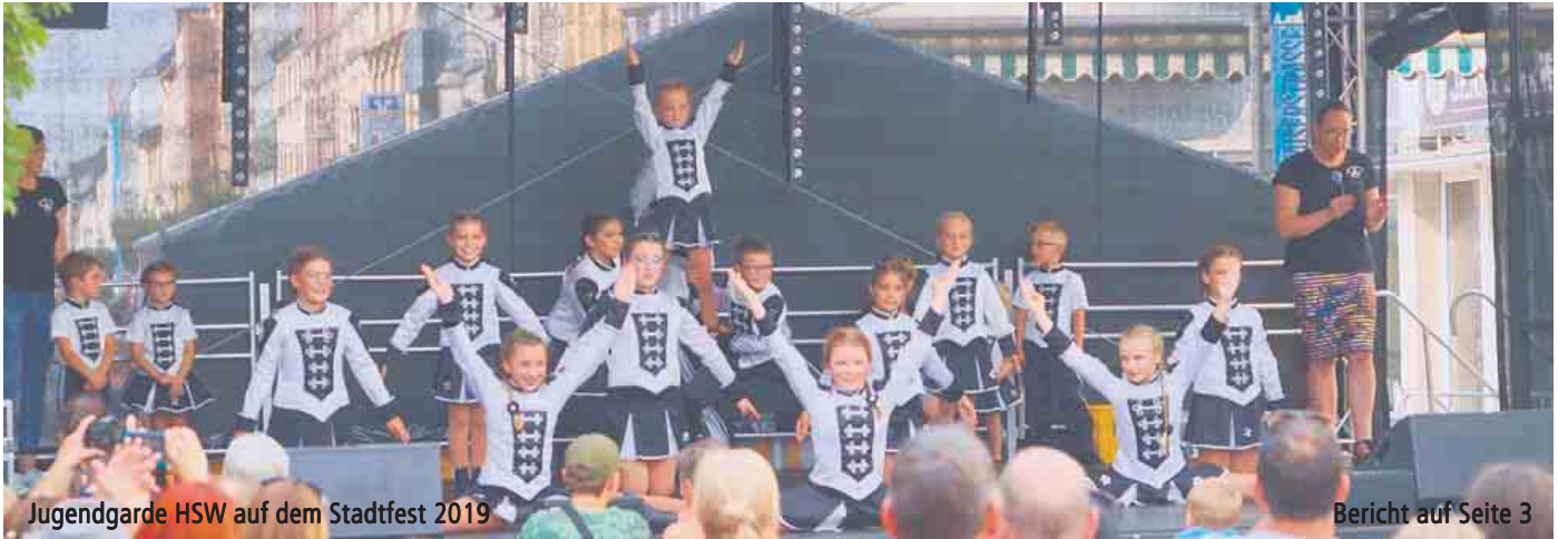
Jugendgarde HSW auf dem Stadtfest 2019