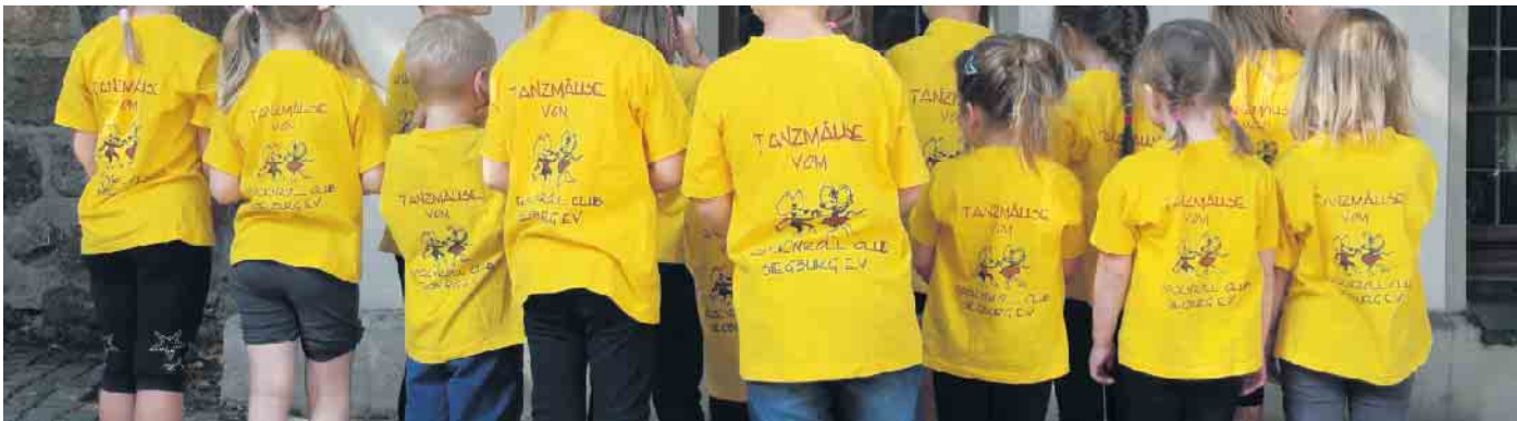
Unsere Tanzmäuse in ihrem T-Shirt.

Vorkenntnisse sind nicht erforderlich - nur bequeme Kleidung, Turnschuhe und gute Laune werden gebraucht! Schnuppertraining: Dienstag, 23. September & Freitag, 26. September Ort: Vereinshalle des RRC Siegburg