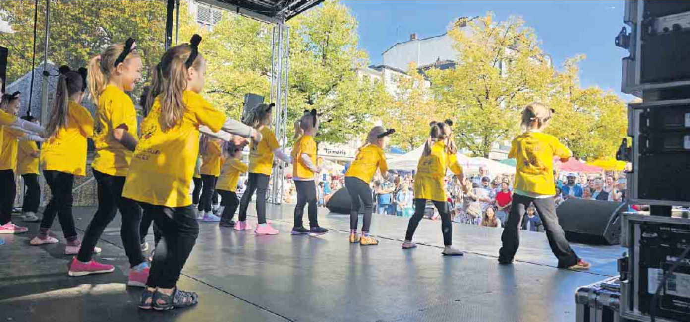
Unsere Tanzmäuse in Aktion auf der Bühne 2024

Es darf wieder Tanzluft geschnuppert werden! Beim Rock'n'Roll Club Siegburg gibt es Ende September wieder die Chance, altersgerecht Tanzluft bei den „Tanzmäusen“ zu schnuppern. Speziell für Kinder im Kindergartenalter (3 bis 6 Jahre), die Spaß an Bewegung,