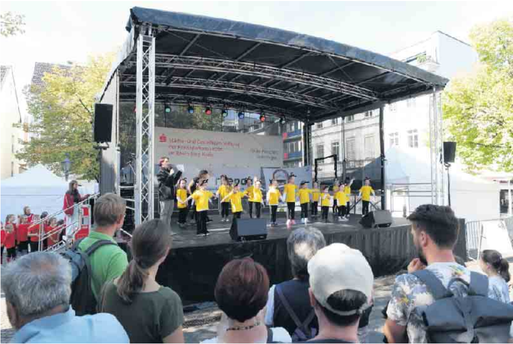
Die Tanzmäuse auf der Bühne in Siegburg 2024