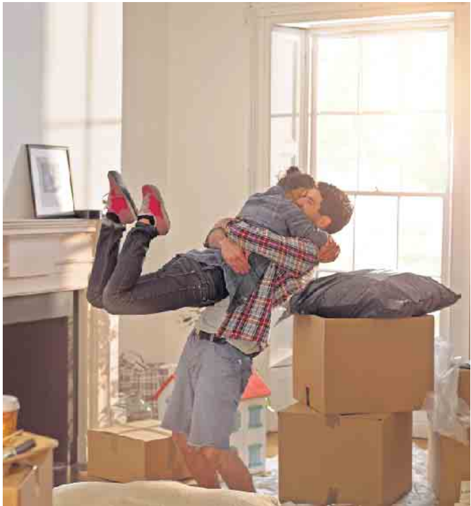
Vorfreude pur: Nach dem Umzug beginnt ein neuer Lebensabschnitt. Damit man sich so glücklich in die Arme fallen kann, ist allerdings vorher viel Planung und Organisation nötig.

Innerhalb von 14 Tagen nach dem Umzug muss man sich beim zuständigen Einwohnermeldeamt an- beziehungsweise ummelden, ansonsten droht ein Ordnungsgeld. Die neue Adresse sollte zeitnah auch den jeweiligen Versicherungsunternehmen mitgeteilt werden. (DJD)