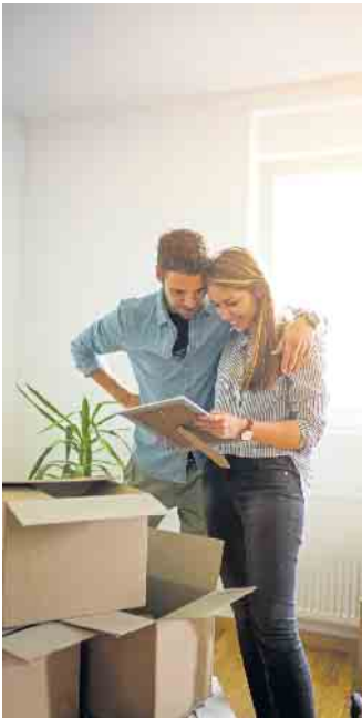
Das Pärchen zählt zu den etwa 8,5 Millionen Menschen in Deutschland, die pro Jahr umziehen. Soll der Umzug reibungslos vonstattengehen, will er gut geplant und organisiert sein.