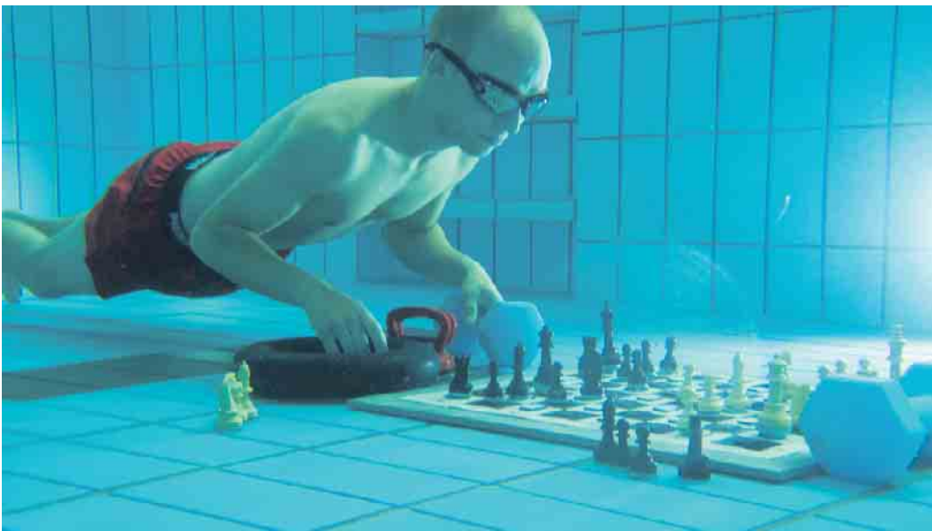
Erste Trainingseinheit gemeinsam mit dem Sub-Aqua-Club: Wie lange reicht die Luft, welches Gewicht eignet sich am besten.

Die Partien versprechen rasant zu werden, da die Spieler zum Luftholen jeweils nur so lange an der Wasseroberfläche bleiben können, wie der Gegner unter Wasser ist. Taucht der Gegner auf, muss der Spieler unmittelbar ab-