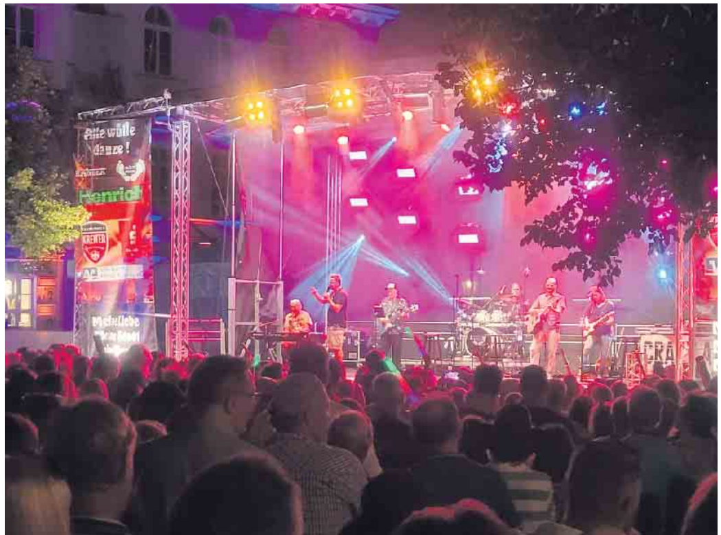
... und die „Bläck Fööss“ jeweils ein anderthalbstündiges Konzert auf dem Siegburger Marktplatz.