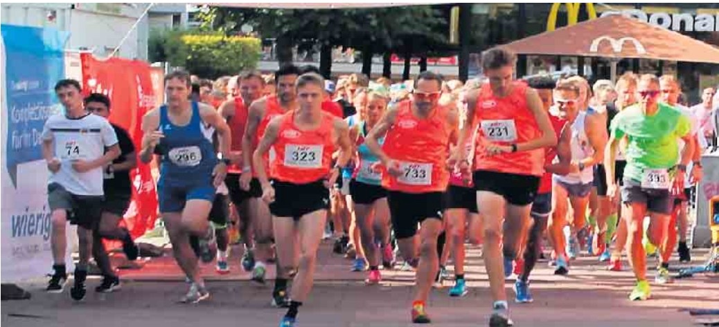
Immer ein Highlight: Der Hit-Citylauf in Siegburg.

Am 8. September verwandelt sich der historische Stadtkern rund um den Markt von Siegburg wieder in ein Mekka für Laufbegeisterte. Der Hit-Citylauf Siegburg steht vor der Tür und verspricht ein spannendes Event für Läuferinnen und Läufer jeden Levels. In diesem Jahr wird es noch spektakulärer, denn die Landesmeisterschaften über 5 km werden ebenfalls im Rahmen des Citylaufs ausgetragen. Die Strecke führt durch die his-