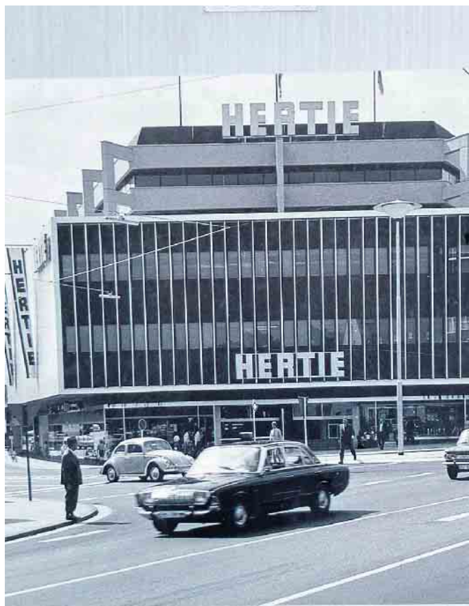
14 Jahre lang prägte der Hertie die Region, vor 40 Jahren schloss das große Kaufhaus dann seine Türen.

Die Schließung des Kaufhauses 1984 bedeutete das Ende einer Ära. Die Gründe dafür waren vielfältig: wirtschaftliche Veränderungen, die Konkurrenz durch neue Einkaufszentren und eine Verlagerung der Konsumgewohnheiten trugen dazu bei. Dennoch bleibt