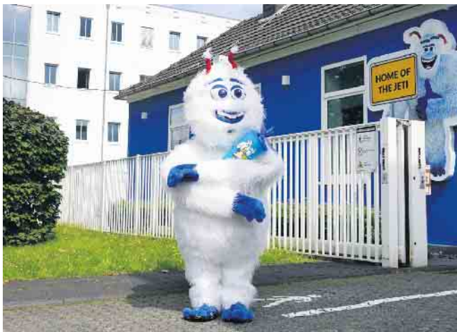
Auch der JETI freut sich auf seine Einschulung.