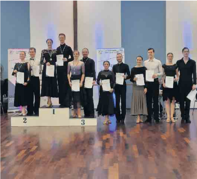
Hgr. D Standard.

Attraktive Veranstaltung für Teilnehmer und Zuschauer