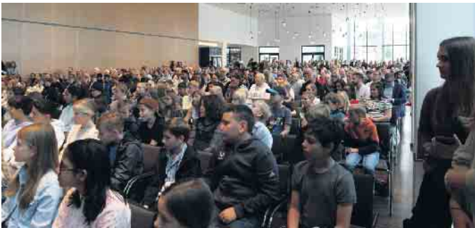
Volles Haus im Rhein-Sieg-Forum. Fotos: Jana Jones"

ler und machte ihnen mit berühmten Filmzitatzen Mut für den neuen Lebensabschnitt. Ein Sketch der 6b und eine akrobatische Performance der Tanz-AG von Jana Jones brachten die Neuankömmlinge in gute Stimmung. Abgerundet wurde das Programm durch „Mutmacher“ der 6b, die mit ihren einfühlsam vorgetragenen, authenti-