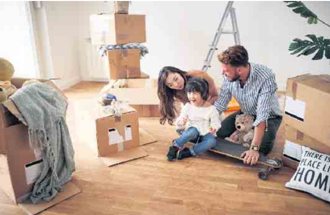
Den Traum vom eigenen Zuhause können Familien auch in der aktuellen Zinssituation noch verwirklichen.

Die Zinswende hat den Immobilienmarkt ordentlich auf den Kopf gestellt. Viele Kauf- und Bauinteressenten haben ihre Eigenheimwünsche aus diesem Grund vorerst ad acta gelegt. Doch mit einer guten Planung und einigen Tipps können Immobilieninteressenten trotz hoher Kosten auch heute noch ihren Traum vom eigenen Zuhause verwirklichen. Finanzierung mit wenig Eigenkapital Lange Zeit galt die Richtlinie, dass 20 Prozent des Immobilienpreises aus eigener Tasche bezahlt und nur die restlichen 80 Prozent finanziert werden können. Diese Empfehlung ist durch die stark gestiegenen Zinsen und Immobilienpreise unrealistisch geworden. „Wenn jemand während des Studiums