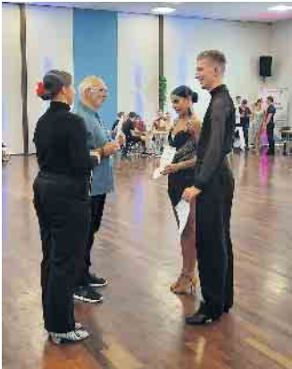
Hgr. A Latein