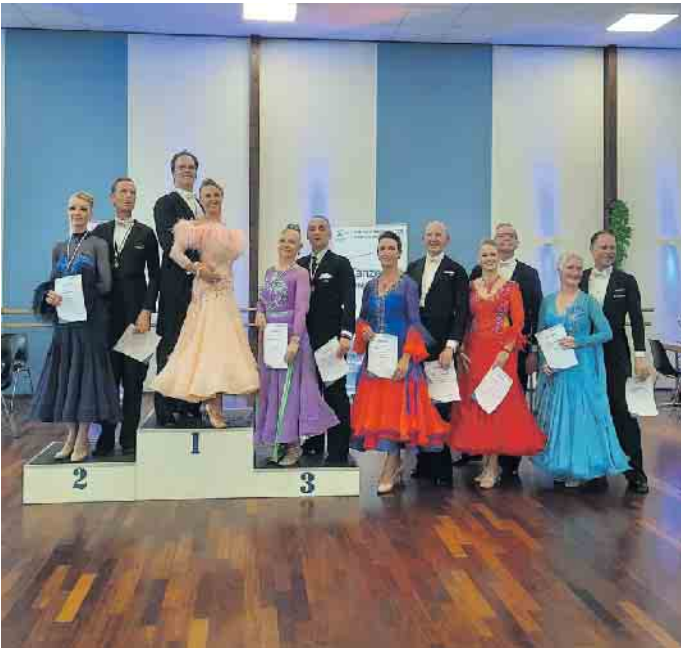
Masters III A Standard

wurden wiederum Medaillen vergeben. Bei der Siegerehrung gab es strahlende Gesichter, die Bänder sprachen über ihre Freude und ihren Stolz auf das Erreichte. Das Sommerturnier-Wochenende war ein voller Erfolg - für die Veranstalter genauso wie für die Teilnehmer. Hier gehört sich auch ein großes Dankeschön an alle Helfer:innen für ihren unermüdlichen Einsatz. Der TSK hofft, dass beim nächsten Mal wieder alle dabei sind! www.tsk-sankt-augustin.de Pressteteam TSK-Sankt Augustin