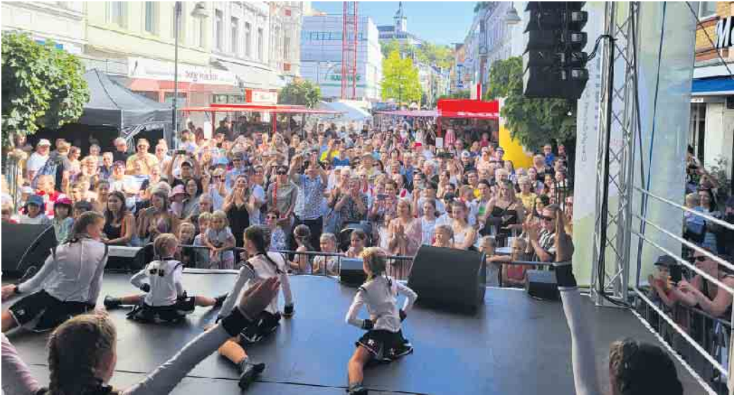
Großer Andrang auf der Husarenmeile

Husaren Schwarz-Weiß freuen sich auf das Siegburger Stadtfest