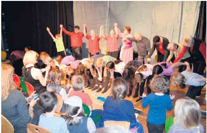
Von der Theateraufführung „Immer schön ordentlich“

ein Weltenretter zu sein, wird auch dieses Projekt von der Aktion Mensch gefördert. „Neben der Spur“ lautet der Titel des neuen Projektes, das sich inhaltlich den Fragen widmet, wie die verschiedenen Generationen der Stadtteilgemeinschaft einander wahrnehmen, was ihre eigenen Bedürfnisse sind und welche Erwartungen sie aneinander haben. Was brauche ich als Kind, um mein Leben leben zu können? Was wünsche ich mir als älterer Mensch, wenn ich irgendwann das Gefühl bekomme, mir entgleitet mein Leben? Was ist meine Spur?