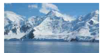
Gletscherszene der Antarktis

e. V., Paul-Schneider-Saal der Evangelischen Auferstehungskirche, Annostraße 14 in Siegburg am 21. August, Beginn: 19.30 Uhr.