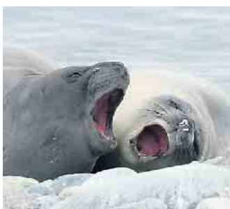
Seehunde in Südgeorgien

„Südgeorgien und Antarktis“ - 21. August / 19.30 Uhr - Eintritt frei