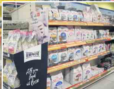
Abb. sind Beispiele! Produkte in Ausstellungen und Lager können abweichen!

KLEIN BAUSTOFFE Baumarkt Brennstoffe FUTTERMARKT