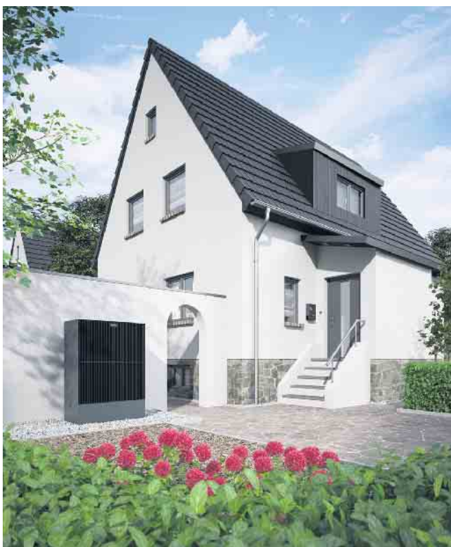
Viessmann Wärmepumpe Vitocal 25 x -A.

Seit einigen Monaten beherrschen die Themen steigende Energiepreise sowie die Notwendigkeit zur Umstellung der Heizung auf regenerative Technologien die Medien. Die Verunsicherung ist in Fachkreisen und insbesondere bei Endkunden groß. Vor diesem Hintergrund hat sich die Viessmann Niederlassung Köln-Bonn dazu entschieden, vom Mittwoch, 17.08.2022, bis zum Freitag, 19.08.2022 , erstmalig Endkundentage durchzuführen. In der Zeit von 10:00 bis 18:00 Uhr haben interessierte Endkunden - gerne in Begleitung von unseren Fachpartnern - die Möglichkeit,