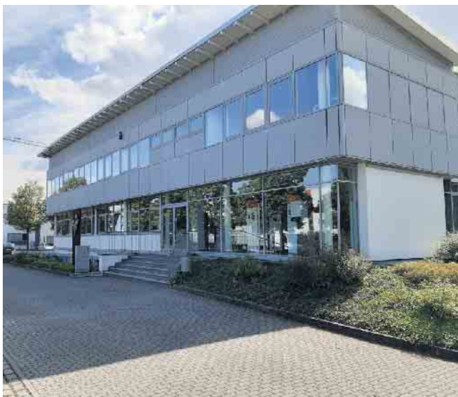
Viessmann Verkaufsniederlassung Troisdorf in der Josef-Kitz-Straße 16.