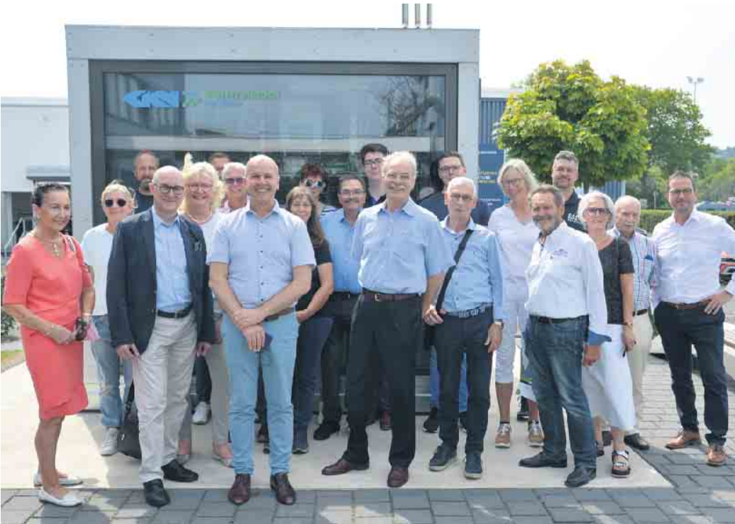
Mittelständler besuchen die GKN.