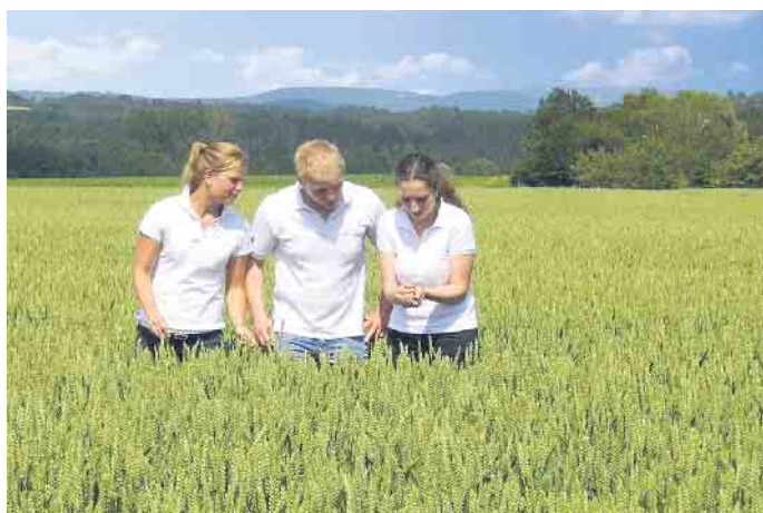
Genauere Kenntnisse über das Naturprodukt Getreide gehören zu den Grundlagen des Müllerberufs.

info@metallbau-pieper-koeln.de • www.metallbau-pieper-koeln.de