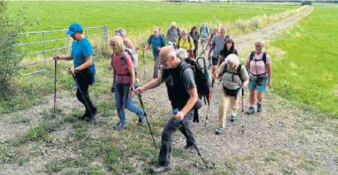
Die Wandergruppe I des PSV Siegburg e. V. beim moderaten Anstieg zum Heckberg im nördlichen Gemeindegebiet von Much.

Tourenbericht des Polizei-Sport-Verein Siegburg 1976 e. V.