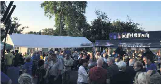
Blick über den Festplatz

Getränken an der Wein- und Cocktaillbar. Die Gäste dürfen sich auf einen abwechslungsreichen Mix freuen, mit dem DJ Basti Weeber den Festplatz in eine stimmungsvolle Partyzone verwandeln wird. Am Sonntag, 3. August, lädt der traditionelle Frühschoppen ab 11 Uhr herzlich zum gemütlichen Beisammensein ein. Für die kleinen Besucher wird auch in diesem Jahr wieder ein buntes Kinderschminken angeboten.