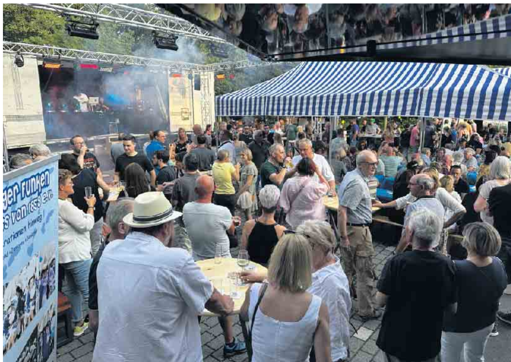
Bekanntes und beliebtes Open-air-Event am Fuße des Michaelsberges: Die Sommerparty der Funken Blau-Weiß.

Schon am Freitagabend und am Samstag war „Party pur“ angesagt: TOP-DJ „Sunfox“ legte an beiden Tagen auf und heizte den begeisterten Gästen der Blau-Weißen mit Liedern zum Mitsingen sowie mit