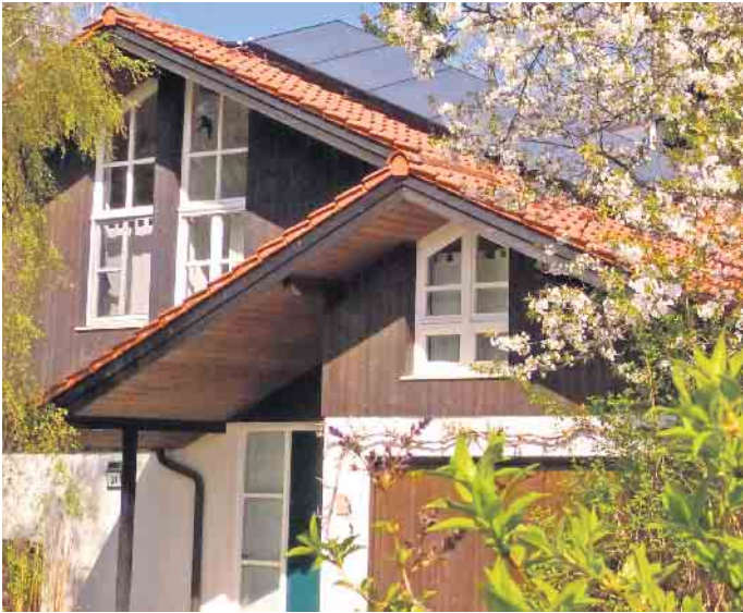
Viele Menschen in Deutschland wohnen in älteren Ein- und Zweifamilienhäusern, in denen früher oder später Sanierungen anstehen.

Die Studie betont, dass sich die Bauqualität im internationalen Vergleich nicht verstecken muss. Sie empfiehlt dennoch, Maßnahmen zur Schadensvermeidung zu beachten. Eine umfassende Bestandsanalyse bildet eine gute Grundlage, um Wartungs-, Instandhaltungs-, oder Modernisierungsarbeiten sinnvoll zu priorisieren und zu budgetieren. Unterstützung dabei bieten unabhängige Sachverständige, zum Beispiel die Bauherrenberater des BSB. Sie unterstützen Hauseigentümer auch dabei, wirtschaftliche und nachhaltige Lösungen zu definieren und vertragliche Vereinbarungen mit Bauunternehmen fachlich und juristisch zu prüfen. In der eigentlichen Umsetzungsphase können sie zudem eine Bauqualitätssicherung übernehmen, mit der sich Mängel frühzeitig entdecken und Folgeschäden vermeiden lassen. (DJD)