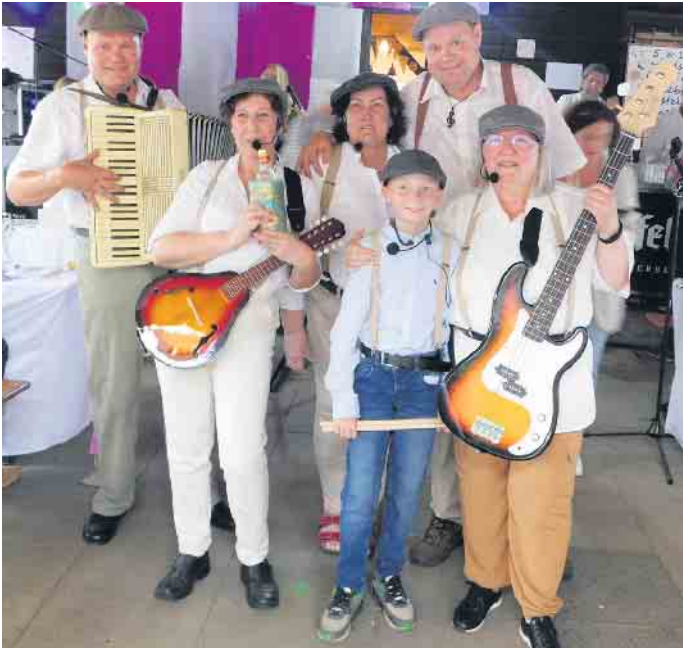
Für Spaß sorgte beim Sommerfest die „Tönnisberger Showgruppe“.

Knallerprogramm mit kölschem Wortwitz, schwungvollen Musik-Acts und Tanzmusik