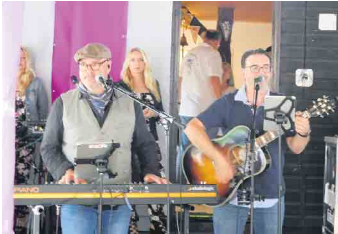
Mit Kölschen Klassikern brillierte das Kölner Duo „Kraad un Plaat“.