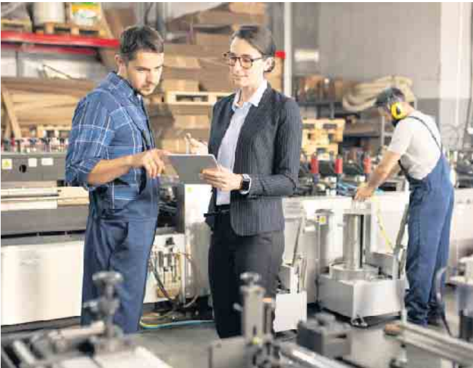
Immer mehr Firmen spüren die Auswirkungen des Fachkräftemangels. Eine Studie weist auf eine immer beliebtere Möglichkeit hin, um Fachleute zu binden: Indem der Arbeitgeber seinen Beschäftigten eine von ihm finanzierte betriebliche Krankenversicherung (bKV) anbietet.

Mitarbeitende empfinden betriebliche Krankenversicherung als Wertschätzung