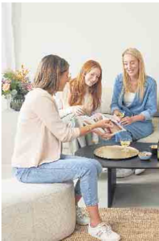
Die Aufgabe einer Schmuckstylistin ist es, eine aktuelle Kollektion vorzuführen und ihre Kundinnen gut zu beraten.

Bei dieser Tätigkeit hat man die Aufgabe, Schmuckstücke der aktuellen Kollektion eines Herstellers im Rahmen von privaten Partys an Freunde, Bekannte oder Verwandte zu verkaufen. Man organisiert Homepartys bei sich oder den Kundinnen zuhause oder