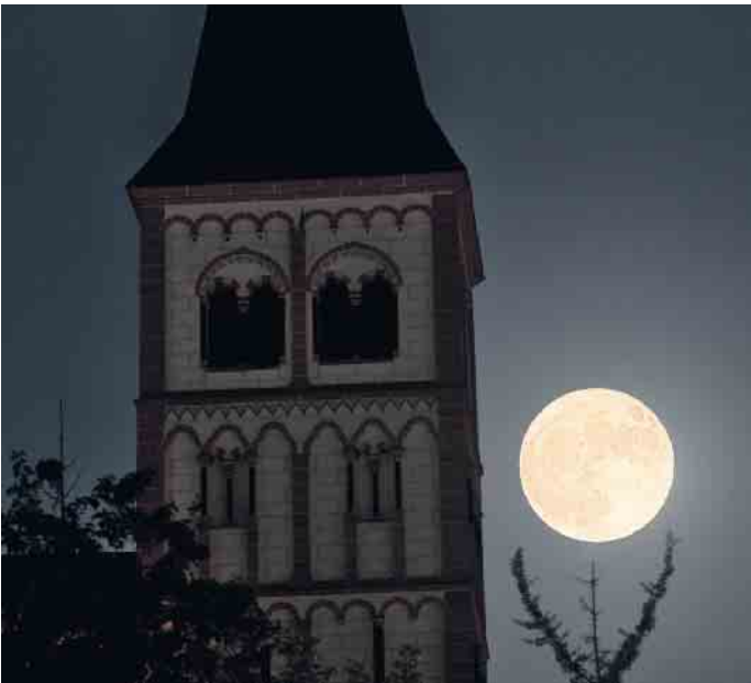
Supermond neben der Sankt Servatius Kirche

Als am 13. Juli gegen 22 Uhr der Mond aufging, befand er sich deutlich näher an der Erde als sonst. Konkret lagen zwischen der Erde und dem Mond dann nur 357.418 Kilometer. Es war der größte Vollmond des Jahres 2022. So nahe wird er erst wieder im Jahr 2034 der Erde sein. Dieses Naturphänomen wollte ich unbedingt fotografieren. Mit einer Mondverlauf-App, die man kostenlos herunterladen kann, machte ich mich an die Planung. Ich suchte mir Standorte aus, an denen man gleichzeitig markante Bauwerke, wie zum Beispiel die Sankt Servatius Kirche und den Mond sehen konnte. Mit einer Vollformatkamera, Teleobjektiv und Stativ machte ich mich in der Nacht des 13. Julis auf den Weg. Aber ich hatte kein Glück. Wolken bedeckten in dieser Nacht dem Himmel und verwehrten mir den Blick zum Supermond. Ein Blick auf die Wettervorhersage der nächsten Nacht ließ mich hoffen. Die Nacht des 14. Julis sollte sternenklar sein. Und so war es dann auch. Morgens gegen 2 Uhr zeigte sich der Vollmond direkt neben der Sankt Servatius Kirche. hje