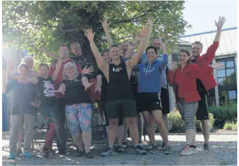
Teilnehmer am Trainingswochenende

Alle freuen sich schon jetzt wieder auf das reguläre, wöchentliche Training, das nach den Ferien weitergeht. Anfänger, die gerne einmal in das Tanztraining für Akrobatik-Rock'n'Roll oder Boogie-Woogie reinschnuppern möchten, sind dann wieder gerne für Probetrainings eingeladen. Das R'n'R-Training findet mittwochs (18.30 bis 19.30 Uhr) und das BW-Training donnerstags (19 bis 19.45 Uhr) statt. Zur Klärung des genauen Tags für das erste Probetraining ist eine Anmeldung vorab unbedingt erforderlich. Interessierte können sich gerne per E-