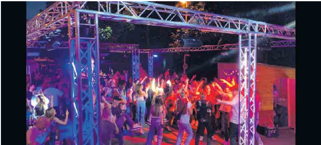
Zug und Stimmung ohne Bremse: Auch auf dem neu gestalteten "Party-Dance-Floor" der Blau-Weissen ging zur Musik von DJ „Sunfox“ richtig die Post ab.

In diesem Jahr war es endlich wieder soweit: Nach zweijähriger, corona-bedingter „Zwangs-pause“ konnten die Funken Blau-Weiss endlich wieder ihre bekannte und beliebte Sommerparty auf dem Siegburger Mühlentorplatz feiern. Zwar musste man auch in den vergangenen zwei Jahren nicht auf die leckeren Rievkooche der Funken verzichten, boten diese doch mit ihrer „Feldküche“ auf dem Siegburger Marktplatz immerhin „Rievkooche för met-zonemme“. In diesem Jahr aber durfte nun endlich wieder richtig und ausgelassen bei und mit den Blau-Weissen open-air im Schatten des Michaelsberges gefeiert werden. Und auch in diesem Jahr folgten jung und alt zahlreich der Einladung der Funken, um bei ihrem sommerlichen Party-Event in geselliger Atmosphäre Freunde zu treffen und bei Kölsch und Rievkooche bis in den frühen Morgen zu feiern und Spaß zu haben. So war in diesem Jahr wieder an beiden Abenden „Party pur“ an-gesagt, als Top-DJ „Sunfox“ auf-legte und den gut gelaunten Gäs-ten der Blau-Weissen mit „Music für everybody“ so richtig einheiz-te. Kein Wunder also, dass der mit Traversen neu gestaltete und bunt illuminierte „Party-Dance-