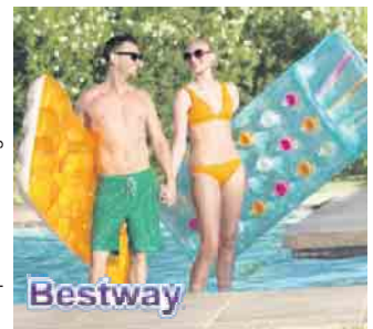
* Beispielhafte Abbildungen