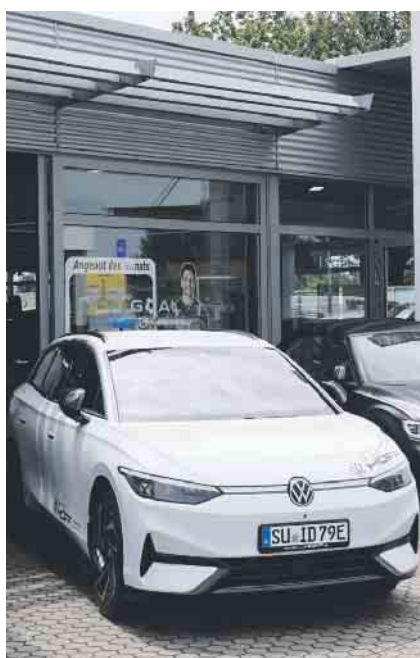
Das VW-Sondermodell GOAL