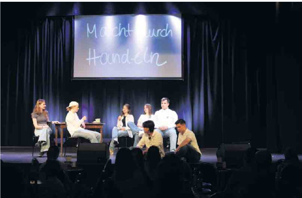
Beratung der nächsten Projekte.