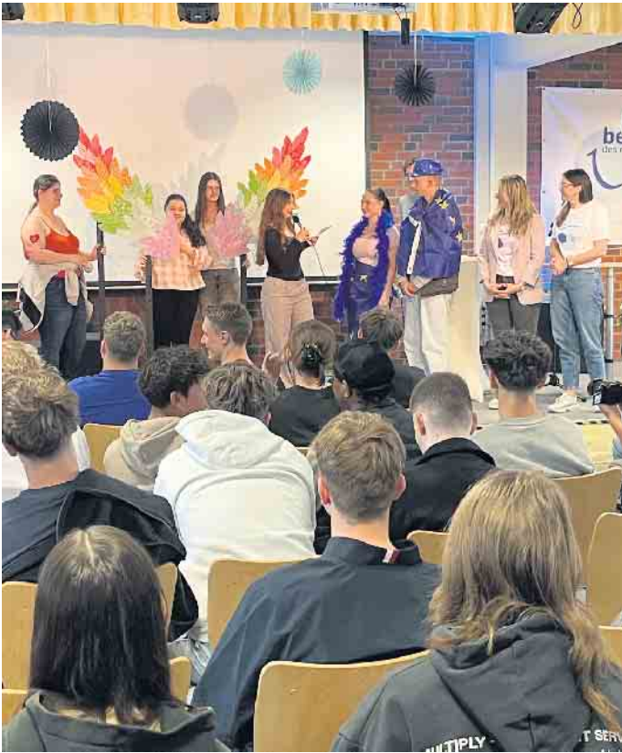
SchülerInnen präsentieren das Ergebnis des Kunstprojekts „Wir verleihen Flügel“ in der Aula.