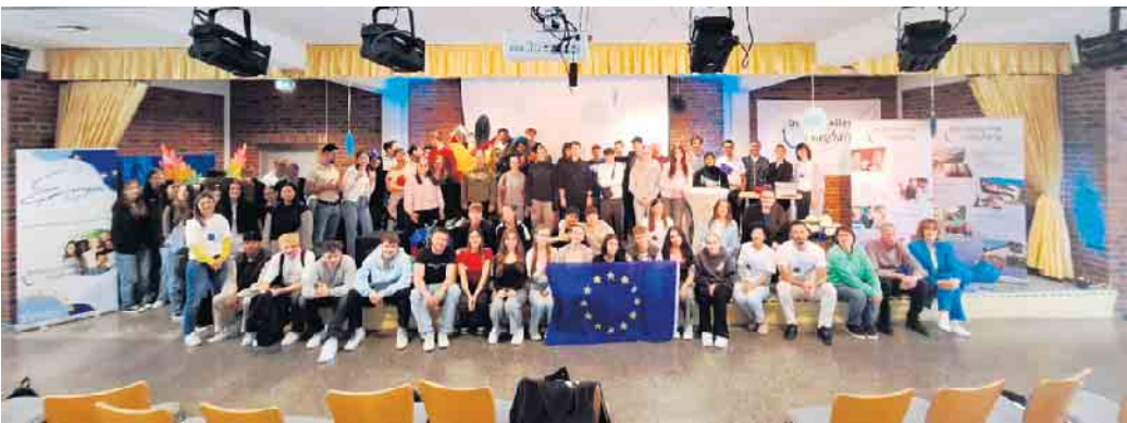
Die Teilnehmenden am Europatag in der Aula der Schule

Und es gibt sie doch - engagierte Teenager, die Spaß am Gestalten haben, sich aktiv einbringen und Interesse an den aktuellen Themen unserer Zeit zeigen. Beobachten konnte man dies zum Beispiel am vergangenen Donnerstag im Rahmen des Europatags, der in dieser Form erstmalig am Wirtschaftsgymnasium des Berufskollegs durchgeführt wurde. Aus insgesamt acht verschiedenen Workshops konnten sich die jungen Leute entsprechend ihrer Neigungen einen passenden auswählen, um sich in Gruppen zwischen 8 und 20 Schüler:innen am Vor- und frühen Nachmittag intensiv mit einem Thema zu beschäftigen. Dabei standen alle Angebote unter dem Motto „Vielfalt bei uns am Berufskolleg und in Europa - gemeinsam großARTig!“ Neben einem Kunstprojekt, bei dem die Teilnehmenden mit Hilfe von Künstlicher Intelligenz erzeugte Bilder zu den Themen Wirtschaft, Technik oder menschlicher Einfluss aussuchten und dann mit manuellen Kreativtechniken zu kleinen Kunstwerken gestalteten, fand auch ein Planspiel statt, das