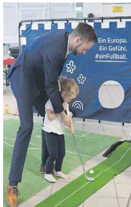
Gemeinsamer Golfschlag von Groß und Klein