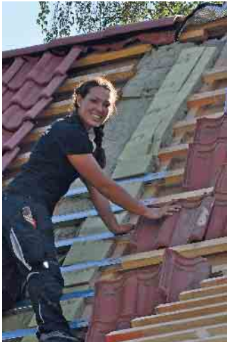
Dachdeckerinnen sind auf dem Vormarsch: schweres Tragen ist out, das übernehmen Lastenaufzüge.

bis: Plus 30 % im Vergleich zum Vorjahr. Gute Voraussetzungen sind neben handwerklichem Geschick ein mathematisches Grundverständnis und Teamfähigkeit. Wer zudem noch gern draußen arbeitet und dazu beitragen will, dass unser Klima besser wird, ist im Dachdeckerhandwerk genau richtig! (akz-o)