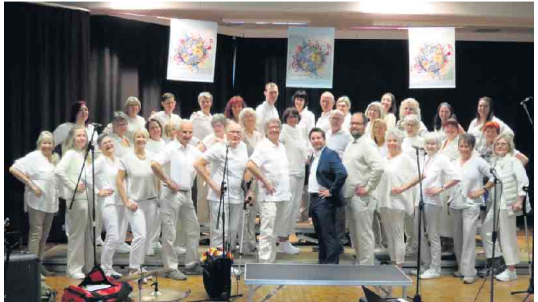
Da Capo Lohmar

Der Einstand nach der Pause war ein stimmgewaltig vorgetragenes