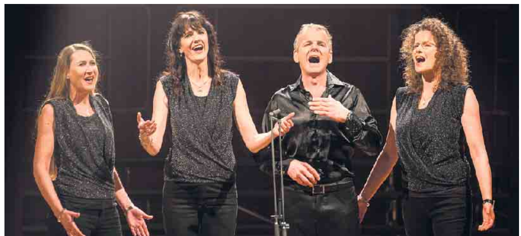
Die Klangküsse und der Hospizdienst feiern ihre Jubiläen gemeinsam.

Giersberg (Bariton) sowie Roger Hare (Bass). Die Veranstaltung beginnt um 18 Uhr.