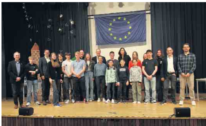
Das Orgateam mit den Politikern in der hinteren Reihe sowie weiteren Gästen

Vertreter von Bündnis 90/Die Grünen, CDU, FDP und SPD stellten sich den Fragen im Anno-Gymnasium