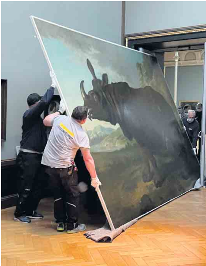
Das Gemälde von Nashorn Clara hängt üblicherweise im Staatlichen Museum Schwerin. Da das Haus wegen Renovierungsarbeiten für drei Jahre geschlossen ist, ging Clara mit großem Aufwand auf Reisen - unter anderem ins berühmte Rijksmuseum nach Amsterdam.