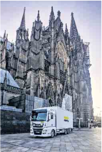
Köln ist die Heimat des traditionsreichen Speziallogistik-ers Hasenkamp. Im Bild das Wahrzeichen der Stadt am Rhein, der Dom.

entsprechend großvolumigen Transportbehälter. In der Kölner Manufaktur des Speziallogistik-ers Hasenkamp wurde eine Kiste in den Maßen 340 mal 511 Zentimeter gefertigt, der hölzerne Schutzkorpus wiegt 832 Kilogramm. „In unserer Firmengeschichte stellt die exklusiv für Clara gefertigte Transportkiste ein Novum dar“, erklärt Geschäftsführer Dr. Thomas Schneider. Das Kölner Traditionsunternehmen hat sich im Firmenbereich „Fine Arts“ auf den Transport von Kunst- und Kulturgütern spezialisiert: von der Totenmaske Tutanchamuns über Gemälde von Leonardo da Vinci bis hin zur Himmelsscheibe von Nebra und den Tonkriegen der Terakotta-Armee. „High-End-Klimakisten gewährleisten den gesamten Transport sensibler Kunstgüter über eine stabile Temperatur und gleichbleibende Luftfeuchtigkeit. Versendet wird weltweit per Luft- und Seefracht oder per Lkw“, so Schneider. Mitarbeitende können ständig ihr Jobprofil verändern und „horizontal“ wechseln Neben „Fine Arts“ betreibt Hasenkamp die Bereiche Relocations, Archivdepot und Final Mile Service als Subunternehmer für große Paketdienstleister. „Wir bieten zahlreiche internationale Jobs und Karrieremöglichkeiten in der Disposition und Logistik, im Lager und in der Schreinerei