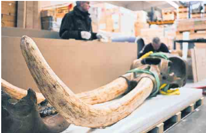
Köln ist die Heimat des traditionsreichen Speziallogistikers Hasenkamp. Im Bild das Wahrzeichen der Stadt am Rhein, der Dom.

Denn neben Fingerspitzengefühl und Augenmaß beim Bewegen durchs Museum verlangte die schiere Größe des Bildes einen