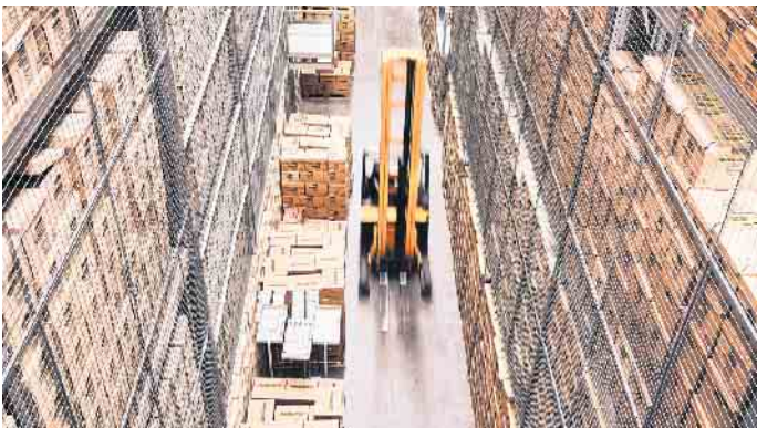
Bloß nicht schwindelig werden: Das Archivdepot in Frechen bei Köln hat gewaltige Dimensionen.