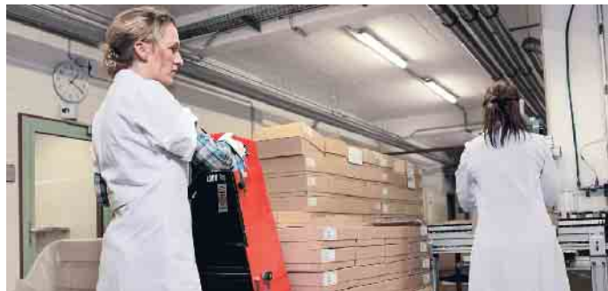
Zu den besonders belastenden Tätigkeiten zählen unter anderem das Heben und Tragen von Lasten.

Zu den besonders belastenden Tätigkeiten zählen unter anderem das Heben und Tragen von Lasten, Zwangshaltungen, sich ständig schnell wiederholende Tätigkeiten und Vibrationen. Für den Einstieg in die Gefährdungsbeurteilung von Muskel-Skelett-Belastungen haben BAuA und die Deutsche Gesetzliche Unfallversicherung Checklisten herausgebracht. Im Idealfall können hieraus bereits wirksame Maßnahmen abgeleitet werden. Ist die Beurteilung komplexer, sollte der betriebliche Praktiker ein