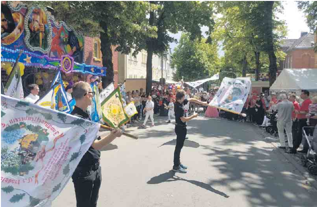
Während des großen Festumzugs auf der Wolsdorfer Kirmes zeigen zahlreiche Fähnriche der Junggesellenvereine und Maiclubs ihrem begeisterten Publikum mehrfach ihre schwungvollen Fändelschwenker-Künste.

Am gewohnten Standort auf der Jakobstraße, Höhe Lambertstraße, direkt an der Kirche Sankt Dreifaltigkeit, kann man sich bei der „Eintracht“ wieder exotische Köstlichkeiten und leckere Mix-Getränke schmecken lassen. Außerdem wird es dort auch wieder die heiß begehrten, aber gut gekühlten „Flens“-Stubbis geben. Zudem wird auch der unmittelbar benachbarte Bierpils des Wolsdorfer Tambourcorps „In Treue Fest“ 1953 e. V. wieder gemeinsam mit