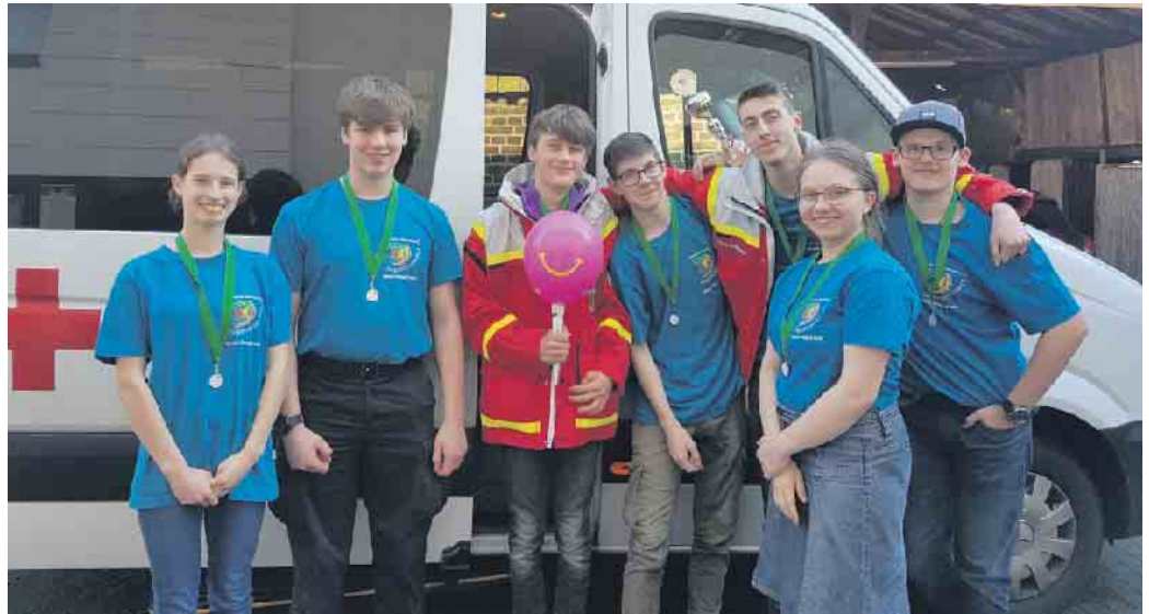
Die stolzen Titelverteidiger - das Jugendsanitätsteam der GE Am Michaelsberg

Unsere Schulgemeinschaft gratuliert ihren Schulsanitäter*innen zur zweiten gewonnenen Landesmeisterschaft.