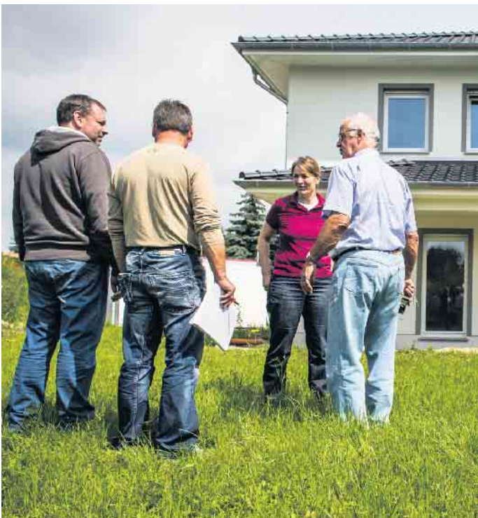
Die Bauabnahme ist ein wichtiger Meilenstein auf dem Weg ins Eigenheim und sollte daher möglichst mit sachverständiger Unterstützung gut vorbereitet sein.

Die Bauabnahme ist eine wichtige juristische Pflicht auf dem Weg ins neu gebaute Eigenheim. Sie stellt eine formelle Entgegennahme des bestellten Werkes durch den Auftraggeber - also den Bauherren - dar. Mit der Abnahme bestätigt er, dass das Bauunternehmen die vereinbarte Leistung vertragsgemäß und weitgehend mängelfrei erbracht hat. Dieser Vorgang hat weitreichende Folgen, die Häuslebauer nicht unterschätzen sollten, betont Erik Stange, Pressesprecher der Verbraucherschutzorganisation Bauherren-Schutzbund e. V. (BSB). Viele Bauschäden werden erst während der Gewährleistungszeit entdeckt Stange verweist auf eine Studie zu Baumängeln in der Gewährleistungsfrist von Häusern, die gesetzlich auf fünf Jahre festgelegt ist. Die Untersuchung, die in Zusammenarbeit mit dem Institut für Bauforschung e. V. erstellt wurde, zeigt, dass ein erheblicher Teil der Mängel erst nach der Bauabnahme auftritt. Nur etwa 21,5 Prozent der Bauschäden werden während der Bauzeit entdeckt, in den beiden ersten Jahren der Gewährleistungsfrist sind es dagegen gut 44 Prozent. Bis zur Abnahme muss das beauftragte Bauunternehmen nachweisen, dass sein Werk mängelfrei ist, danach geht die Beweispflicht auf die Bauherren über. Ab diesem Zeitpunkt wird die Durchsetzung von Mängelbeseitigungen daher deutlich schwieriger.