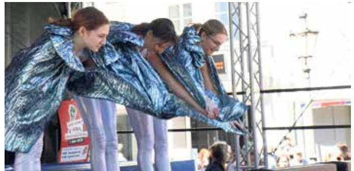
Drei Performerinnen verbeugen sich gemeinsam auf einer Bühne, eingehüllt in schimmernde, blau gemusterte Stoffe, während das Publikum zuschaut.

die Gelegenheit, gemeinsam Zeit zu verbringen. Das Fest knüpfte damit an die Tradition des Tags der Arbeit an, politische Inhalte mit Begegnung und Austausch zu verbinden. (MAB)