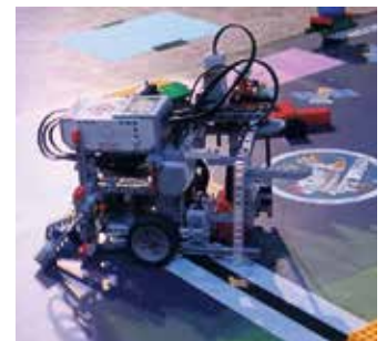
Roboter mit Aufbauten.

Teilnehmende Schulen des zdi-Roboterwettbewerbs im Rhein-Sieg-Kreis waren beim Wettbewerb in der Gesamtschule in Hennef West: Gesamtschule Hennef-West mit Hennef-West RoboRookies 1 und Hennef-West RoboRookies 2, das Städtisches Gymnasium Hennef mit Bricktronix und Scorpions, die Gesamtschule Neunkirchen-Seelscheid mit NKS Robotiker, das Anno-Gymnasium Siegburg mit Annonianer, die Gesamtschule Much mit RoboRock GM7 und RoboRock GM8 und das Collegium Josephinum, Bonn mit CoJoRobos, beim Wettbewerb in der Realschule Sankt Augustin Niederpleis: Albert-Einstein-Gymnasium,