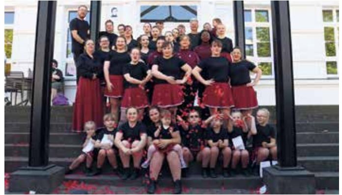
Gardesport- und Tanzsportverein Augustiner Dancing Devils

Auch außerhalb der Bühne gab es viel zu entdecken. Die Jugendfeuerwehr Siegburg präsentierte ihre Arbeit mit einer Spritzwand und einem Löschfahrzeug. Besucher konnten Technik aus nächster Nähe erleben und selbst ausprobieren. Weitere Vereine informierten an Ständen über ihre Angebote. Für Verpflegung