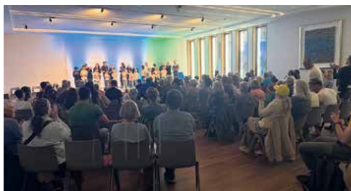
Volles Haus am 1. Mai im KSI

Nach der erfolgreichen Premiere in der Hans Alfred Keller-Schule bildete die zweite Aufführung am 1. Mai im Europaforum des Katholisch-Sozialen Instituts (KSI) auf dem Michaelsberg den krönenden Abschluss. Die moderne Architektur des Forums bot die perfekte Kulisse für dieses zukunftsorientierte Miteinander. Ein solch ambitioniertes Projekt, das bürgerschaftliches Engagement und kulturelle Bildung so eng verzahnt, benötigt starke Partner. Die Dr. Jürgen Rembold Stiftung ermöglichte durch ihre Förderung, dass dieses interkulturelle Experiment Realität