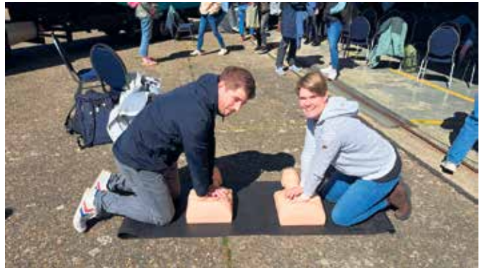
Kolleg*innen der GSM in der Fortbildung zur Laienreanimation

Der Ausbildungstag in Würselen brachte viele praktische Einblicke. Fachkräfte des ADAC, der TH Aachen, des Deutschen Roten Kreuzes und weiterer Organisationen zeigten, wie einfach und gleichzeitig entscheidend die drei Schritte Prüfen - Rufen - Drücken sind. Deutschland hat sich in den vergangenen Jahren bei der Reanimationsbereitschaft zwar verbessert, liegt aber mit etwa 50 Prozent noch deutlich unter dem europäischen Durchschnitt von rund 80 Prozent. Dabei ist ein Fakt besonders wichtig: In etwa 80 Prozent aller Fälle reanimiert man Menschen, die man kennt - Familienmitglieder, Freunde oder Mitschüler*innen. Umso bedeutsamer ist es, Hemmschwellen