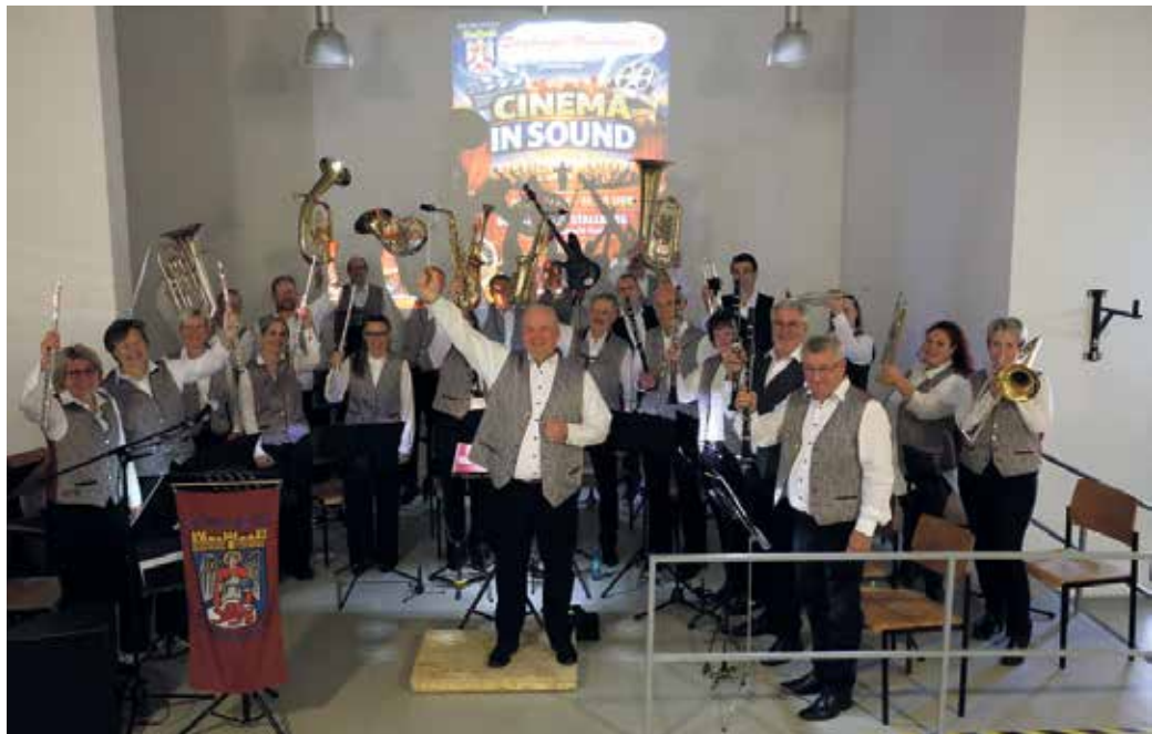
Volle Bühne, großes Kino: Die Siegburger Musikanten live bei „Cinema in Sound“ im Bürgerhaus Stallberg.

Bereits mit der legendären Fanfare der 20th Century Fox war klar: Dieses Konzert stand ganz im Zeichen der großen Filmmusik. In einem abwechslungsreichen Programm spannten die Siegburger Musikanten den Bogen von klassischen Westernmelodien wie „Die glorreichen Sieben“ und „Spiel mir das Lied vom Tod“ über Fantasy- und Abenteuerklänge aus „Harry Potter“, „Dragonheart“ und „Die Maske des Zorro“ bis hin zu bekannten TV- und Filmscores wie „Mission: Impossible“, „Das A-Team“, „Der dritte Mann“ und dem James-Bond-Titel „Skyfall“. Dabei beeindruckte das Orchester mit seiner großen musikalischen Bandbreite: Zarte, stimmungsvolle Passagen wechselten sich mit kraftvollen, rhythmisch prägnanten Tutti-Momenten ab. Auch solistische Beiträge setzten besondere Akzente und sorgten für zahlreiche Gänsehautmomente. Den fulminanten