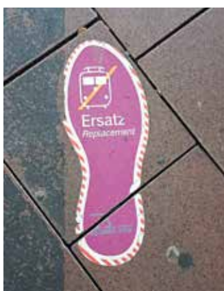
Wegweiser zum Schienenersatzverkehr der S66

Bauarbeiten nicht zur Verfügung, da er als Wendeschleife genutzt wird. SWB Bus und Bahn empfiehlt Fahrgästen, mehr Zeit einzuplanen und sich vorab über alternative Verbindungen zu informieren. (MAB)