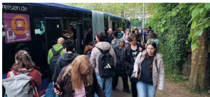
Volle Busse sind momentan leider nicht auszuschließen.