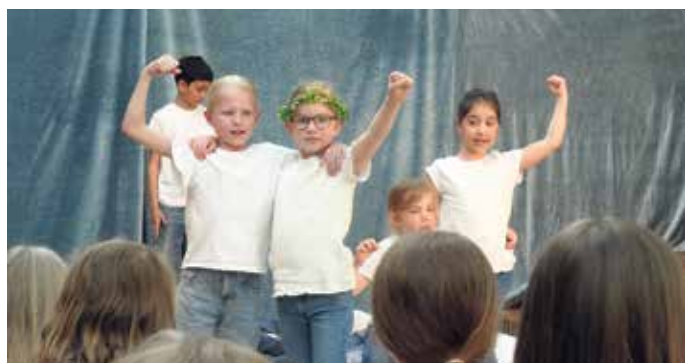
Starker Auftritt der Kinder der Hans-Alfred-Keller-Schule

werden konnte. Die Stiftung setzt damit ein Zeichen für den Zusammenhalt in der Stadtgesellschaft und