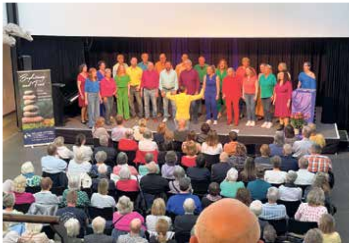
Der Eitorfer Chor Klangfarben singt für den Hospizdienst im Stadtmuseum Siegburg.

so hatten die wenigsten die neu arrangierten Musikstücke bislang kaum gehört. Folglich kam während des neunzig minütigen Konzerts keine Sekunde Langeweile auf. Während des Benefizkonzertes informierten Mitarbeitende des Ambulanten Hospizdienstes Siegburg und Sankt Augustin in kurzen Ansprachen über die Arbeit der Ökumenischen Initiative, die vor 31 Jahren gegründet wurde. Wir sind das Hospiz, das nach Hause kommt - so lautet das Motto des Vereins, dessen ehrenamtliche Sterbe- und Trauerbegleiter an der Seite von schwerkranken Menschen und ihren Angehörigen sind. Zahlreiche Konzertbesucher nutzten im Anschluss an das Konzert die Gelegenheit, mit den Hospizbegleite-