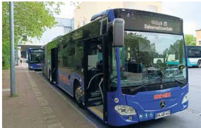
Der Schienenersatzverkehr der Linie 66 fährt vom Bussteig E ab.

Einzelne Haltestellen sind nur eingeschränkt erreichbar. So wird die Station Hangelar West durch die Ersatzhaltestelle Hangelar B56 ersetzt.