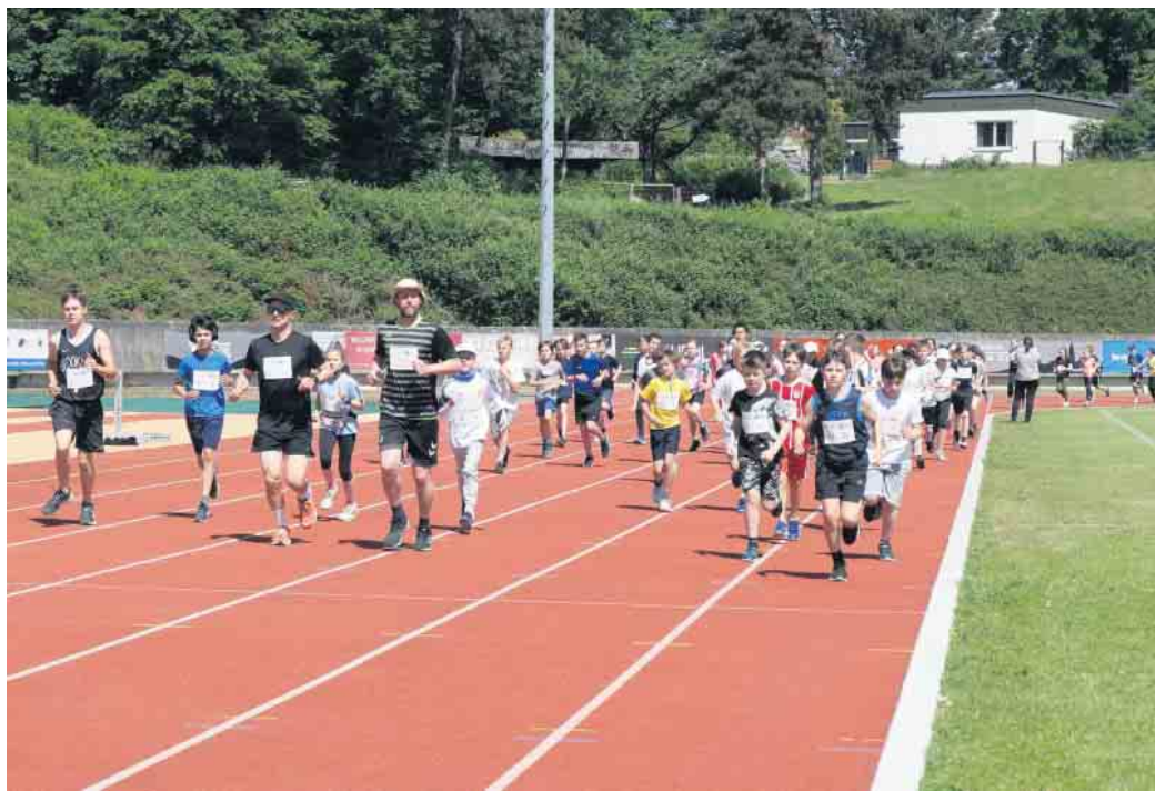
Spendenlauf 2022: Große Anstrengung für einen guten Zweck.