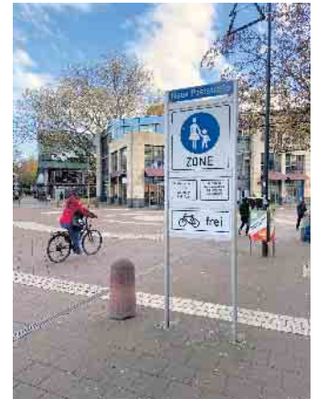
Wichtiger Schritt: Öffnung der Fußgängerzone für den Radverkehr!

Ende: Aus der Arbeit der Ratspartei B90/Grüne