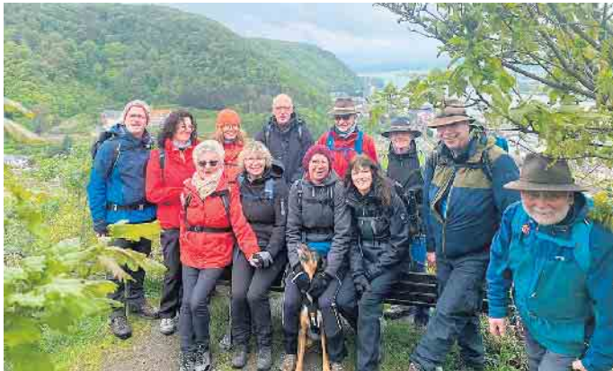
Die Wandergruppe I des PSV Siegburg auf dem Vulkanlehrpfad mit Blick in das Neuwieder Becken.

Kurze Zeit zeigten sich ausge dehnte Bärlauch-Felder rechts