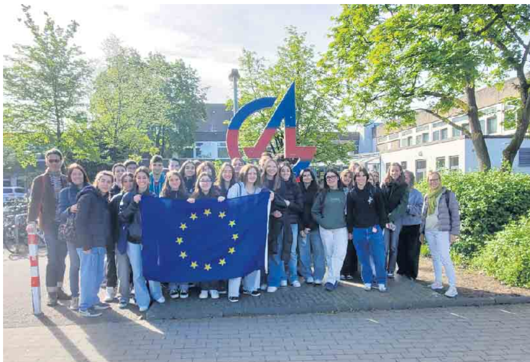
Vor dem Anno-Gymnasium.

Außer der hübschen Stadt Siegburg standen für die italienischen Gäste noch die Besichtigung des Kölner Doms, ein Besuch im Beethoven-Haus in Bonn und eine Wanderung auf den Drachenfels auf dem Programm. Gemeinsam mit den deutschen Jugendlichen fuhren sie nach Aachen und erkundeten dort die Zeugnisse der gemeinsamen europäischen Vergangenheit und der gelebten Gegenwart. Bei alledem blieb aber genug Raum für gemeinsame private Aktivitäten mit den