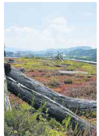
Die Begrünung von Flachdächern trägt zu einem besseren Mikroklima bei.

Unter www.nutzedeindach.de gibt es viele weitere Informationen dazu. Klimaschutz auf dem Dach lässt sich ebenfalls verwirklichen, indem man auf erneuerbare Energie setzt. Solaranlagen sind nicht nur auf Flach-, sondern auch auf Steildächern eine gute Idee, um zur Energiewende beizutragen und gleichzeitig das Klima zu schützen. (djd)