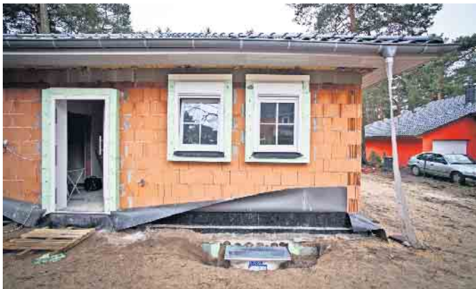
Die Abschlagszahlungen für einen Hausbau sollen mit dem tatsächlichen Baufortschritt konform gehen. Als Daumenregel gilt: nicht mehr als 50 Prozent der Bausumme bis zum Abschluss des Rohbaus.

summe geleistet werden sollten. Unter www.bsb-ev.de gibt es weitere Infos zum Bauen und einen kostenlosen Ratgeber „Hausneubau“. Verbraucher haben Anspruch auf Fertigstellungssicherheit