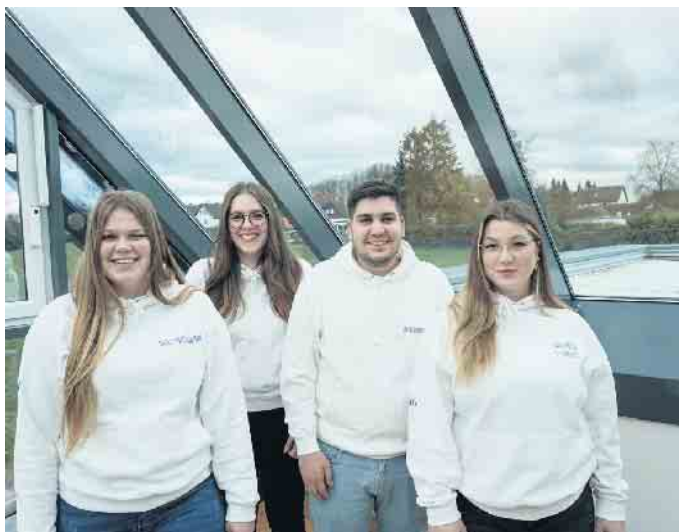
ROLF Fensterbau bietet Ausbildungen mit hervorragenden Zukunftsaussichten

ROLF Fensterbau bietet viele Vorteile für Auszubildende, dazu zählt vor allem eine sichere Zukunftsperspektive. Schon seit vielen Jahren bildet das regionale Unternehmen junge Talente aus. Damit sie sich auch nach der Ausbildungszeit bei ROLF Fensterbau weiterentwickeln und wachsen können, strebt der Betrieb stets eine möglichst hohe Übernahmequote an. Das breite Angebotsspektrum an Ausbildungsjobs hat viele Facetten: Möglich ist eine Ausbildung zum/zur Industriekaufmann/-frau, Fachinformatiker/-in mit der Fachrichtung Systemintegration, Fachlagerist/-in oder Fachkraft für Lagerlogistik, Verfahrensmechaniker/-in für Kunststoff- und Kautschuktechnik. Seit knapp zwei Jahren steht außerdem die Fachausbildung zum/zur Kaufmann/-frau im E-Commerce zur Auswahl. Zudem bietet ROLF Fensterbau als erstes Unternehmen in Deutschland einen einjährigen Zertifikatslehrgang zum/zur Fensterbaumonteur/-in an, um mehr Fachkräfte für diese abwechslungsreiche Tätigkeit zu schu-