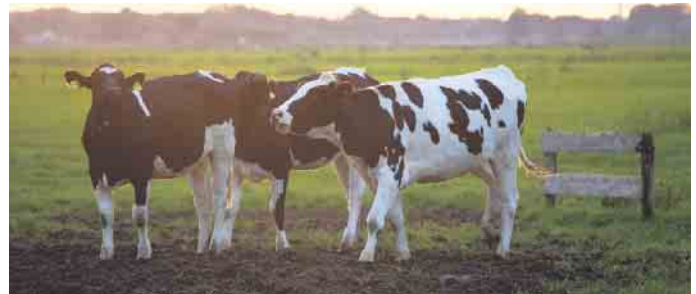
Glückliche Kühe auf der Weide - leider nicht selbstverständlich.

Diese und andere Fragen konnten auch in diesem Jahr wieder Schülerinnen und Schüler des Fortsetzung auf Seite 6