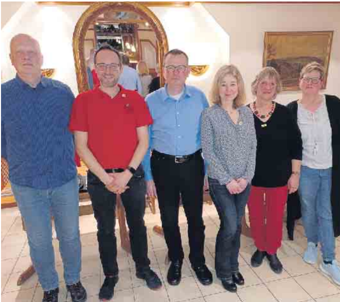
Der neue Vorstand

zende drei neue Vereine/Einrichtungen, deren Aufnahmeanträge einstimmig angenommen wurden, in der Interessengemeinschaft begrüßen.