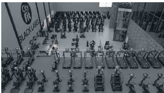
Pläne CityFit Spich.

CityFit wird am 06. Mai um 18:00 sein neues Fitnessstudio in Spich eröffnen. Somit ist es bereits das vierte in der Region. Die Kletterhalle wird dabei in ein hochmodernes Studio umgewandelt. Geschäftsführer Altan Yüklér und das gesamte CityFit Team arbeiten mit Hochdruck an der Transformation. Jetzt können bei Anmeldung noch 277,- € gespart werden.