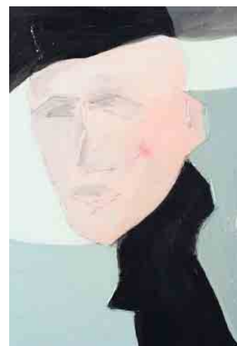
SUBTITLED, Mischtechnik auf Leinwand, 100 cm x 70 cm, 2022