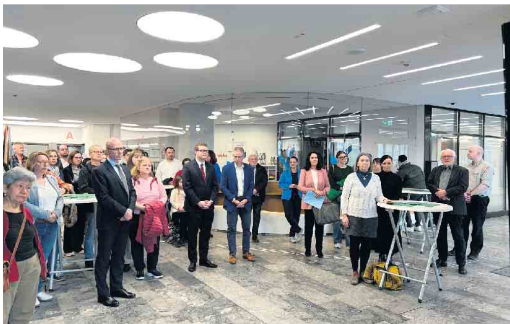
Viele Interessierte waren ins Foyer gekommen, um der Eröffnung beizuwohnen.