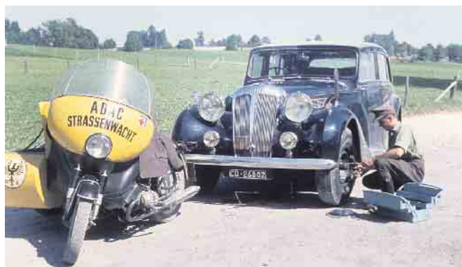
Mit 60 Motorrad-Gespannen begannen im Mai 1954 die Gelben Engel des ADAC ihren Pannen-Hilfsdienst.

Mehr Infos unter www.adac.de und 089-558959697