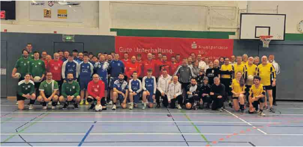
Acht Mannschaften traten beim 22. Heimturnier der STV-Faustballer an.

dass eine neue Medaillen-Tradition entstanden ist. Im Vorfeld des Turniers hatten wieder die Aktiven der Faustball-Abteilung des STV auf jede nur erdenkliche Art und Weise mit angepackt und geholfen, damit es wieder ein gelungenes Turnier wurde.