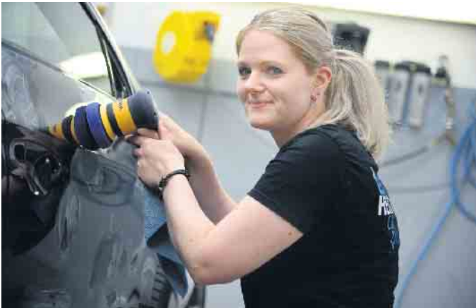
Die Politur von Hand erfordert Routine und Gefühl

Für Schadens- und Unfallmanagement und Gespräche mit Versicherungen und Leasinggesellschaften gibt es bei Heidinger Spezialisten. Und dazu drei Handwerksmeister, die für die fachliche Kompetenz sorgen. Reifenwechsel und eine sachgemäße Einlagerung bietet carplus Heidinger auch an. Glasschäden repariert man ebenfalls und kalibriert - auch für andere Betriebe -