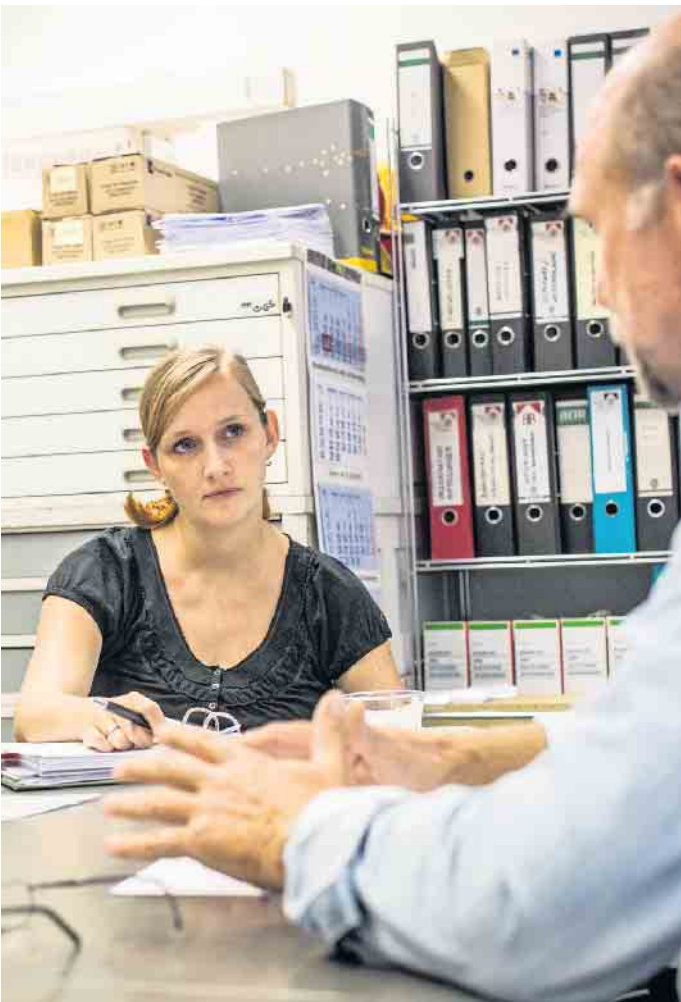
Gute Vorinformationen und sachverständige Beratung im Vorfeld eines Eigenheimprojekts verringern die Gefahr, Opfer einer Insolvenz am Bau zu werden.

venzverwalter zu kontaktieren und sich über den Status des Verfahrens zu informieren. Ansprüche lassen sich über die Dokumentation bestehender Verträge und Zahlungen anwaltliche Unterstützung absichern. Zusätzlich ist es sinnvoll, einen Anwalt für Bau-recht einzuschalten. (DJD)