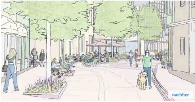
...vielseitigen, barrierefreien und historischen Umgestaltung weichen.