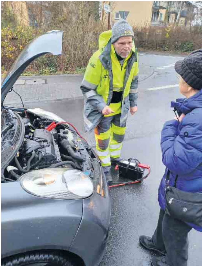
Vor der Hilfe erst einmal die Beruhigung für die ältere Dame...

Seit über 70 Jahren auf den Straßen, um zu helfen: Ich begleite einen ADAC-Straßenwachtfahrer bei der Pannenhilfe. Einmal im Leben: So erfüllte der WDR 4 kürzlich ungewöhnliche Hörerideen. Auf einem 140 Meter hohen Windrad stehen oder mit den „Höhnern“ auftreten, alles wurde möglich. Meinen Wunsch, bei denen mitzufahren, die tagtäglich für uns im Dienst sind, erfüllte mir der ADAC Nordrhein: Mit einem Gelben Engel unterwegs.