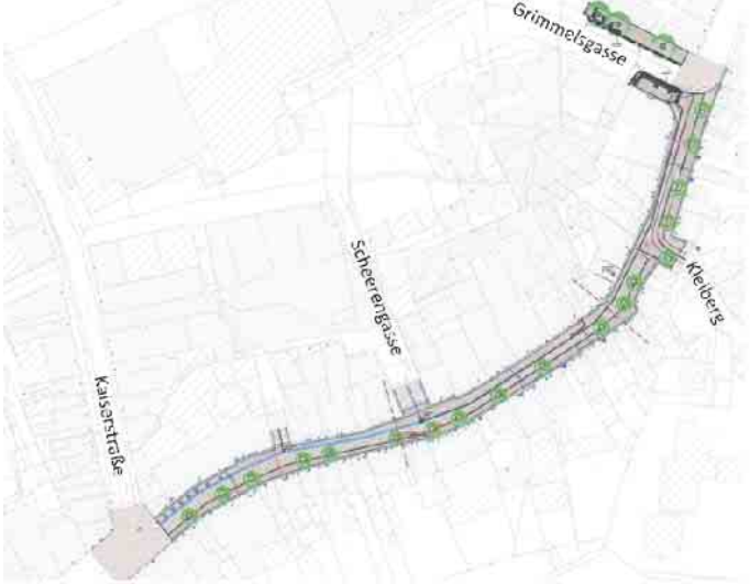
In drei Abschnitten mit jeweils 12 Monaten Bauzeit soll die Holzgasse umgestaltet werden.

Auch mehr Grün soll die Straße künftig prägen. Statt der derzeit zwölf Bäume sollen 18 neue Exemplare gepflanzt werden. Die bisherigen Stieleichen müssen der Sanierung weichen, künftig sollen schmal wachsende, standortgerechte Bäume für Schatten und Atmosphäre sorgen. Darüber hinaus plant die Stadt neue Sitzgelegenheiten, Trinkbrunnen, Spielpunkte für Kinder sowie moderne Fahrradabstellanlagen. Ebenso Hinweise und Erinnerungen an die Historie der Straße. Zum Beispiel auf die ehemalige Synagoge und das jüdische Leben, das einst dort stattgefunden hat. Die Sanierung soll in drei Bauabschnitten erfolgen, um die Belastung für Anwohnerinnen und Anwohner sowie für den Einzelhandel so gering wie möglich zu halten: Der erste Abschnitt reicht von der Kaiserstraße bis zur Scheerengasse; der zweite von der Scheerengasse bis zum Kleiberg; der dritte vom Kleiberg bis zur Grimmelsgasse. Für jeden Abschnitt sind etwa zwölf Monate Bauzeit geplant. Wichtig ist der Stadtverwaltung, dass alle Geschäfte während der Bauarbeiten zugänglich bleiben. Dafür sollen - wenn nötig - provisorische Stege eingerichtet werden. Auch Außengastronomie soll weiter möglich sein. Bevor mit dem Bau begonnen werden kann, muss die Stadt Siegburg die Städtebauförderung beim Land NRW beantragen. Diese ist für spätestens September geplant. Wird der Antrag bewilligt, könnte im Sommer 2026 ein Förderbescheid ergehen und der Baubeginn dann ein Jahr später erfolgen. (pho)