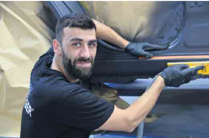
Sorgfältige Vorarbeit, bevor es in die Lackierkabine geht

Wabenleuchten in der Annahme-Halle: So entdeckt man alle Schäden