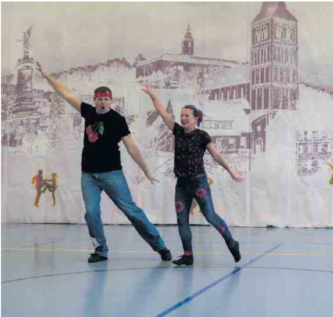
Rock'n'Roll-Paar beim Nord Cup 2024.