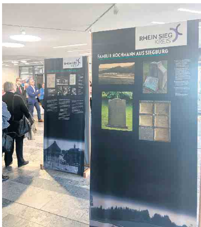
Zu den Tafeln über die Siegburger Familien recherchierten Schülerinnen und Schüler des Gymnasium Alleestraße.