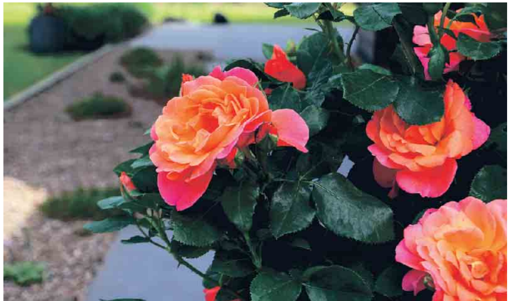
Pure Intensität - Ein Farbfeuerwerk in Blütenform

Eine Rose, die immer top aussieht, niemals kränkt und einfach nicht aufhört zu blühen. Klingt wie ein Märchen? Nein, sie nennt sich Zepeti Rose. Diese Schönheit wurde in Frankreich gezüchtet und kombiniert die besten Eigenschaften ihrer Eltern - eine Dauerblüh-Zwergrose und die robuste Knock-Out-Rose.