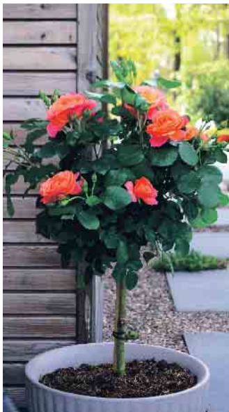
Macht auch als Stämmchen eine gute Figur - Sugar Candy Rose

Das Ergebnis: eine kompakte, robuste Pflanze mit leuchtend roten Blüten und glänzendem, dunkelgrünem Laub. Sie trotz Hitze, Frost und sogar Pilzkrankheiten. Ob im Beet oder im Kübel, die Zepeti ist immer ein Hingucker. Selbst verblühte Blüten sehen noch so gut aus, dass man sie gar nicht abschneiden muss.