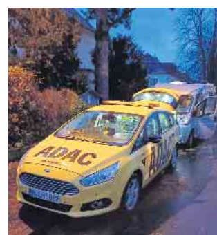
Batterie-Starthilfe bei einem Wohnmobil: Typischer Fall bei Dauerparkern

Doch bis zu meinem „Dienstschluss“ beim ADAC Pannendienst passiert nichts mehr. „Übrigens, die meisten Defekte an E-Autos oder Hybrid-Modellen betreffen nicht die Antriebstechnik oder die Speicherbatterie, sondern wie bei den Verbrennern die Starterbatterien.“ Auch eine interessante Erkenntnis. Rund 45 Prozent der Defekte , die bei über 3,6 Millionen Einsätzen im letzten Jahr von den Gelben Engeln behoben werden, betreffen die Batterie. Mein Dank für die interessanten Einbli-