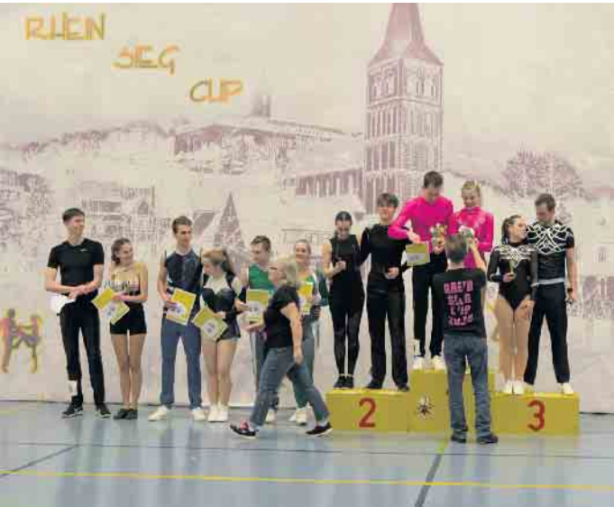
Siegerehrung der Gewinner des Nord Cup 2024

Der Endspurt steht an. Am Samstag, 5. April, heißt es endlich: Rhein-Sieg-Cup, Nord Cup und Landesmeisterschaft in Siegburg. Die Vorbereitungen sind in vollem Gange und halten den Verein auf Trab. Der Rock'n'Roll-Club Siegburg freut sich, bald die Turnierpaare, Wertungsrichter und Gäste aus ganz Deutschland begrüßen zu dürfen. Um 13 Uhr heißt es in der Halle des Anno-Gymnasiums für die ersten Tanzpaare alles geben und zeigen, was sie alles drauf haben. Für das leibliche Wohl aller ist natürlich auch gesorgt. Unsere Cafeteria bietet von herzhaften Salaten bis zu süßen Kuchen für jeden das Passende. Hier können sich unsere Gäste stärken, um im Anschluss den tänzerischen Wettkampf der Turnierpaare zu bestaunen und diese kräftig anzufeuern. Weitere Infos zu dem Turnier und der Ausschreibung findet Sie auf unserer Website www.tanzen-siegburg.de .