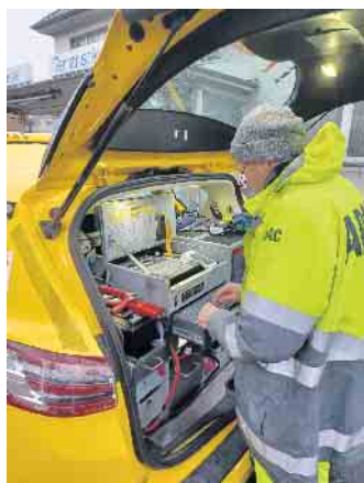
Nach der Hilfe wird im Computer-Netzwerk ein Pannenbeleg erstellt.

rund 40 Minuten war alles erledigt. Der Rat des ADAC-Mannes: Bitte am nächsten Tag sofort eine Werkstatt aufsuchen und einen neuen Reifen aufziehen lassen. Denn Ersatzreifen können trotz gutem Profil durch einen chemischen Prozess beschädigt sein und so kann sich die Lauffläche lösen. Was böse enden kann. Dankbar und beruhigt konnte die Dame weiter fahren.