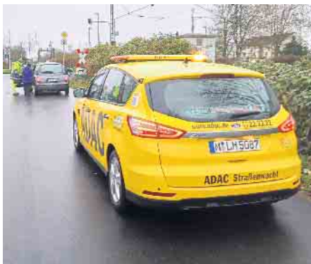
Der erste gemeinsame Einsatz: Mitten im Fahrbetrieb gab eine Batterie auf.

An einem regnerischen, nasskalten Wintertag war es soweit. Ich stieg in einen Ford S-max.