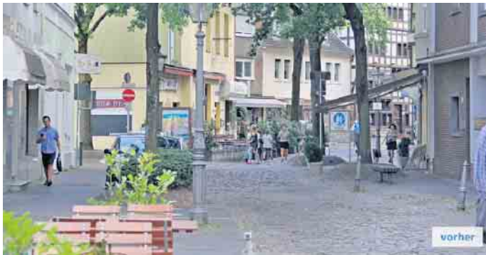
So soll das hier dargestellte alte Ambiente einer...