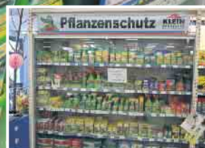
Abb. sind Beispiele! Produkte in Ausstellungen und Lager können abweichen!

KLEIN BAUSTOFFE Baumarkt Brennstoffe FUTTERMARKT