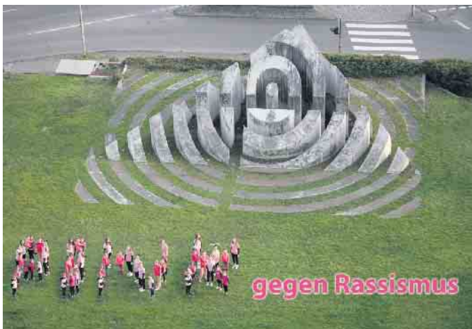
Unsere ABC-Kids und RocketGirls setzen ein Zeichen in Siegburg.

Tanzverein setzt mit PINK ein Zeichen gegen Rassismus