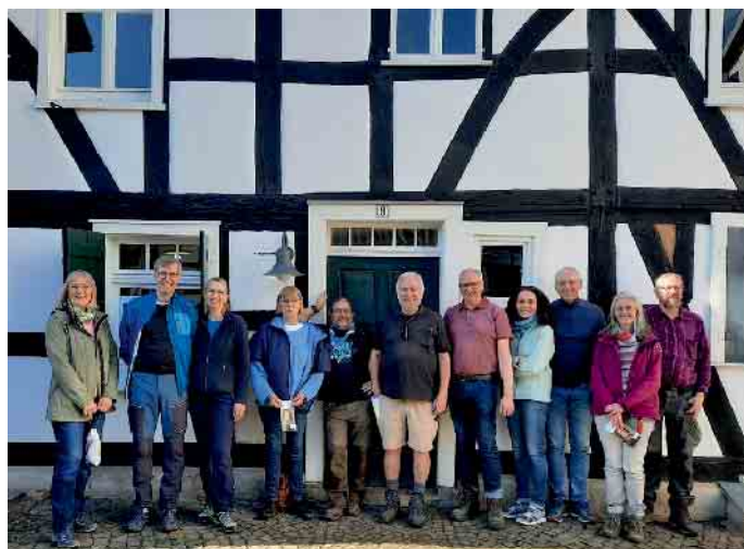
Die Wandergruppe vor der Gedenkstätte „Landjuden an der Sieg“.

Unter der Leitung des Vorsitzenden des Fördervereins, Dr. Michael Laska, startete die Wanderung an der Grube Silberhardt in Windeck-Öttershagen, Sie führte zunächst durch das Juchtbachtal, dann durch das Rosbachtal, weiter hinauf zur Jugendherberge Rosbach, wo eine kurze Rast eingelegt wurde, und von dort schließlich zur Gedenkstätte. Höhepunkt war eine exklusive, sehr bewegende Führung durch die Räume des rund 200 Jahre alten Fachwerkgebäude, in dem jüdisches Leben auf dem Land vor 1933, aber auch Verfolgung und Vernichtung der ehemals in der Siegregion lebenden Juden dokumentiert sind. Der Weg führte zurück zum Ausgangspunkt in Öttershagen.