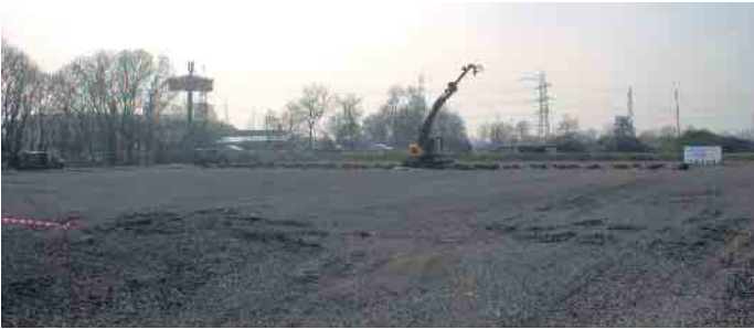
Auf dem hinteren Teil des Geländes werden bereits Bodenarbeiten durchgeführt.

wicklungen im Blick behalten, so der Bürgermeister. David Schnabel stellte ein umfangreiches Präventionsprogramm für Spielsucht vor, das im Notfall bei Gefährdeten greifen sollte. (pho)