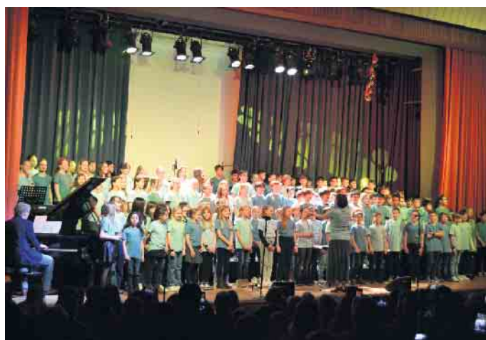
Gemeinsamer Chor-Auftritt der 5. Klassen.

sang das Publikum in eine besondere Stimmung versetzte. Abwechslungsreich war der Abend auch durch die Auftritte von Schülerinnen und Schülern aus dem Literatur- und Theaterkurs, die selbst verfasste Texte vortrugen. Und schließlich präsentierte im Foyer der Kunstkurs seine Objekte. Der Höhepunkt dieses musischen Abends war am Ende aber sicher der Auftritt von fast 180 Kindern, die trotz des langen Abends konzentriert und präzise mit ihrer Vorführung von Mark Forsters „Chöre“ das Publikum beeindruckten. Die eine oder der andere verließ die Aula sicher mit einer Gänsehaut.