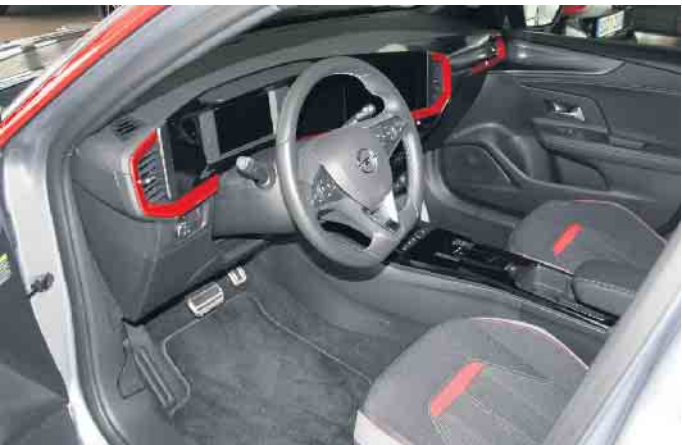
Farbig und modern: Interieur im Opel Mokka.