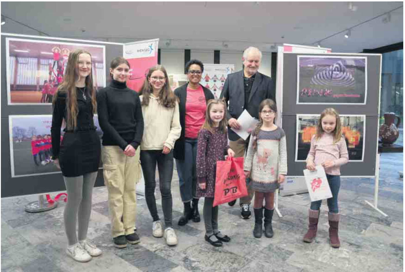
Preisverleihung 1. Platz des Fotowettbewerbs

Rock'n'Roll Club Siegburg e.V. holt den 1. Platz beim Fotowettbewerb