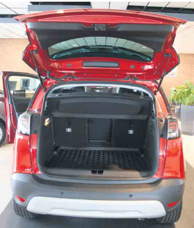
Große Heckklappe, Kombiheck, vier Türen: SUV-Merkmale