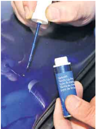
Kleine Steinschläge im Lack lassen sich per Smart-Repair unsichtbar machen.

Fahrzeug verspricht hier ein Filtertausch oder eine gründliche Desinfektion der Lüftungskanäle. (djd)