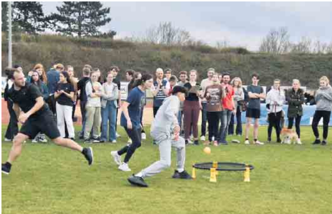
Sportliches Engagement von Schülern und Lehrern

Spaßige Aktion „Q2 gegen Lehrer“ bei bestem Wetter