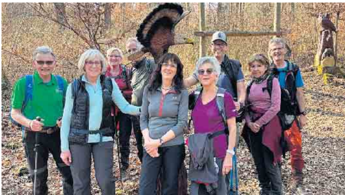
Die Wandergruppe 1 des PSV-Siegburg beim Foto-Shooting während der Wanderung am 9. März.

Elf Wanderfreundinnen und Wanderfreunde trafen sich bei strahlendem Sonnenschein am Sportplatz in Oberelbert, wenige Kilometer hinter Montabaur. Am Parkplatz in diesem kleinen Dorf gab es ein bürgerschaftlich geführtes „Dorflädchen“ mit frischem Kaffee, Backwaren und sonstiger Marschverpflegung. Perfekt. Zunächst ging es ins Sterzenbachtal mit einigen Fischteiche zu einer alten Mühle, deren Ursprung auf das Jahr 1386 zurückgeht. Der sanft ansteigende Weg führt nach 4 km zu einer kleinen Marienkapelle und mehreren Bänken mit einem schönen Fernblick bis in den Taunus hinein. Leider war es noch etwas diesig, der höchste Berg des Westerwaldes, die Fuchskaute, war erkennbar. Nach dem nächsten Dörfchen Niederelbert, in dem der ehemalige SPD-Vorsitzende Rudolf Scharping das