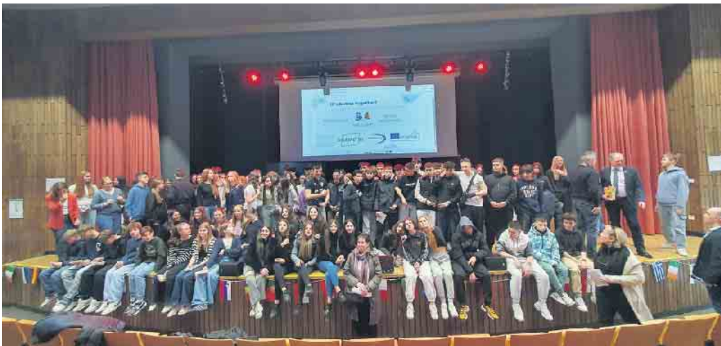
Große Begegnung am Anno.

Ein europäisches Austauschprojekt am Anno-Gymnasium Siegburg