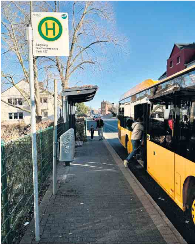
Begrünte Bushaltestelle an der Beethovenstraße

Siegburg setzt auf nachhaltige Haltestellen