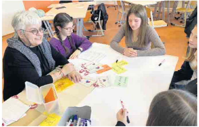
Gemeinsame Arbeit an Projekten.

das Projekt vermitteln möchte. Schon im September wird sich die Projektgruppe in Thessaloniki wiedersehen, um das gemeinsame Arbeiten fortzusetzen. Bis dahin bleiben die Jugendlichen über die digitale eTwinning-Projektplattform in Kontakt, tauschen sich aus und bereiten sich auf das nächste Treffen vor. Es ist also kein „Goodbye“, sondern vielmehr ein „Looking forward to seeing you soon in Thessaloniki“. Das Projekt hat einmal mehr gezeigt: Europa wächst durch Begegnung - und Freundschaften kennen keine Grenzen.