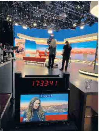
Hinter der Kamera