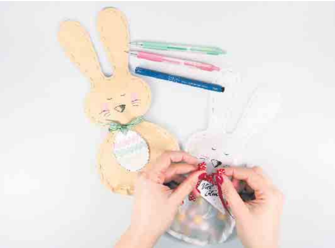
Niedliche Osterhasentüten machen die Eiersuche noch spannender und abwechslungsreicher.

Die Eiersuche ist für Kinder das Highlight an Ostern - Spiel und Spaß sind garantiert. Dabei müssen Schokoeier und Co. aber nicht immer im Nest liegen. Die kleinen Naschereien lassen sich auch kreativ in einer selbst gemachten Hasentüte verpacken. Das macht die Suche gleich noch mal spannender und abwechslungsreicher, wenn in einem der Verstecke ein niedlicher Osterhase wartet! Aber nicht nur für die Kleinen sind die Hasentüten eine schöne Idee, auch als Mitbringsel zum Osterbrunch kommen sie gut an. Denn statt Bonbons, können darin zum Beispiel auch Blumensamen und andere kleine Überraschungen verpackt werden. Mit nur wenigen Materialien und Kreativstiften sind die Hasentüten im Handumdrehen gebastelt. Und so geht's: