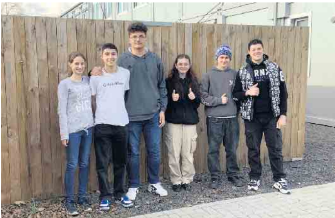
Schüler*innen der GE Am Michaelsberg bereiten sich auf die Reise nach Bosnien-Herzegowina vor.

Schüler*innen der Gesamtschule Am Michaelsberg bereiten sich auf die Fahrt nach Bihac vor