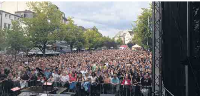
Grandioses Event der Funken Blau-Weiß im Sommer 2019: 5.000 Menschen feierten auf dem Siegburger Marktplatz beim Open-Air der Funken Blau-Weiß. Der Kartenvorverkauf für das diesjährige Open-Air-Event der Blau-Weißen läuft bereits auf vollen Touren.

Funken feiern Open-Air-Event mit Räuber und Bläck Fööss