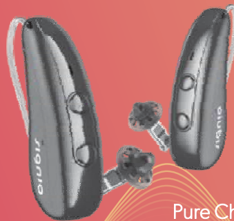
Pure Charge&Go IX