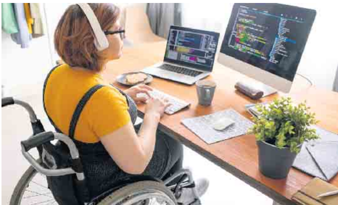
Menschen mit Behinderung können im Job genauso glücklich werden wie Nicht-Behinderte auch.

können wie Nicht-Behinderte, ist die bauliche und vor allem die digitale Barrierefreiheit“, weiß der Inklusionsbeauftragte bei Siemens, Andreas Melzer. „Wir haben großes Interesse daran, Menschen mit Behinderung in unser Unternehmen zu holen, da viele von ihnen gut qualifiziert und oft hoch motiviert sind“, berichtet er. Während des Bewerbungsprozesses sollte direkt offen und ehrlich angesprochen werden, was der jeweilige Mensch braucht. Und auch wenn eine Jobbeschreibung nicht zu 100 Pro-