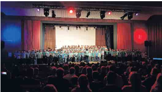
Alle Chöre vereint auf der Bühne.

Der Kulturabend am Anno-Gymnasium verlieh den Kindern und Jugendlichen eine Stimme