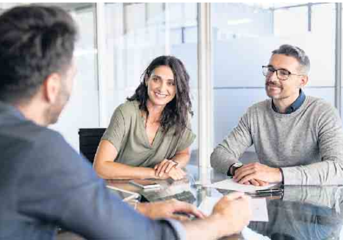
Vergleichen lohnt sich: Wer vor der Anschlussfinanzierung für eine Immobilie steht, sollte verschiedene Optionen prüfen.

Die Bauzinsen sind in den vergangenen Monaten merklich in die Höhe geschneit. Immobilienbesitzer, deren Zinsbindung demnächst ausläuft, fragen sich daher, wie sie die nächste Finanzierungsrunde stemmen können. Wichtig ist es in jedem Fall, keine Entscheidungen zu überstürzen, sondern die Optionen gründlich zu prüfen. Mit einer durchdachten Planung können sich die meisten Hauseigentümer die Anschlussfinanzierung gut leisten - und dabei häufig noch Geld sparen. Ein Bankenwechsel kann sich lohnen Darlehensnehmer, deren Zinsbindung demnächst ausläuft, sollten nicht in Panik verfallen: In vielen Fällen ist die Erstfinanzierung mit