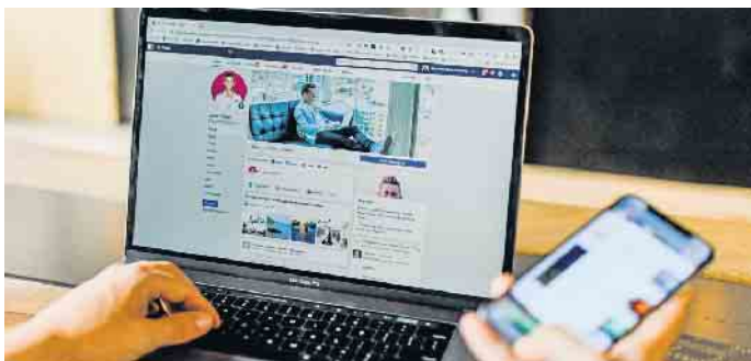
In der virtuellen Welt überzeugen: Stellensuchende sollten ihre Onlineprofile regelmäßig überprüfen und stets aktuell halten.