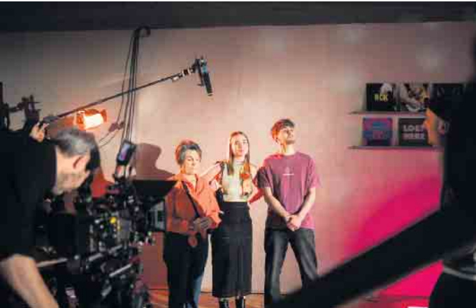
Warten auf den nächsten Einsatz - Foto: Moritz Hartmann

Films im Kölner Umrkreis ist eine anspruchsvolle Aufgabe, die die SchülerInnen eigenständig bewältigen. Jedes Gewerk - angefangen vom Drehbuch und der Regie über Kamera, Schnitt bis hin zu dem Sounddesign - wird von den SchülerInnen umgesetzt. „Say Hello To Ulla“ stellt die Frage, wann man die beste Zeit seines Lebens hat. Er fordert uns heraus, zu überlegen, welche generationsgebundenen Erwartungshaltungen es über den Haufen zu schmeißen gilt. Das neueste Filmprojekt des Joseph-DuMont-Berufskolleg kombiniert jungen Humor mit emotionalem Tiefgang. Nachdem die Premiere von „Say Hello To Ulla“ am 14. März im Cinedom Köln stattgefunden hat, laden wir Sie herzlich zu einer kleinen Nachpremiere in den Clubraum des Siegburger Filmclub e. V. ein. Nutzen Sie die Gelegenheit, nicht nur das Filmprojekt