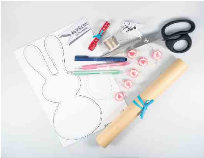
Das Material für die Osterhasentüten auf einen Blick.

Für den Anhänger die ausgedruckte Ostereivorlage oder eine selbst gewählte Form aus Papier ausschneiden und mit verschiedenfarbigen G2-7 Stiften individuell gestalten. Am Ende lochen und mit Schleifenband an der Hasentüte befestigen. Fertig ist das süße Ostergeschenk! (djd)