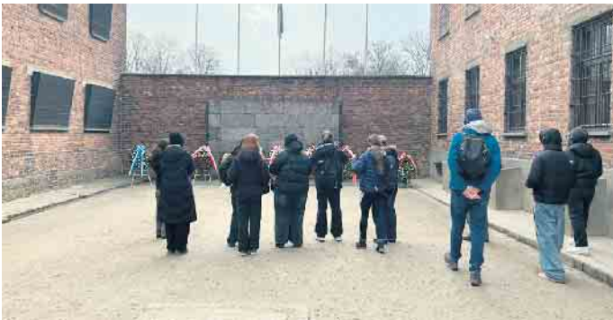
Schüler*innen der Q1 setzten sich mit der Geschichte des Holocausts intensiv auseinander.

causts wachzuhalten und die Bedeutung von Toleranz, Menschenrechten und einem respektvollen Miteinander zu betonen. Die Exkursion ist somit auch ein Aufruf zur Verantwortung in der Gegenwart und Zukunft.