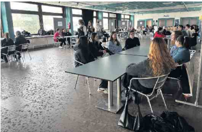
Interessante, informative und offene Gespräche.

zeptes erwies sich die Chance, Fragen zu stellen, die man nicht einfach nachschlagen kann, da sie zu spezifisch oder individuell sind, sowie ganz ehrliche Bewertungen aus der Sicht von Studierenden zu erhalten. Auch die Ehemaligen lobten die produktiven Gespräche und wollen das Konzept fortführen. Und - einige der Anwesenden blieben über den Nachmittag hinaus bereits in Kontakt!