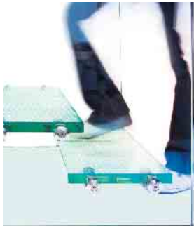
Funktion und Ästhetik in Einklang gebracht: Gläserne Stufen verleihen der Treppe ein elegantes Erscheinungsbild.

sen sich einfach reinigen und behalten dauerhaft ihr attraktives Erscheinungsbild. In der Küche wiederum kann Glas als bedruckte Rückwand oder als leicht zu reinigende Arbeitsplatte dienen. Und nicht in jedem Fall muss das Material komplett durchsichtig sein: Lackierungen, Sandstrahlungen und Ornamente ermöglichen Designs ganz nach eigenem Geschmack. Glasschiebetüren, Glasrückwände und Raumteiler lassen sich zum Beispiel auch mit einem persönlichen Fotomotiv bedrucken. (DJD)