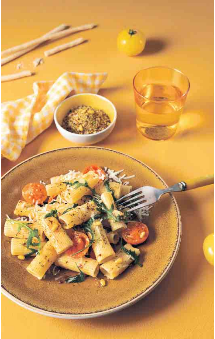
Pasta Pronto bringt innerhalb weniger Minuten La Dolce Vita auf den Esstisch.

Rigatoni in reichlich gesalzenem Wasser bissfest kochen. Tomaten und Rucola waschen. Tomaten halbieren und unter die fertige Pasta mischen. Mit Zitronensaft, Oliven-Öl, Rucola und geriebenem Parmesan verfeinern und mit Pasta/Pizza bestreuen. (akz-o)