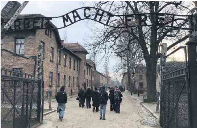
Eindrückliche Erfahrungen im Stammlager Auschwitz I

Ein herzlicher Dank gilt dem Verein G.E.E.Z. für die hervorragende Organisation der Fahrt. Unsere Reise wurde durch die finanzielle Unterstützung der Kreissparkasse Köln, des Lions Clubs Siegburg und des Fördervereins der GE Siegburg ermöglicht.