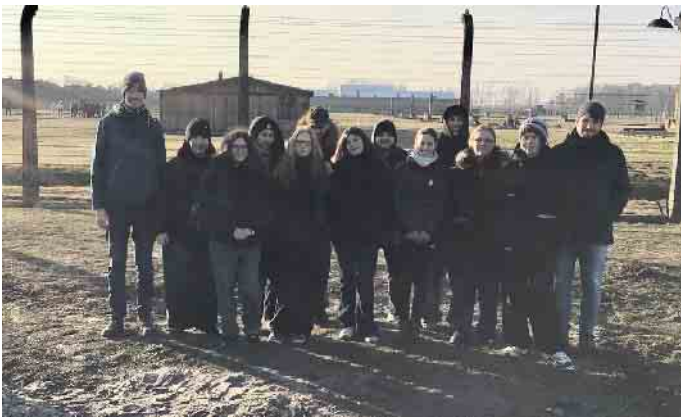
Der Projektkurs der GE am Michaelsberg in Oswiecim