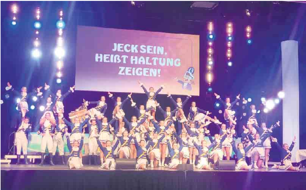
„Jeck sein heißt Haltung zeigen“: Mit ihrem zusätzlich einstudierten Tanz setzt die Große Tanzgarde der Funken Blau-Weiss ein starkes Statement für Demokratie und Vielfalt und gegen Rechts.

Nun - kurz vor der vorgezogenen Wahl am kommenden Sonntag - setzte die Große Tanzgarde der Blau-Weissen auf dieses Statement noch eins drauf - und ein tänzerisches Ausrufezeichen dazu in die sozialen Medien: Dort präsentieren die jugendlichen Tänzerinnen und Tänzer der Funken nämlich einen eigens für diese Aktion auf den Song „Kein Kölsch für Nazis“ zusätzlich einstudierten Gardetanz. Damit setzen sie ein klares Zeichen gegen Hass und Ausgren-