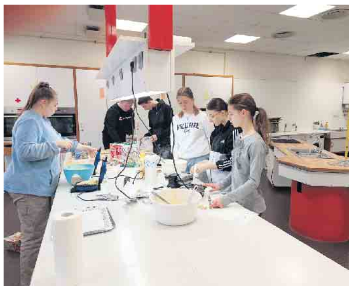
Unsere Jugendlichen backen Waffeln für den guten Zweck

unsere Zehntklässler*innen Waffeln und Laugengebäck, das in den Pausen am 9. und 10. Februar verkauft wird.