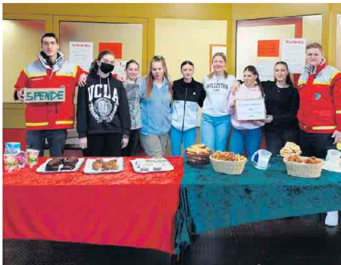
Schüler*innen der GE Am Michaelsberg organisieren eine Spendenaktion für die Erdbebenopfer in der Türkei und in Syrien

Schüler*innen der Gesamtschule Am Michaelsberg starten Hilfsaktion