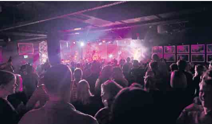
Ganz dicht dran: Die Clubatmosphäre und die Nähe zur Band machten den über einstündigen Auftritt von Miljö zu einem besonders intensiven Erlebnis.

Erstausgabe der Clubparty „Jeck’n’loud“ im Kubana ein voller Erfolg