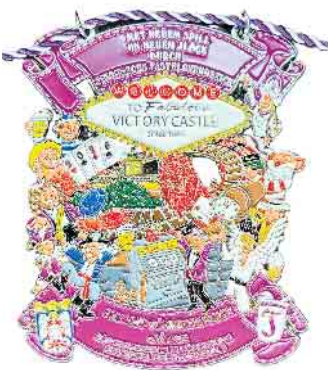
Tönnisberger-Orden 2026: „Met neuem Spill un neuem Jlöck durch Sieburschs Fastelovendszick“. Foto: Tönnisberger „

limitierter Stückzahl gefertigtem Exemplar? Gegen eine angemessene Spende wird das kleine Kunstwerk gerne durch den KG-Vorstand verliehen.