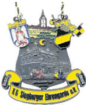
Der „Frankfurter Hof“ in Siegburg-Deichhaus ist das zentrale Motiv des Ehrengarde-Ordens 2025/2026.

teten die „Fidele Deichhause-rinnen“ ihre Sitzungen dort aus. Die Bürger vom Deichhaus, aber auch die aus den umliegenden Veedeln, vermissen den „Frankfurter Hof“ bis heute. Der Ehrengarde-Orden 2026 bildet neben dem Gebäude um 1985 auch die ausgelassene Stimmung der Feiernden ab. Neben dem Hauptmotiv nicht fehlen dürfen bei der Ordensgestaltung natürlich wie jedes Jahr die Abtei auf dem Michaelsberg, das Siegburger Stadtwappen und das Wappen der Siegburger Ehrengarde.