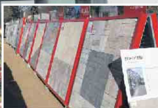
Abb. sind Beispiele! Produkte in Ausstellungen und Lager können abweichen!