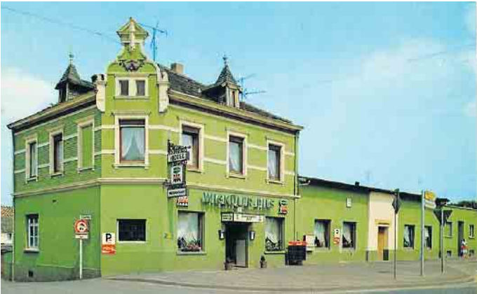
Ein Postkarten-Foto des Frankfurter Hof's um ca. 1985 diente als Vorlage für den aktuellen Orden der gelb-schwarzen KG.

Die Gaststätte „Frankfurter Hof“ ist das Ordensmotiv der Siegburger Ehrengarde