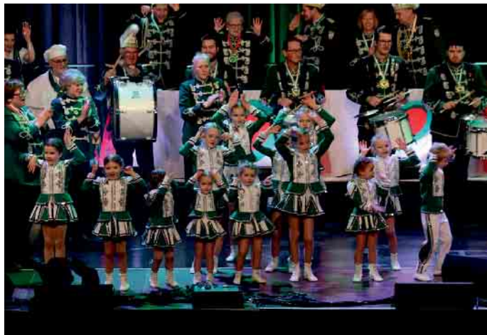
Die Kinder legten mit der Karnevalsmaske den richtigen Tanzstart hin.

Die Stimmung im Saal entwickelte sich im Laufe des Abends zunehmend lebhaft, blieb dabei jedoch familiär und geprägt von gegenseitigem Respekt. Das Kinderanzkorps erhielt für seinen Auftritt ebenso Applaus wie die später folgenden Redner und Musik-