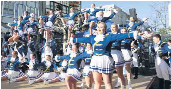
Grandioser Auftritt der Funken-Garde

diesmal geben sie von Café Bonjour gestifteten Baum- und Blechkuchen sowie Glühwein, Kaffee, Kakao und Kölsch gegen eine Spende ab. Zusätzlich sind Mitglieder mit Sammelbüchsen auf dem Markt und in der gesamten Fußgängerzone unterwegs, um möglichst viele Besucher zu erreichen. Vor Ort zeigte sich schon am Vormittag eine ausgelassene, aber ruhige Stimmung. Viele Passanten blieben stehen, verfolgten die Tänze und nutzten das Angebot an Speisen und Getränken. Eine Besucherin sagte, sie sei „begeistert, weil hier für einen guten Zweck gesammelt wird“. Ein anderer Gast lobte die Funken dafür, dass sie den Karneval mit den Farben Blau und Weiß sichtbar machten und dabei auch Jugendliche einbezögen. Eine weitere Stimme aus dem Publikum bemerkte mit Blick auf das winterliche Wetter