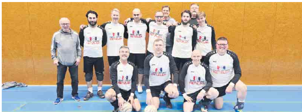
Die Faustballer des STV freuen sich über die Meisterschaft.

Dank einer fulminanten Rückrunde sind die Faustballer des STV Meister in der Bezirksliga geworden und verwiesen in heimischer Halle den Polizei-SV Wuppertal und den Leichlinger TV 3 auf die Plätze. Damit hat sich der STV in die Geschichtsbücher des Faustballs eingetragen. Aller Wahrscheinlichkeit nach wird ab der Hallensaison 2026/27 die Bezirksliga mit der Landesliga zusammengelegt. Für die Feldsaison 2026 greift diese Regelung bereits. Der