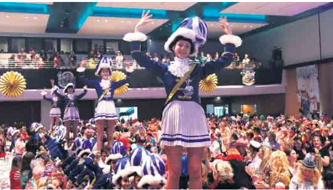
Akrobatische Tanzformation bei einer ausgelassenen Karnevalsfeier vor großem Publikum