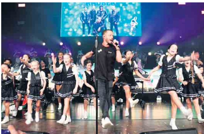
De Spetzeböjer Gardetanzgruppe auf der großen Bühne mit der Band Räuber