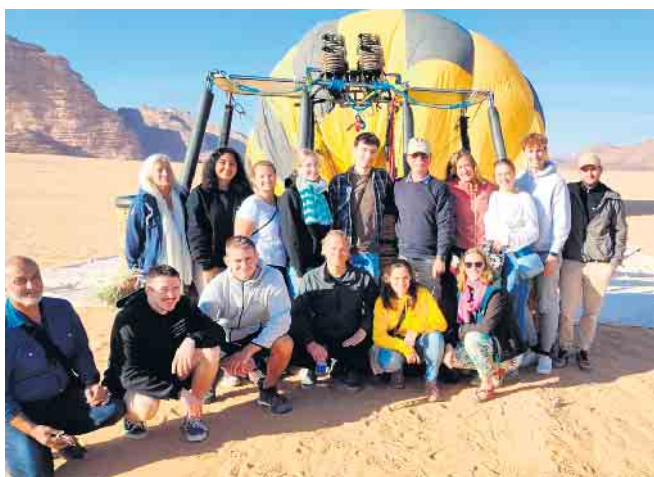
Ballonfahrt im Wadi Rum