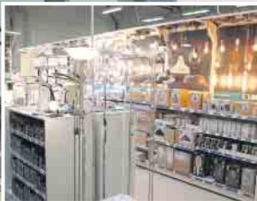
Abb. sind Beispiele! Produkte in Ausstellungen und Lager können abweichen!

KLEIN BAUSTOFFE Baumarkt Brennstoffe FUTTERMARKT