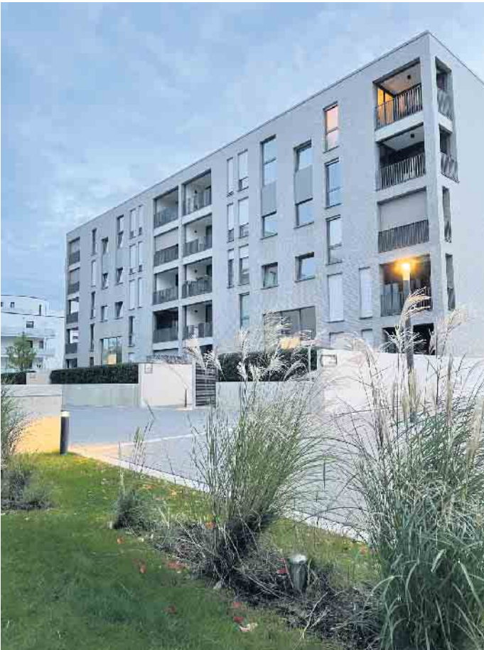
Auch bei Großprojekten der richtige Partner: ROLF Fensterbau

Egal ob eingesparte Heizkosten durch verringerten Wärmeverlust oder Lärmschutz durch Schallisolation, ein Fenstertausch ergibt aus vielen Gründen Sinn. Bei Einfamilienhäusern stellt eine solche Sanierung durch einen Experten keinerlei Probleme dar. Doch wie läuft ein Fenstertausch in einem Haus mit mehreren Parteien und bei vollem Wohnbetrieb ab?