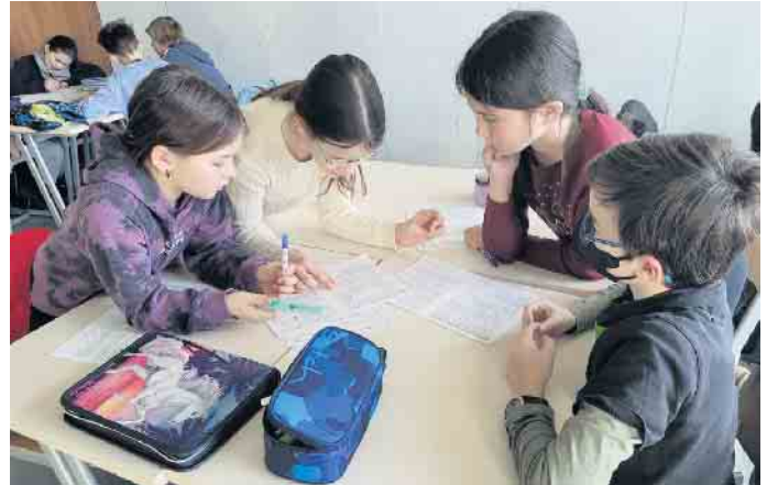
Junge Teilnehmerinnen und Teilnehmer beim Knobeln.

Der Wettbewerb ist seit 2020 am Anno etabliert und wird vom Förderverein bezuschusst, der seit Jahren dankenswerterweise die Anmeldegebühr für alle qualifizierten Teilnehmerinnen und Teilnehmer übernimmt und damit ermöglichte, dass vor allem