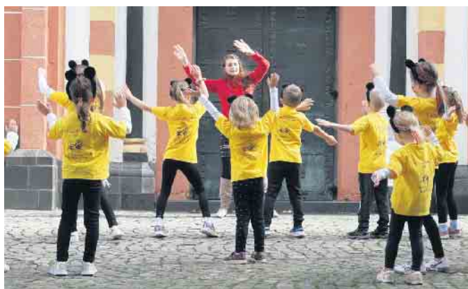
Generalprobe vor dem Auftritt

Auch für ältere Kinder / Jugendliche und Erwachsene bietet der Rock'n'Roll Club attraktive Einstiegsangebote im Februar. Nehmen Sie gerne Kontakt mit uns auf.