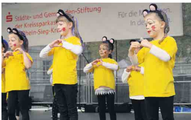
Auftritt auf dem Kinderfest 2022 in Siegburg