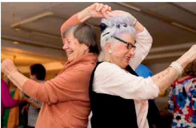
„Tanzen in der Gruppe“ ist ein neues Angebot des Vereins „Leben mit Krebs“.