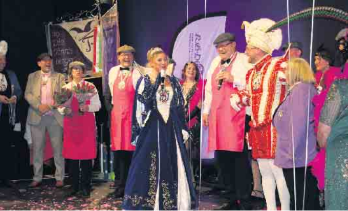
Pretty in Pink - Als Weinkellner empfing die KG das Siegburger Prinzenpaar.

Lila-weiße Karnevalisten zündeten mit ihren Gästen ein Feuerwerk der guten Laune