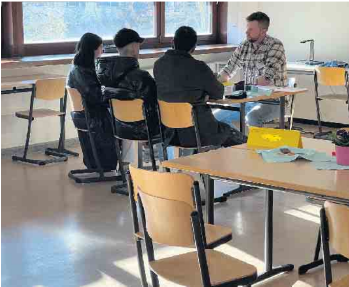
Beratungs- und Anmeldegespräche am Tag der offenen Tür

informieren in Siegburg und an den Teilstandorten Bad Honnef, Eitorf und Neunkirchen über Aufnahmevoraussetzungen, Schwerpunkte und Abschlüsse der jeweiligen Bildungsgänge. Informieren kann man sich zum Beispiel auch über die Erasmus+-Projekte, die bereits in die vierte Runde gehen und Schülerinnen und Schüler bei der Durchführung von Auslandspraktika unterstützen oder Kontakte zu Schulen im Ausland knüpfen. Die Kooperation des Beruflichen Gymnasiums mit der Hochschule Bonn-Rhein-Sieg gehört ebenfalls zu den besonderen Angeboten der Schule. Einzelnen Schülerinnen und Schülern der Oberstufe wird hierbei bereits vor Schulabschluss ermöglicht, Vorlesungen der Hochschule zu besuchen und Credit Points zu erwerben. Auch der Unterricht im Fach „Berufsorientierung“ sowie zahlreiche Projekte zur Unterstützung der jungen Leute bei der Berufswahl und Bewerbung in allen Bildungsgängen - darunter Kommunikationsseminare, Workshops zur Vorbereitung auf das Assessment-Center, VR-Brillen, die eine realitätsnahe Erkundung von Berufen ermöglichen oder der schuleigene Ausbildungsinformationstag (AIT) - zeichnen die Schule besonders aus. Der Hauptstandort des Berufskollegs ist zentral und verkehrstechnisch günstig am Bahnhof in Siegburg gelegen. Termine für persönliche Bera-