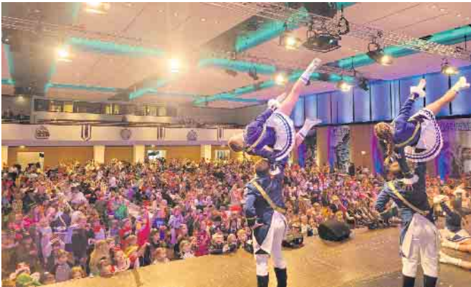
Auch die Große Tanzgarde der Funken sorgt auf dem blau-weißen Kinderkostümfest regelmäßig für große Faszination und helle Begeisterung bei den bunt kostümierten Kindern im großen Saal des Rhein Sieg Forums.