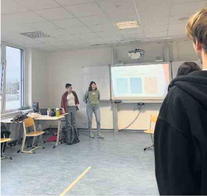
Die Mitarbeiterinnen von „PlanPolitik“ bei der Einführung

munikation erleichterte zunächst den Austausch der Vertreterinnen und Vertreter der jeweiligen Länder. Doch dann entwickelte sich eine hitzige Diskussion und die Atmosphäre wurde immer angespannter - somit gerieten die Vertretenden der jeweiligen EU-Länder in Aufregung. Diese Simulation fühlte sich für die Teilnehmenden unglaublich real an, wie sie im Anschluss ihre Gefühle während des Planspiels beschrieben. Die Podiumsdiskussion wurde von einem vorher gewählten Europarat (bestehend aus Schülerinnen und Schülern) geleitet. Jeder