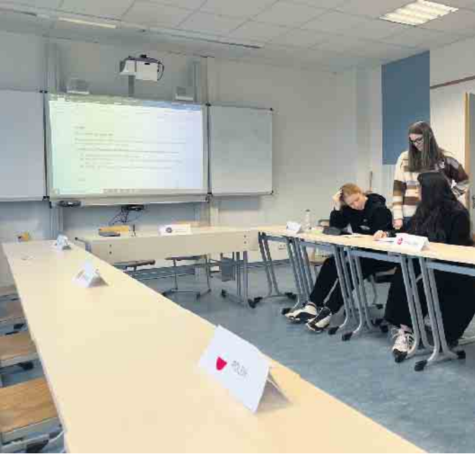
Eine Ländervertretung berät über ihre Strategie.

Planspiel Europa-Parlament am Anno-Gymnasium