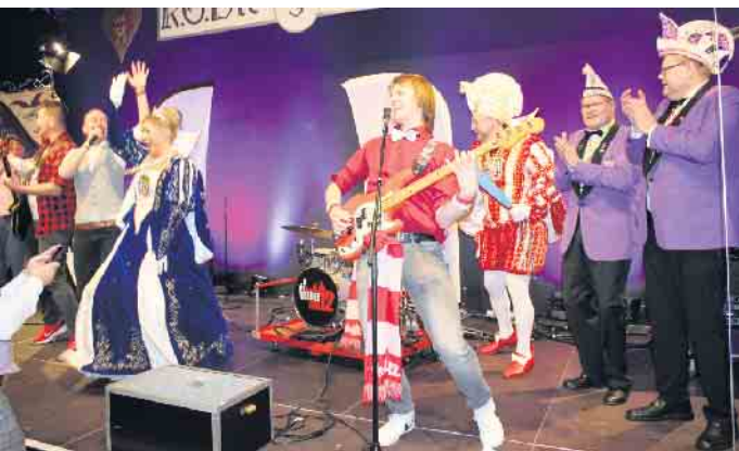
Für furioses Partyfinale sorgte die Kölschrockband „Veedel for 12“.