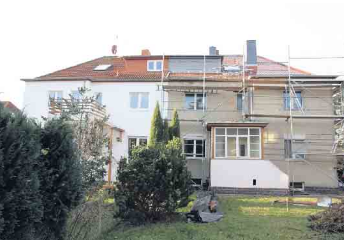
Laut einer aktuellen Verbraucherschutzstudie sind Baumängel auch in der Sanierung von Altbauten keine Seltenheit.

Renovierungen richtig planen und sicher durchführen