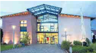
Das Bundesausbildungszentrum der Bestatter.

lernen sie zum Teil ganz unterschiedliche Bestattungsunternehmen kennen, besuchen die Berufsschule und werden schließlich auch im Bundesausbildungszentrum der Bestatter im unterfränkischen Münnerstadt aktiv. Vielfältige Fähigkeiten und Empathie gefragt Wer den Bestatterberuf anstrebt,