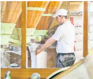
Der Müllerberuf bietet eine sichere Zukunft und zahlreiche Karriere-möglichkeiten im In- und Ausland.

Wir suchen für die SSE Deutschland GmbH für unseren Standort der Hauptverwaltung in Troisdorf zum nächstmöglichen Zeitpunkt in Vollzeit (40 Stunden/Woche) einen: