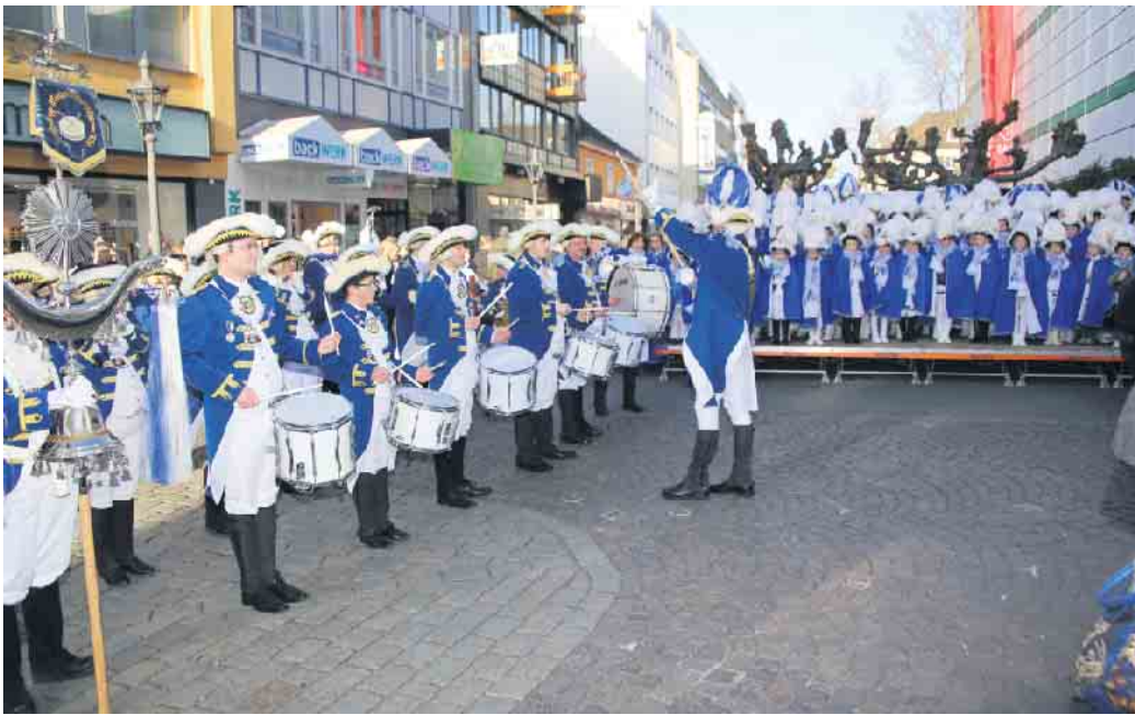
Zum klingenden Spiel ihres Regimentsspielmannszuges marschieren die Funken Blau-Weiss mit all ihren Tanzgruppen vor dem Kaufhof auf.

Bis gegen 13 Uhr geben die Funken nämlich vor dem Siegburger Kaufhof wieder vom Café Bonjour gestifteten Baum- und Blechkuchen sowie Glühwein, Kaffee, Kakao und auch Kölsch jeweils gegen eine kleine Spende zugunsten des Altenhilfswerkes „Die gute Tat e.V.“ an die Passanten in der Siegburger City ab. Außerdem