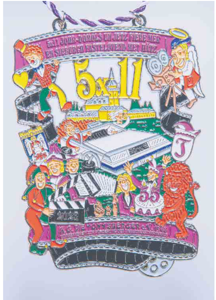
Tönnisberger-Jubiläumsorden 2023: „5 x 11 Jahr -Domols un jetz fiere mer en Sieburch Fastelovend met Hätz“

und Narr, der die Regie-Klappe mit der Jahreszahl schlägt. In Anlehnung an die 1. Mini-Sitzung 1970 im „Tönnisberger Hof“ mit Einmann-Kapelle und Bierdeckel-Orden sorgt ein Akkordeonspieler für Stimmung. Als Markenzeichen darf auch die Tonkrugfamilie mit Bartmännchen, Kannenkrug und kleinem Henkeltopf nicht fehlen. Darüber erstrahlt die Jubiläumszahl „5 x 11“ sowie die einstige Abtei Michaelsberg. Gefasst ist das Bild in lila-schwarze Zelluloid-Filmrollen. Oben präsentiert ein Clown mit Goldherz das Motto. Mittig sind Stadtwappen und KG-Wappen -das lila T unter der Narrenkappe- sowie unten der Vereinsname geprägt. Interesse an einem, in limitierter Stückzahl gefertigtem Exemplar? Gegen eine angemessene Spende wird das kleine Kunstwerk gerne durch den Vorstand verliehen. Infos unter: www.dietoennisberger.de