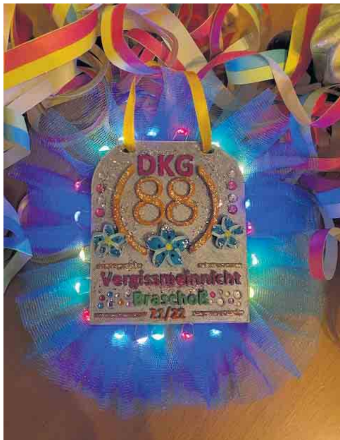
Orden der DKG Vergissmeinnicht Session 2021/22

Die Kartenausgabe findet am Mittwoch, 8. Februar, von 19 bis 20 Uhr, im Saal der Gaststätte „Zum Turm“ statt.