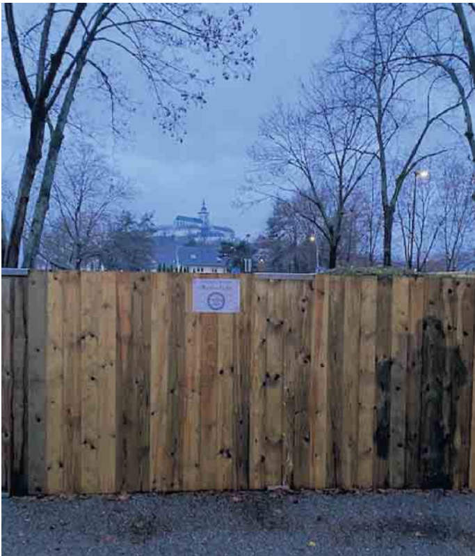
Bauzaun wird Sprühfläche

Ende: Aus der Arbeit der Ratspartei B90/Grüne