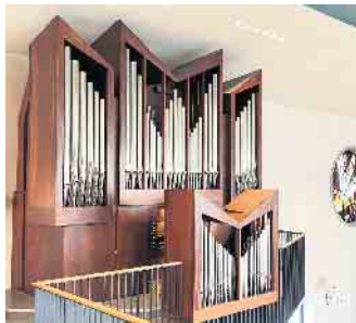
Orgel der Auferstehungskirche