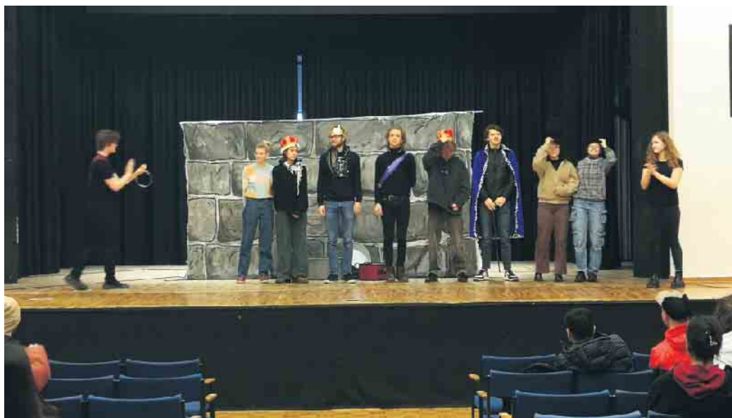
Die jungen Schauspielerinnen und Schauspieler begeisterten ihr Publikum

Als letzte Gruppe strömten Acht- und Neuntklässler in die Aula, um sich das Stück „Furious Games“ und die Erfahrungen des Teenagers John anzuschauen, der in seinem Schulalltag mit Aggressionen und Gewalt konfrontiert ist. Den anspruchsvollen englischen Dialogen und der schauspielerischen Darbietung folgten die Klassen sehr konzentriert: John und