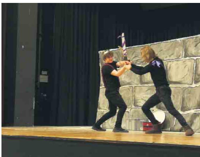
Der Theater-Tag am GSA bot Spannung und mitreißende Szenen.