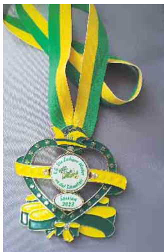
Unser Orden 2023