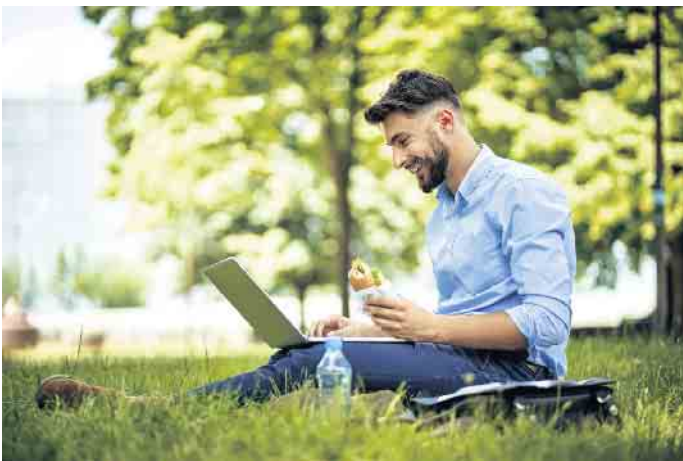
Bei jüngeren Mitarbeitern mit hoher digitaler Affinität hat vor allem das mobile Arbeiten stark an Beliebtheit gewonnen.

Dienstvereinbarungen dieser Art ermöglichen in erster Linie eine selbstbestimmte Arbeitsgestaltung. Zusätzlich können Freiräume für die Angestellten geschaffen werden, indem etwa lange Wege zur Arbeitsstätte entfallen oder die Vereinbarung von Familie und Beruf nachhaltig positiv gefördert wird. „Arbeitgeber wiederum erhöhen durch das Angebot von flexibel vereinbarten Modellen ihre Attraktivität gegenüber den Beschäftigten und deren Bindung zum Unternehmen“, erläutert Frank Preidel.