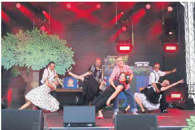
Boogie-Woogie Show-Gruppe beim Auftritt auf dem Siegburger Stadtfest

Neue Einsteiger Kurse im Boogie-Woogie des RRC Siegburg e.V.