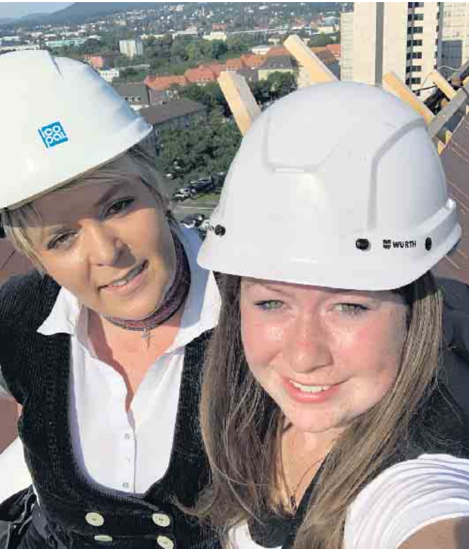
Klimaschutz, keine reine Männersache; es gibt auch Frauen im Dachdeckerhandwerk.

Zunehmend wird es auch wichtig, den bereits deutlich spürbaren Veränderungen durch den Klimawandel zu begegnen, zum Beispiel der Hitzebelastung in Ballungsgebieten. „Dachdecker und Dachdeckerinnen sorgen mit ihrer fundierten Arbeit nicht nur für eine trockene und behagliche Wohnung, sondern tragen als Teil einer klimabewussten Gesellschaft mit ihrer Arbeit dazu bei, dass unsere Welt auch in Zukunft lebenswert bleibt. Denn neben der Sanierung bringen Dachdecker auch Fotovoltaikanlagen aufs Dach oder planen Gründächer.