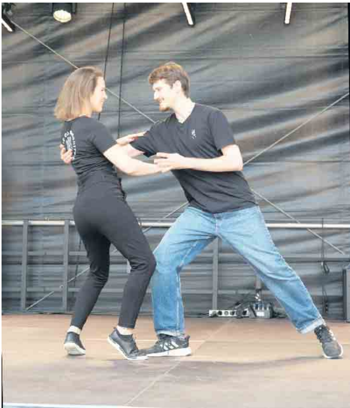
Auftritt auf dem Stadtfest