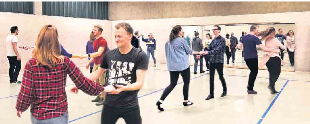
Aus dem Training

blem! Man kann sich sowohl paarweise, als auch einzeln anmelden. Anfänger tanzen im Januar kostenlos als Probetraining mit, immer dienstags von 20 bis 21 Uhr. Let's swing it and have a blast!