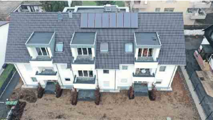
Das Dachdeckerhandwerk, der richtige Ansprechpartner für die Solaranlage auf dem Dach.

Wir suchen für die SSE Deutschland GmbH für unseren Standort der Hauptverwaltung in Troisdorf zum nächstmöglichen Zeitpunkt in Vollzeit 40 Stunden/Woche einen