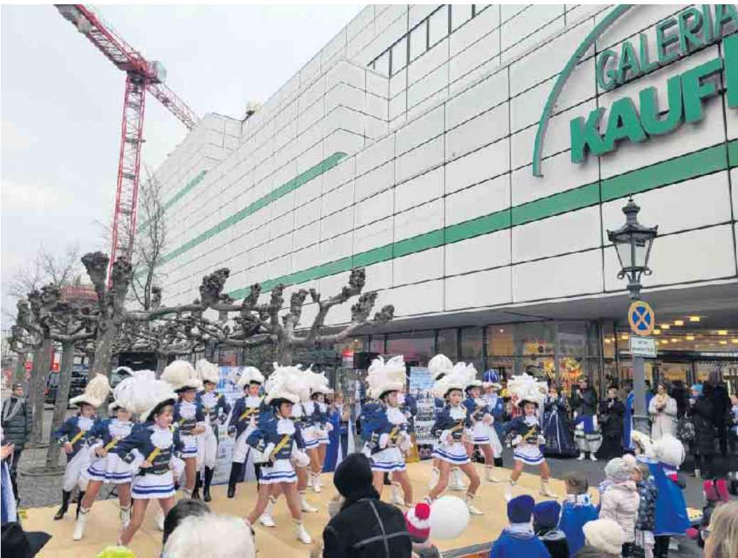
Die Jugendtanzgruppe der Funken Blau-Weiß im sportlichen Einsatz für einen guten Zweck: Auch in diesem Jahr marschieren die Funken mit allen ihren Tanzgruppen vor dem Kaufhof auf, um den Straßenkarneval im neuen Jahr zu eröffnen und sich dabei zugleich sozial zu engagieren.

Mit ihrem gesamten Funkencorps marschieren die Siegburger Funken Blau-Weiß am Samstag, 13. Januar, um „elf vor elf“ zum Auftakt des Straßenkarnevals im neuen Jahr vor dem Kaufhof in der Siegburger Fußgängerzone auf. Nach dem Aufzug des gesamten Corps werden auf der dort aufgebauten Bühne sämtliche Tanzgruppen der Funken Blau-Weiß ihre Tänze präsentieren und damit die Passanten schwungvoll auf die „fünfte Jahreszeit“ einstimmen. Darüber hinaus sind die Blau-Weißen an diesem Samstag zum wiederholten Male für wohltätige Zwecke im Einsatz.