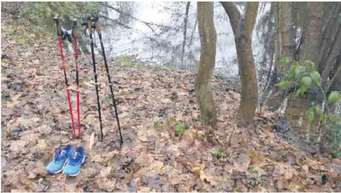
Schuhe und Stöcke warten auf ihren Einsatz.

19. März: 10 Uhr - Parkplatz Jägerstr (Zeithstr.), 26. März: 10 Uhr - Mühlenhof Parkplatz (Haus zur Mühlen, Alexianerallee), Für weitere Fragen steht Ihnen Norbert Ginkel, mobil: 0175 9449333, gerne zur Verfügung.