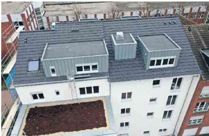
Dachdecker lassen Dächer auch ergünen.

Dirk Bollwerk und ergänzt, dass das Dachdeckerhandwerk bislang auch gut durch die Coronakrise gekommen sei: kaum Kurzarbeit und wenige Entlassungen. Auch dies ein Pluspunkt, der für eine Dachdecker-Ausbildung spricht: Dachdecker sind immer gefragt. Mehr Infos unter www.dachdeckerdeinberuf.de (akz-o)