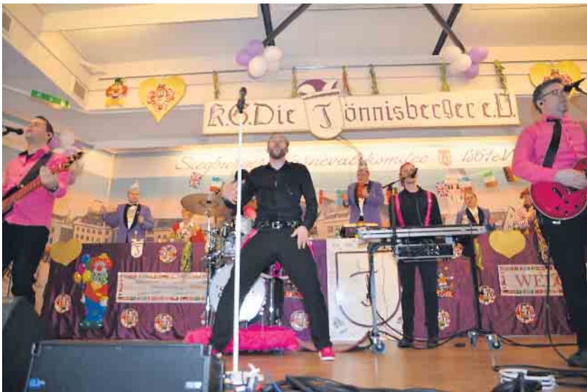
Mega-Stimmung ist auf der Tönnisberger-Prunksitzung 2024 garantiert.