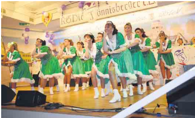
Spaßiges Kölsches Tanz-Theater zeigen die „Poppelsdorfer Schloss-Madämcher und Schloss-Junker „ Bonn.“