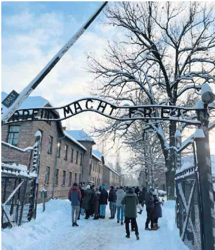
Schüler*innen der GE Am Michaelsberg in Auschwitz-Birkenau

Besonders die Baracken und der Rundgang durch die sogenannte „Zentralsauna“, die als „Entwessungs- und Desinfektionsanlage“ bei der Aufnahme von deportierten Menschen diente, sorgte bei den Oberstufenschülern für Fassungslosigkeit, Trauer und Wut. Tiefe Eindrücke hinterließ der Besuch der Kunstaussstellung der Auschwitz-Überlebenden Marian Kolodziej in Harmeze mit anschließender Reflexion. In Krakau befassten sich die Jugendlichen mit dem Leben im jüdischen Viertel Kazimierz vor dem deutschen Überfall auf Polen. Eine nahezu einmalige Gelegenheit der Auseinandersetzung mit den nationalsozialistischen Verbrechen ermöglichte ein Gespräch mit Lidia Maskymowicz, die Auschwitz-Birkenau als Kleinkind überlebte. Nachdem Sie von ihren Erlebnissen und ihrem Überleben berichtete, entwickelte sich ein reger Austausch, der keinen der TeilnehmerInnen unberührt ließ. Die Schüler verbrachten in Krakau eine sehr lehrreiche Zeit. Ihre Projektarbeiten werden am Ende des Schuljahres im Rahmen einer Ausstellung vorgestellt.