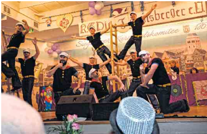
Rasante Beinarbeit und Akrobatik präsentieren die „Vulkanelfen“ Niederzissen