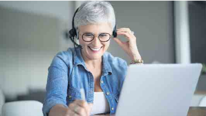
Online-Coaching ist auch nach dem Abflauen der Pandemie als Option des Austauschs zwischen Coach und Klientin nicht mehr wegzudenken.