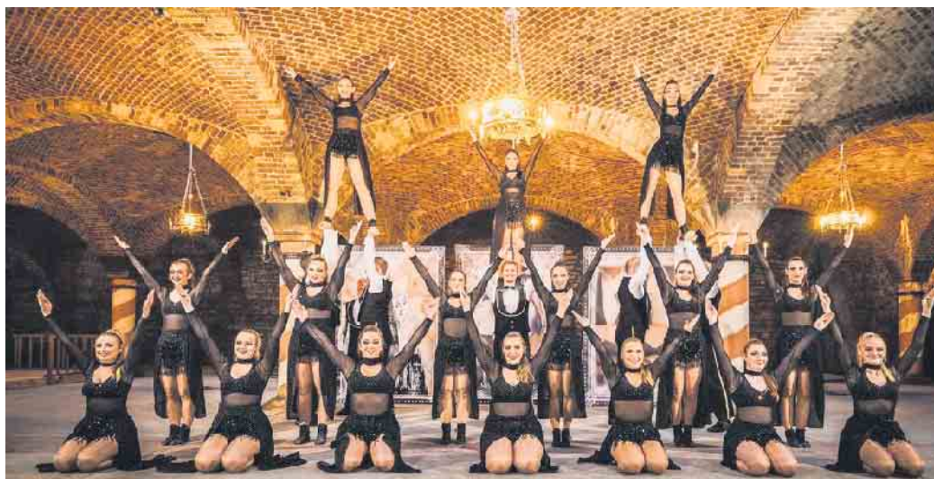
4711 Agent Schmitz - In raderdoller Mission Ihrer Majestät FastelOVEnd unterwegs: Magic Dancers Remagen.

klusive Zugbeitrag (Sparfuchs-Angebot: vier Tickets nehmen - nur drei bezahlen!) Keine Abendkasse! Kartenverkauf bei KG-Geschäftsstelle: Sandweg 32, 53721 Siegburg, 02241/65232 bzw. E-Mail: toennisberger@arcor.de . Farbenfrohe Kostümierungen erwünscht! Infos unter: www.dietoennisberger.de