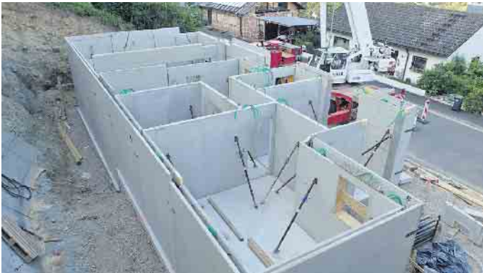
Schwieriger Baugrund muss kein Ausschlusskriterium für Bauherren sein, sondern kann beispielsweise bei einer Hanglage sogar langfristig Vorteile wie eine schöne unverbaubare Aussicht bieten.

Über den Feuchtigkeitsschutz hinaus erhalten Bauherren eines RAL-zertifizierten Fertigkellerherstellers weitere technische Qualitätsversprechen sowie eine Fertigstellungs- und Servicegarantie. Damit können sie sich fairen Zahlungsmodalitäten und der exakten Umsetzung der erforderlichen Baumaßnahmen im Zuge der Energieeinsparverordnung, neuer DIN-Normen oder statischer Besonderheiten sicher sein. Stephan Braun schließt: „Die Erfahrung hat uns gelehrt, dass auf so manchem anspruchsvollen Baugrund oft die schönsten Häuser entstehen - sei es in Wassernähe oder auch an einem steilen Südhang. Der Keller ist in diesen Häusern sogar mehr als ein sicheres Fundament. Er ist ein echter Zugewinn an Wohnfläche und Wohnkomfort.“