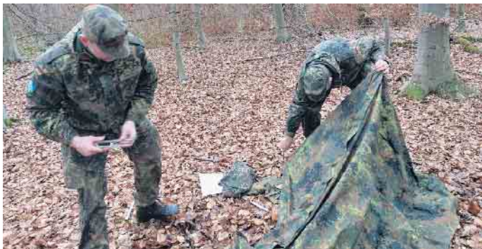
Alles mal gelernt und doch gut es immer wieder zu üben: Aufbau der Dacklegarage.

Der einsetzende Regen spielte dabei keine Rolle. Im Anschluss feierten die Kameraden noch das Offizierspatent des Kameraden Sulzbach. Das neue Jahr kann kommen! Olaf Kortenhoff