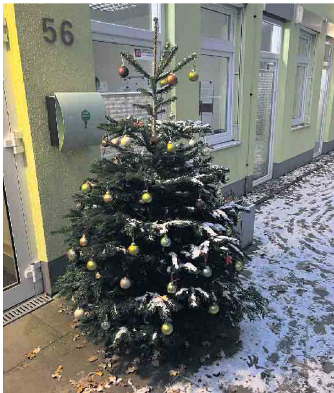
Weihnachtsbaum der Kita Kiku Wäldchen in Spich

Bleiben Sie gesund und bis nächstes Jahr. Wir freuen uns.