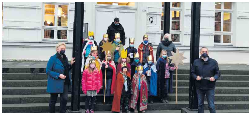
Sternsingerempfang 2022.

büro in der Mühlenstraße 6 abgeben und bei größeren Beträgen eine Spendenquittung erhalten. Alle Informationen zur Sternsingeraktion finden Sie auf der Homepage der Kirchengemeinde https://www.servatius-siegburg.de/gemeindeleben/jugend/Sternsingeraktion-2023/Uebersicht/ .