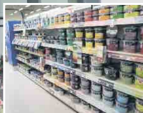
Abb. sind Beispiele! Produkte in Ausstellungen und Lager können abweichen!

KLEIN BAUSTOFFE Baumarkt Brennstoffe FUTTERMARKT