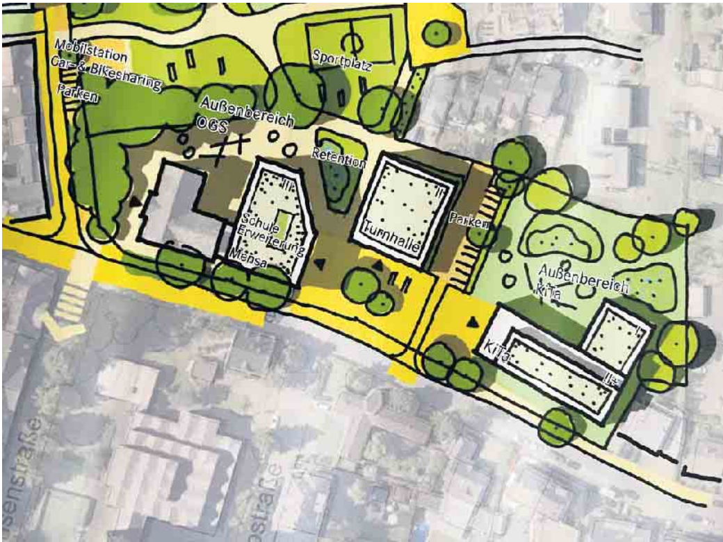
So fügen sich KiTa und OGS ins Quartier

Ende: Aus der Arbeit der Ratspartei B90/Grüne