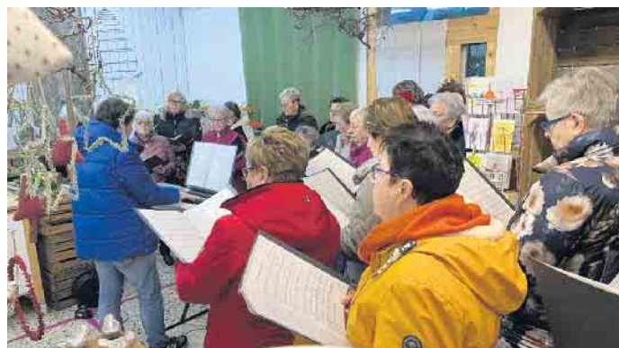
Ständchen Gärtnerei Lenz

Am 23. Dezember sangen wir bei der Gärtnerei Lenz, zu deren letzten Verkaufstag, als Dankeschön für die langjährige Unterstützung, ein Ständchen.