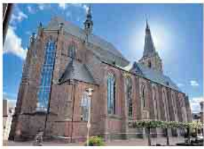
Katholische Kirche Straelen