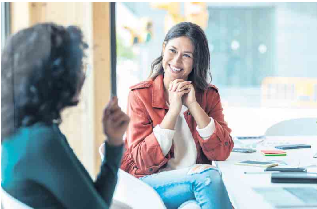
Ein Bewerbungsgespräch ist immer ein Dialog, bei dem auch der Arbeitgeber auf dem Prüfstand steht.

Geförderte Coachings helfen dabei, genau die passende Stelle zu finden