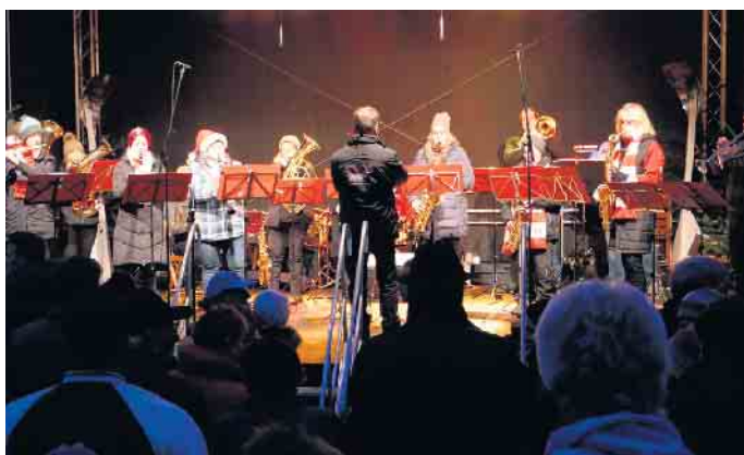
...mit dem Bröltaler Musikverein