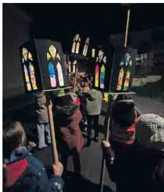
Der Zug setzt sich in Bewegung.