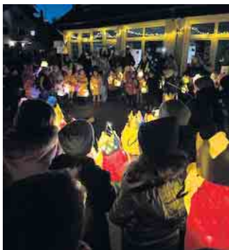
Die Schüler singen auf dem Schulhof St. Martinslieder.

Laternen, stolzen Eltern, begeisterten Kindern und erstmals auch einer dorfeigenen „Sankt Martina“, die in diesem Jahr mit ihrer Schwester den Zug anführte. Den krönenden Abschluss bildete das grandiose Martinsfeuer unter dem klaren Mondhimmel, das Klein und Groß gleichermaßen verzauberte. Bei Würstchen, Getränken und guten Gesprächen fand der Abend einen gemütlichen Ausklang auf dem Schulhof unserer Grundschule.