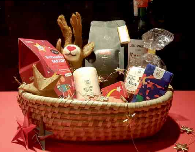
Beispiel eines Geschenkpackchens aus dem Eine-Welt-Laden

dern erfreuen auch die Menschen im globalen Süden, die die Sachen angebaut oder hergestellt haben und dafür fair entlohnt wurden. Also eine gute Sache für alle Beteiligten. Gerne beraten wir Sie und stellen Ihnen individuelle Präsenten zusammen, egal ob es nur ein einzelnes Päckchen sein soll oder mehrere für die schon erwähnten guten Chefs, die ihren Mitarbeiterinnen und Mitarbeitern Anerkennungen für gute Arbeit geben möchten. Schauen Sie sich doch einfach mal um, wir haben ein paar Musterpäckchen im Laden. Sie finden uns auf der Rückseite des Rathauses. Unsere Öffnungszeiten sind dienstags bis freitags von 9:30 bis 12:30 Uhr und von 15 bis 18 Uhr sowie samstags von 9:30 bis 12:30 Uhr. Hinweis: Am Freitag, 5. Dezember, ist um 17 Uhr Adventsliedersingen im Eine-Welt-Laden und der Laden ganztags geöffnet.