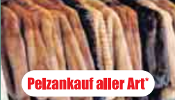
Pelzankauf aller Art