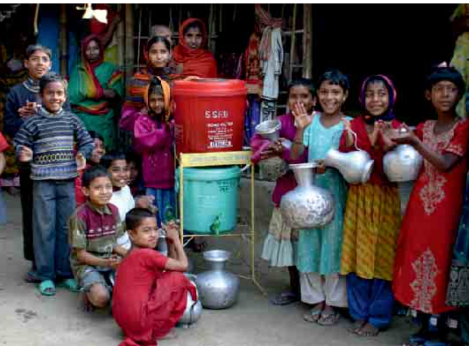
Die Kinder freuen sich über die Wasserfilter

Alle Firmen in Nümbrecht und Umgebung, die sich bisher noch nicht beteiligt haben, können mit einer Spende bzw. Gutscheinen