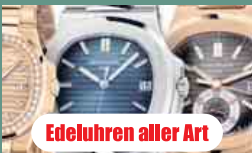
Edeluhren aller Art