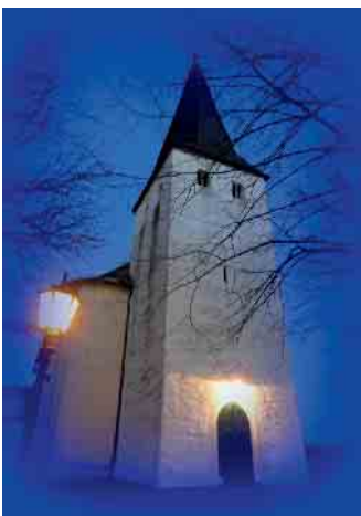
Der Eintritt ist frei. Eine Spende wird erbeten.