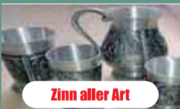
Zinn aller Art